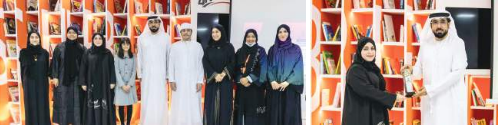
أبوظبي - ا.الوحدة:

نظم الأرشيف الوطني ووزارة التربية والتعليم حفلاً افتراضياً خاصاً لتكريم طالبة «كتاب الخمسين» على هامش معرض الشارقة الدولي للكتاب، وذلك عرفاناً بجهود الطالبة الذين استطاعوا أن يستشفروا المستقبل في نصف القرن القادم، وأن يعبروا في محتواها عن إبداعهم ووعيمهم، وانتماهم للوطن وولائهم لقيادته الحكيمة. وأقرت مبادرة «كتاب الخمسين» ٥٠ قصة وطنية بعنوان: «المجموعة القصصية لكتاب الخمسين»، وتعد هذه القصص ثماراً حقيقية للجهود التي بذلها الطلبة بتوجيه ومتابعة من