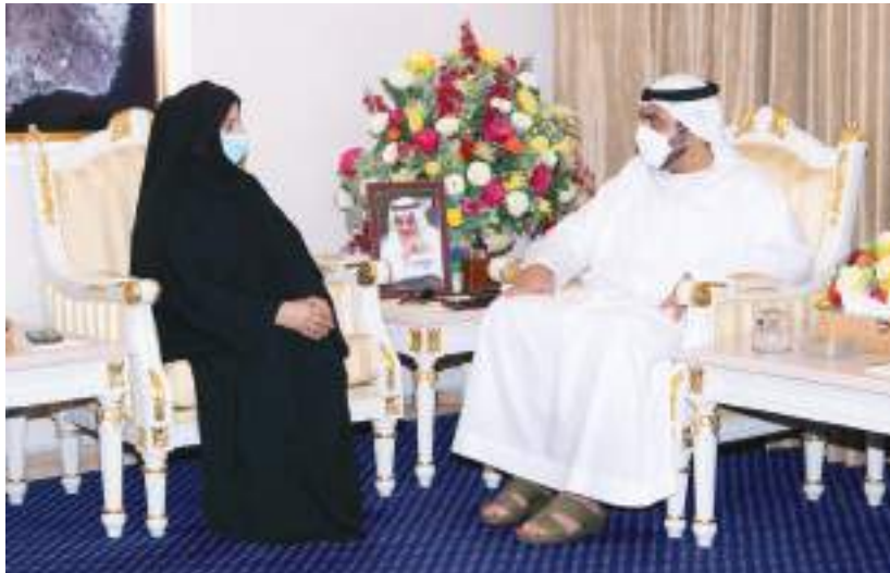
ولي عهد الفجيرة خلال استقباله مديرة هيئة الفجيرة للبيئة