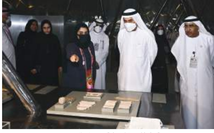
صقر غباش خلال زيارته معرض إكسبو دبي