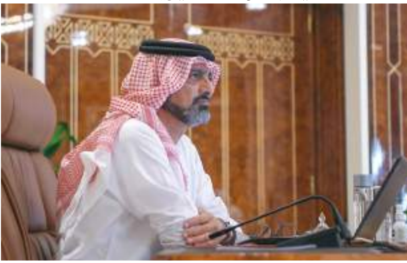
ولي عهد عجمان خلال ترويسه الاجتماع