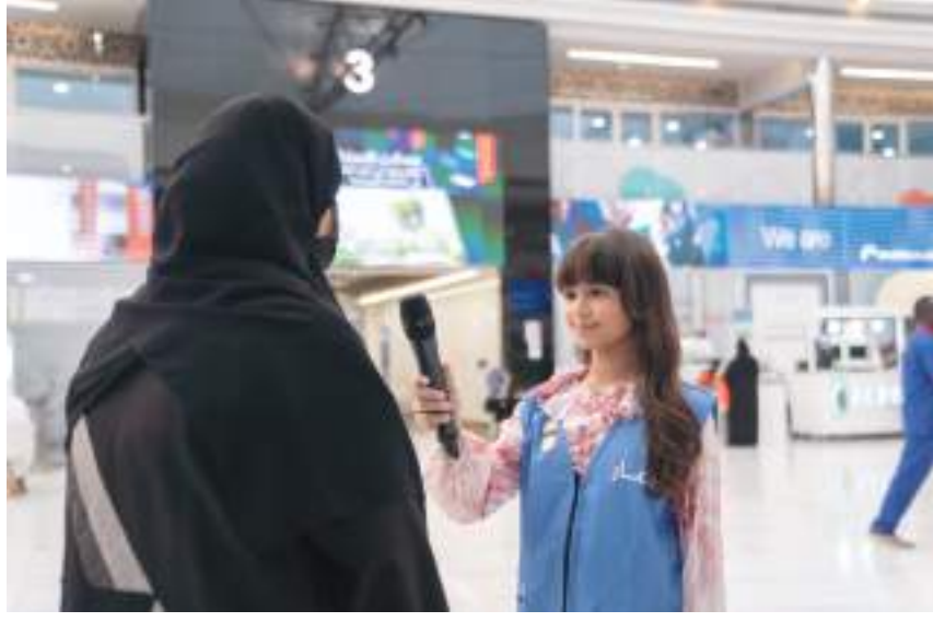
الشارقة - و.امم: