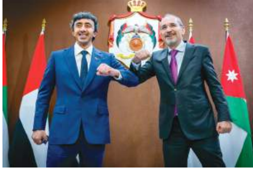
عبدالله بن زايد خلال لقائه وزير خارجية الأردن في عمان