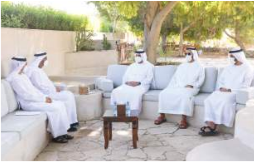
حاكم رأس الخيمة خلال الاستقبال بحضور ولي عهد

وأشاد سموه - خلال الزيارة التي شملت مختبر المستقبل - بالمشروع المبتكر الذي طوره مجندو الخدمة الوطنية، على مدى عام كامل، وتعترف من المجندين الذين أنجزوا مشروع الخرائط البحرية، على تفاصيل مشروعهم وأهميته لدولة الإمارات، وأثنى على أفكارهم ومهاراتهم وعزمهم في إنجاز المشروع وتحويله إلى واقع، في السياق ذاته، زار الفريق سمو الشيخ سيف بن زايد آل نهيان، واللواء الركن طيار الشيخ أحمد بن طحنون بن محمد آل نهيان، مقر مؤسسة «بالمود» في أبراج الإمارات دبي، حيث تعرفا من فريق العمل على المشاريع التي يتم العمل عليها حالياً، ومنهجية عمل المؤسسة التي تعد الأولى من نوعها في المنطقة والمتخصصة في مجال ريادة وتصميم المستقبل، من خلال تقديم حلول مبتكرة ومستقبلية للتحديات التي تواجهها المؤسسات الحكومية والخاصة في المجالات الخدمية والتنمية والتقنية في الدولة، وتفعيل آليات العمل في القطاعين الحكومي والخاص لتسريع الإنجازات، وتعد «بالمود» التي تم تأسيسها ضمن شراكة بين دولة الإمارات ومؤسسة «أي دي إي أو» العالمية للاستشارات والتصميم المبتكر، من أكبر المؤسسات العالمية في مجال تصميم المفاهيم المبتكرة وتطوير العديد من المنتجات والخدمات وابتكار الحلول التقنية، وتجسد المؤسسة، الشراكة بين القطاعين الحكومي والخاص، والمبتكرين لتطوير الحلول للتحديات الكبرى، بهدف تطبيق الأفكار وتوظيفها في خدمة المجتمعات، وتصميم مستقبل أفضل للأجيال القادمة.