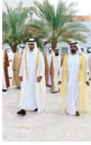
محمد بن راشد ومحمد بن زايد وسعود بن صقر والشيخ يشهدون زفاف حمدان بن محمد بن زايد و١٥٠ عريساً من أبناء الوطن «أفراح الخمسين»