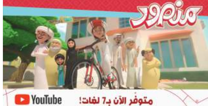
أبوظبي - ا.الوحدة: