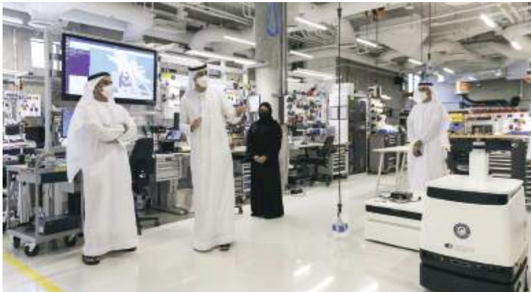
سيف بن زايد وأحمد بن طحنون خلال الزيارة