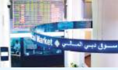
ديجيا - (الوحدة):

أنهى سوق دبي المالي تداولات الأسبوع الماضي، مرتفعاً بنسبة ٠,١٪ عند مستوى ٣٢٦٥ نقطة، وتداولات بلغت قيمتها الإجمالية ٨٢٤ مليون درهم. وأقل سوق أبوظبي للأوراق المالية يوم الخميس الماضي، مرتفعاً بنسبة ٠,١٪ عند مستوى ٨٣٤٩ نقطة، وتداولات بلغت قيمتها الإجمالية ١,٨ مليار درهم. وقد ارتفع خام «برنت القياسي» يوم الخميس الماضي بنسبة ١,٢٪ أو ٩٦ سنتاً، فيما تراجع يوم الجمعة بنحو ٢,٩٪ أو ٢,٣٥ دولار إلى ٧٨,٨٩ دولار للبرميل، ليتراجع بنحو ٤٪ في إجمالي تعاملات الأسبوع. وارتفع خام «نايمكس» يوم الخميس الماضي بنسبة ٠,٨٪ أو ٦٥ سنتاً، فيما هبط يوم الجمعة بنسبة ٣,٧٪ أو ٢,٩١ دولار مسجلاً ٧٦,١٠ دولار للبرميل، في آخر أيام تداول هذا العقد، ليسجل خسائر أسبوعية ٥,٨٪. وفيما يخص الأسواق العالمية، سجل مؤشر الداوجونز الصناعي انخفاضاً يوم الخميس بنسبة ٠,٢٪ أو ٦٠ نقطة، فيما هبط يوم الجمعة بنسبة ٠,٧٪ أو ٢٦٨ نقطة ليصل إلى ٣٥,٦٠١ ألف نقطة، ليسجل خسائر أسبوعية ١,٤٪ وانخفضت أسعار عقود الذهب يوم الخميس بنسبة ٠,٥٪ أو ٨,٨٠٠ دولار، كما تراجع يوم الجمعة بنسبة ٠,٥٪ أو ٩,٨٠٠ دولار ليسجل أسبوعية بنسبة ٠,٩٪.