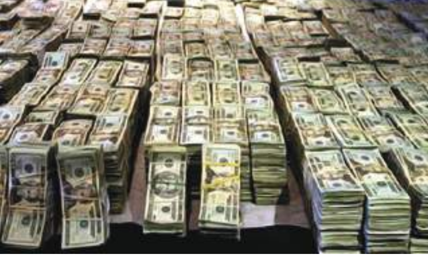
نيويورك - (وكالات):