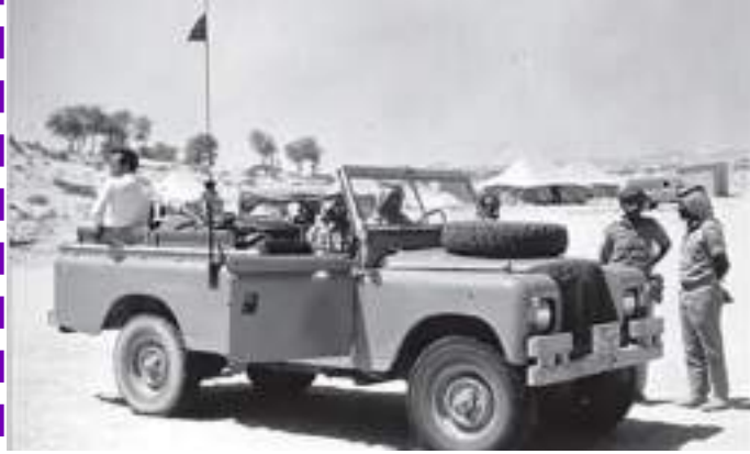
سيارة عسكرية في أحد المعسكرات