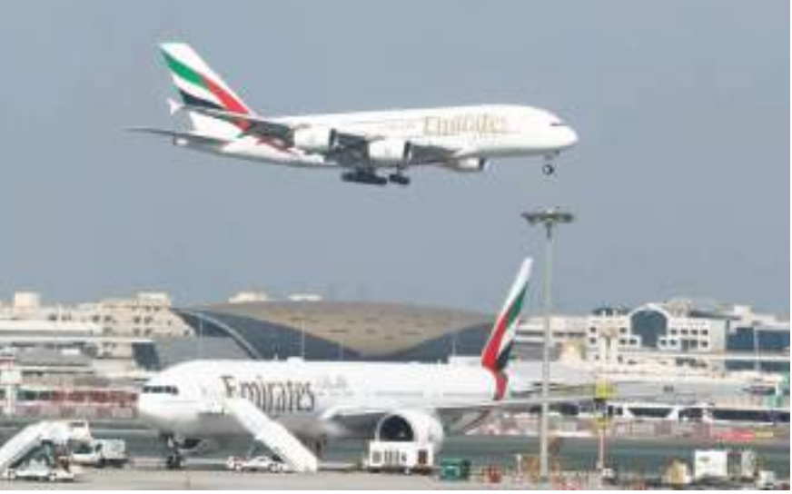
ديجيا - (الوحدة):

أفادت شركة «ويجو» المتخصصة في قطاع خدمات السفر والحجوزات عبر الإنترنت، أن عمليات البحث للحجوزات السفر من الخارج إلى الإمارات سجلت حوالي ١٣٧ ألف عملية خلال أول أسبوعين من نوفمبر الجاري أي زيادة بنسبة ٢٣٪ مقارنة بأخر أسبوعين من أكتوبر ٢٠٢١. وأكدت الإحصاءات الحديثة الصادرة عن الربع الأخير من العام الجاري، أن خدمات السفر والحجوزات عبر الإنترنت، أن الإمارات وصلت إلى حوالى ٨٠٪ خلال أول أسبوعين من شهر نوفمبر الجاري. أما بالنسبة إلى فئات المسافرين، فبينت الإحصاءات أن العائلات التي تتكون من زوجين فقط تصدرت عمليات البحث بنسبة ٢١٦٪ يتبعها العائلات المكونة من أكثر من فرد بنسبة ٢٠٪ يتبعها الأفراد ٢١٪، بحسب الإحصاءات. وبحسب الإحصاءات، أن تلك النسب أتت بدفع استئناف الفعاليات والأنشطة في دبي على رأسهم معرض إكسبو ٢٠٢٠ وانطلاق تريلون دولار. واستغرق الأمر حتى عام ٢٠٢١، ليعود هذا الاتجاه القوي، حيث بلغ المبلغ الذي تم جمعه حتى الآن ١٤٧ مليار دولار، متجاوزاً الرقم القياسي البالغ ١٠٨ مليارات دولار الذي تم تسجيله خلال ذروة طفرة الدوت كوم في عام ١٩٩٩.