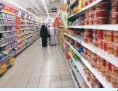
أبوظبي - (الوحدة):

شهد معدل التضخم في الإمارات ارتفاعاً بمعدل ١,١٩٪ خلال شهر سبتمبر ٢٠٢١ مقارنة بنفس الفترة من العام الماضي وفق مؤشرات حديثة للمركز الاتحادي للتنافسية والإحصاء ليحقق الرقم العام لأسعار المستهلك ١٠٧,٢ نقطة مقابل ١٠٥,٥ نقطة بنفس الشهر ٢٠٢٠. وارتفع نمو معدل التضخم إلى ارتفاع أسعار ٨ مجموعات أساسية لإنفاق المستهلك مقارنة بنفس الفترة من العام الماضي تصدتها الترويج والثقافة بحوالي ١٥,٤٥٪ ثم خدمات النقل بحوالي ١٢,٦٩٪ والتجهيزات المعدنية بحوالي ٢,١٧٪ والتعليم بحوالي ١,١٪ إضافة إلى الأغذية والمشروبات التي شهدت زيادات طفيفة بحوالي ٠,٢٨٪. فيما أسهم تراجع مستويات سلع أخرى في تقليص معدل التضخم العام بمقدّماتها مجموعة السكن والمياه والكهرباء والتي تراجع بحوالي ٣,٠٧٪ والملابس والأحذية بحوالي ١,٠٧٪ وأبانت المؤشرات بأن ترتيب أهم ٥ مجموعات للسلع من حيث أهميتها وتأثيرها في المعدل العام للتضخم يظهر تصدر مجموعة السكن بحوالي ٣٤,١٪ وخدمات النقل بحوالي ١٤,٦٪ الأغذية والمشروبات بحوالي ١٤,٣٪ ثم التعليم بحوالي ٧,٠٪.