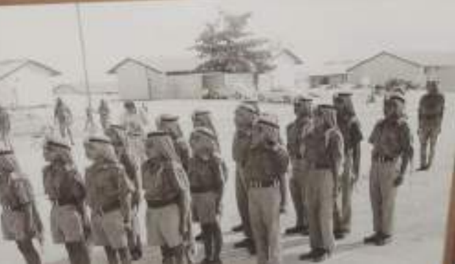
مركز تدريب للقوة في راس الخيمة