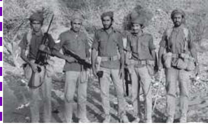
أفراد من جنود القوة