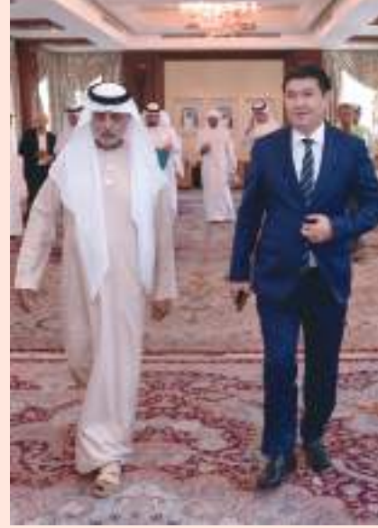
نهيان بن مبارك خلال استقباله سفير كازاخستان أبوظبلي-والم:

استقبل معالي الشيخ خليفة بن مبارك آل نهيان وزير التسامح والتعايش في قصره يوم الخميس سعادة ماديبار مينيليكوف سفير جمهورية كازاخستان لدى الدولة. ورحب معاليه بسعادة سفير كازاخستان مؤكداً أن العلاقات الإماراتية الكازاخستانية المتنامية تجسد رسوخ الشراكة الاستراتيجية بين البلدين والتي تشهد تطوراً مستمراً بدعم ورعاية من قيادتي البلدين الصديقين بما يحقق المصالح المشتركة ويعود بالخير على شعبيهما.