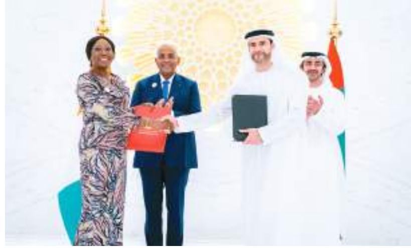
عبدالله بن زايد خلال توقيع الاتفاقيات

مؤكداً على العلاقات المتميزة التي تجمع البلدين والحرص على تعزيزها بما يخدم مصالحهما المشتركة ويعود بالخير على شعبيهما وقبيل الاجتماع .. شهد سمو الشيخ عبدالله بن زايد آل نهيان وزير الخارجية والتعاون الدولي ومعالي باتريك أنتشي رئيس وزراء جمهورية كوت ديفوار مراسم تبادل ٣ اتفاقيات الدخول واتفاقية حماية وتشجيع الاستثمار الضريبي على الدخول واتفاقية حماية و تشجيع الاستثمار واتفاقية خدمات النقل الجوي بين البلدين والتي تم التوقيع عليها بين الجانبين على هامش الزيارة.