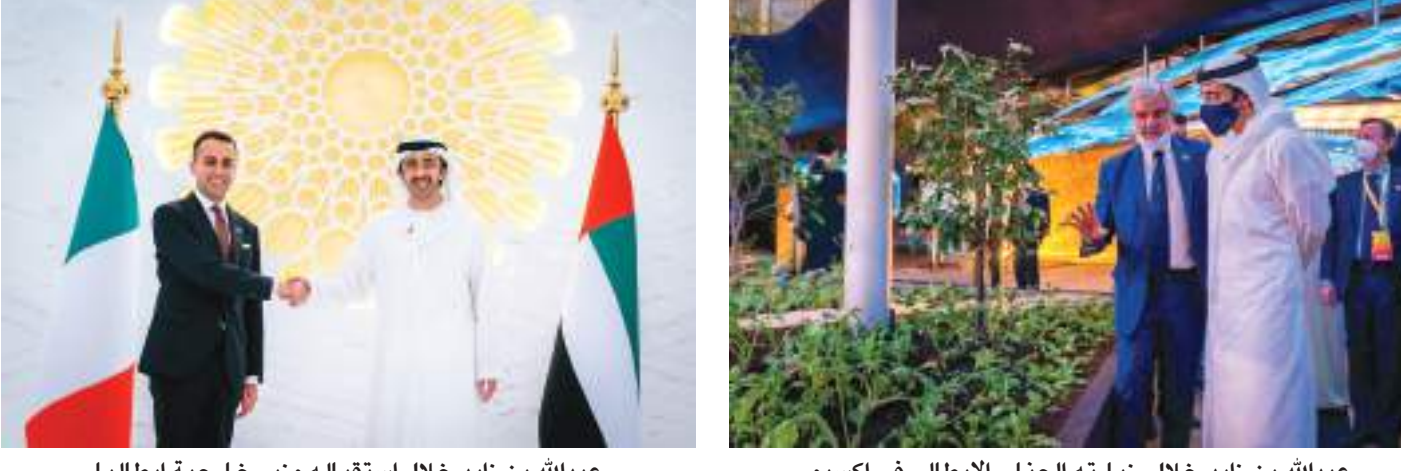
عبدالله بن زايد خلال استقباله وزير خارجية إيطاليا