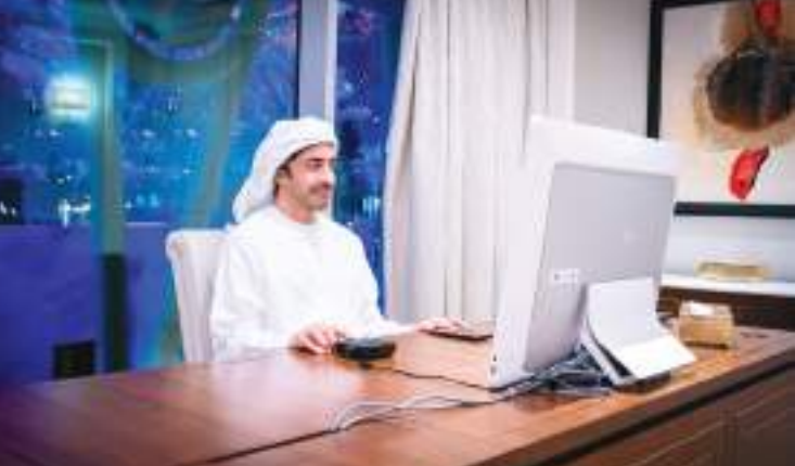
عبدالله بن زايد خلال ترؤسه الاجتماع عن بعد

الرشيده ونجحت في بناء نموذج تنموي استثنائي يزدان بالإنجازات الوطنية الرائدة، مشيراً إلى أننا نتطلع ونحن على مشارف الانطلاق نحو الخمسين المقبلة إلى مواصلة مسيرة الخير والبناء والتنمية لتحقيق الريادة العالمية لوطننا في المجالات كافة.