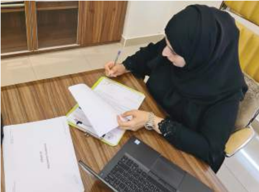
الشارقة - وام:

وتتضمن الاتفاقية تعزيز الخدمات الصحية والطبية والوقائية الذكية المتاحة لأكثر من ١٠٠٠ شركة ناشئة وكوارها ورواد الأعمال والمشاريح الناشئة في «ديتك» كما تدعم الاتفاقية صحة عمليات الشركات الناشئة وكوارها التي تعد إحدى ركائز برنامج «ساندبوكس» Sandbox الست الذي أطلقته الواحة أكتوبر الماضي وسعد الأول من نوعه على مستوى منطقة الشرق الأوسط وشمال أفريقيا لدعم المشاريع الناشئة في تخصصات التكنولوجيا على مدى ١٢ شهراً ومساعدتها في مراحلها التأسيسية على النمو وجمع التمويلات. وبموجب الاتفاقية يحصل كوار الشركات والمشاريح المتواجدة في «ديتك» على خدمات الفحص الطبي والبطاقة الصحية إضافة إلى مزايا رعاية صحية حضرية وأولوية في الخدمات الطبية كما يحظون بفرصة الحصول على استشارات طبية عن بعد في حالات الإصابات.