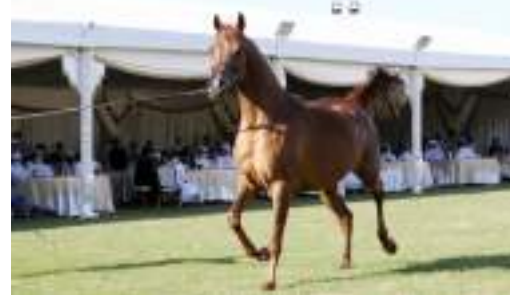
أبو ظبي / وام :

تنظم جمعية الإمارات للخيول العربية في الساعة الثانية من بعد ظهر اليوم مزاد عجمان للخيول العربية الأصيلة، وذلك بمرتب عجمان في منطقة الباهية بإمارة عجمان، بمشاركة 58 رأساً من أنقى السلالات العربية.