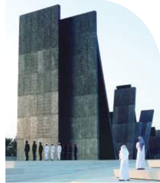
واعة الكرامة - أبوظبي