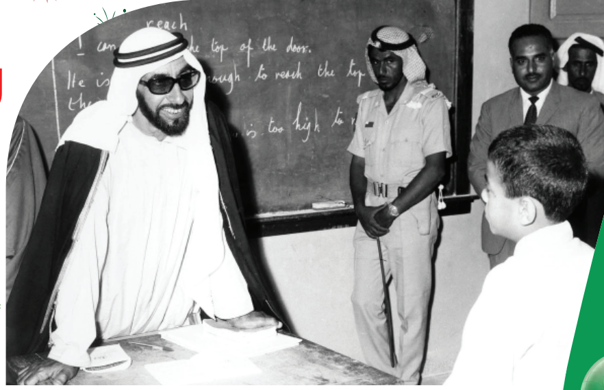
التعليم في فكر زايد .. بوابة العبور إلى المستقبل

«بيت الاتحاد» علم الإمارات العربية المتحدة في «بيت الاتحاد» وهو المكان الذي أعلن فيه قيام الدولة واتحاد الإمارات في 2 ديسمبر 1971