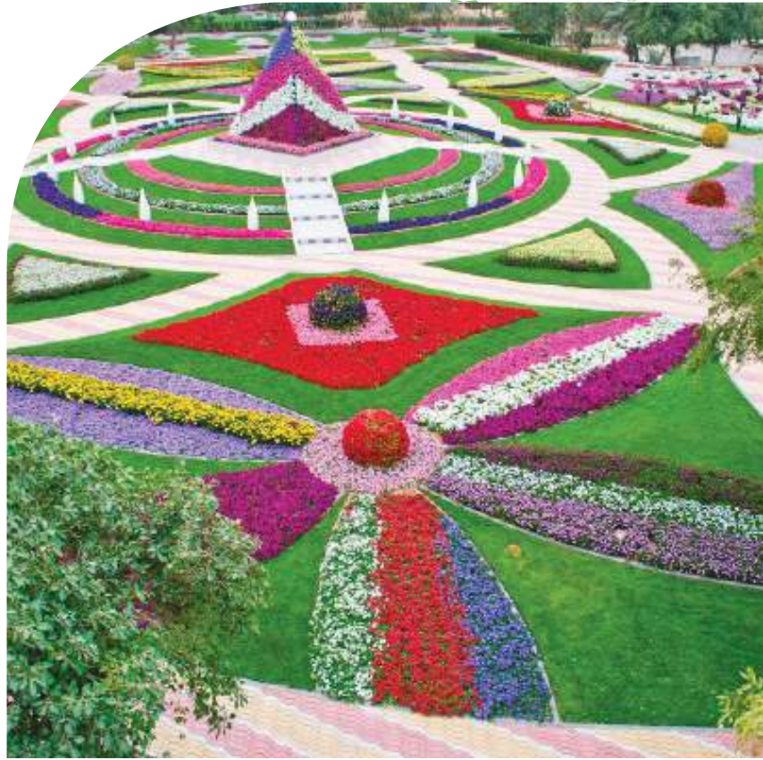
روعة المشهد وجمال الزهور المعلقة في حديقة العين براديس