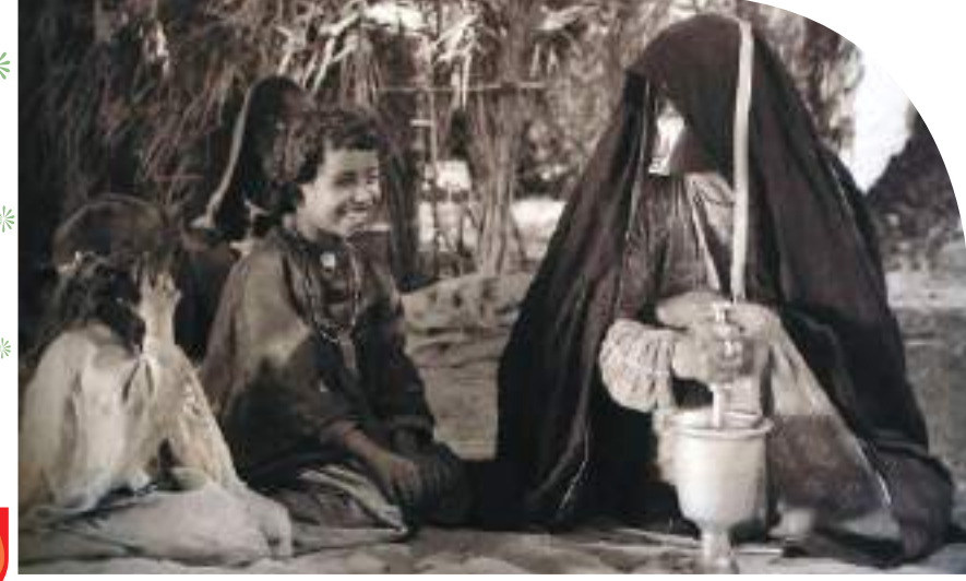
المرأة الإماراتية .. مسيرة نجاح تخطت أصعب المهام