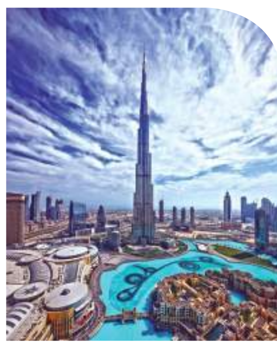
برج خليفة - دبي