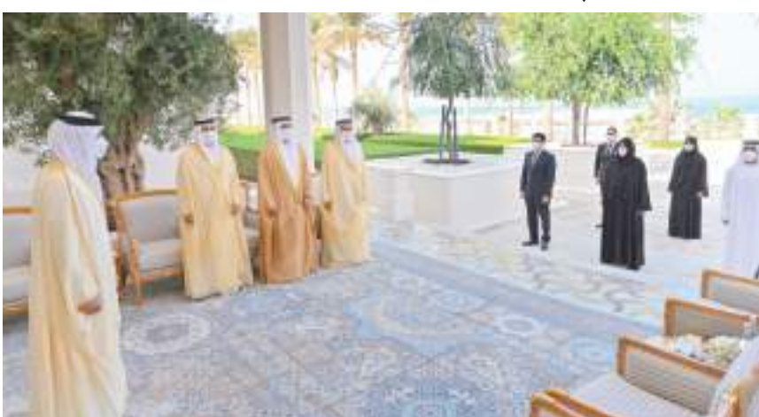
أمام منصور بن زايد القضاة يؤدون اليمين القانونية

أدى ستة قضاة جدد اليمين القانونية، أمام سمو الشيخ منصور بن زايد آل نهيان نائب رئيس مجلس الوزراء وزير الداخلية، في قصر الوطن، بمناسبة بدء موازلة مهامهم كأعضاء جدد في السلطة القضائية في إمارة أبوظبي.