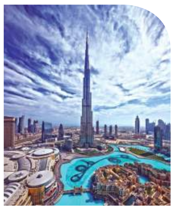
برج خليفة - دبي