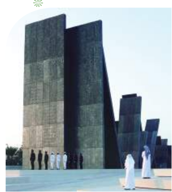
واحة الكرامة - أبوظبي