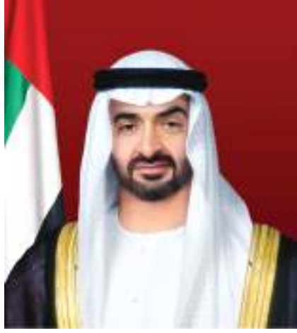
السمو الشيخ محمد بن زايد آل نهيان ضمن برنامج أبوظبي للمسرعات التنموية «غدا ٢١» ومضاعفة موافقات القروض السكنية للمواطنين وذلك تزامنا مع احتفالات باليوم الوطني الـ٥٠.