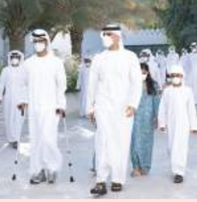
خالد بن محمد بن زايد يزور «مهرجان الحصن» أبوظبي-والم:

وبوسط هذه الموضوعات، كانت المرأة الإماراتية عنصرًا بارزًا حاضرًا لما وصلت إليه من مكانة مرموقة ورأسخة في العديد من المجالات وكذلك السينما الإماراتية التي تسير بخطى ثابتة نحو العالمية.