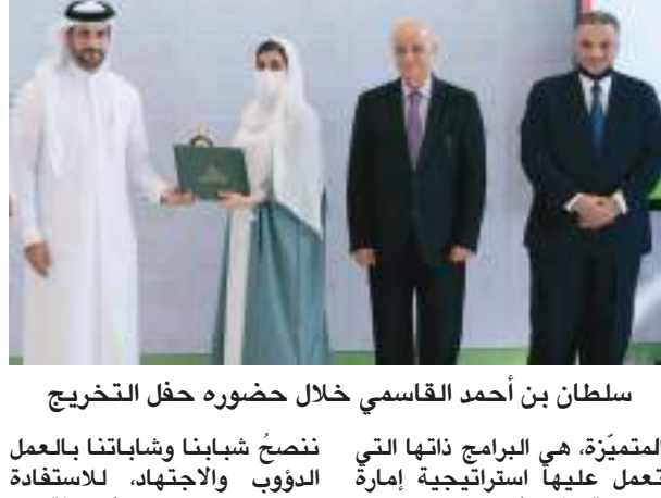
سلطان بن أحمد القاسمي خلال حضوره حفل التخرج

أكد سمو الشيخ سلطان بن أحمد بن سلطان القاسمي نائب حاكم الشارقة رئيس مجلس الشارقة للإعلام، أن الدعم المستمر لجامعة الشارقة، والرؤية الثاقبة من صاحب السمو الشيخ الدكتور سلطان بن محمد القاسمي عضو المجلس الأعلى حاكم الشارقة، هي أساس تطور الجامعة لتكون من بين المؤسسات التعليمية الرائدة من حيث البرامج الأكاديمية لمختلف المراحل والتخصصات بالإضافة إلى جودة خريجها ومرافقها ومبادراتها العلمية المتميزة.