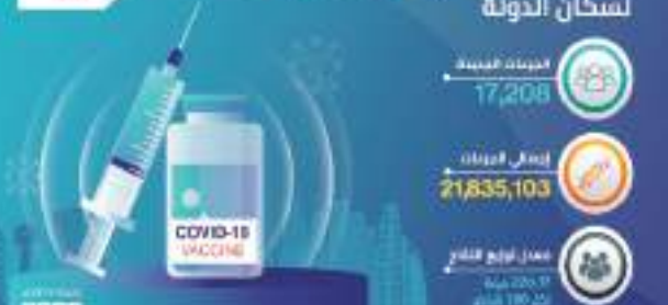
آخر مستحقات تلقي لقاح «كوفيد-19» لسكان الدولة

أعلنت وزارة الصحة ووقاية المجتمع عن تقديم ١٧,٢٠٨ جرعات من لقاح «كوفيد-١٩» خلال الساعات الـ ٢٤ الماضية وبذلك يبلغ مجموع الجرعات التي تم تقديمها حتى اليوم ٢١,٨٣٥,١٠٣