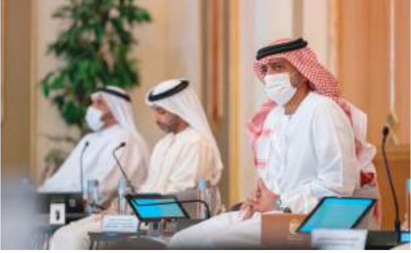
ولي عهد عجمان خلال ترؤسه الجلسة التاسعة للمجلس التنفيذي لهذا العام