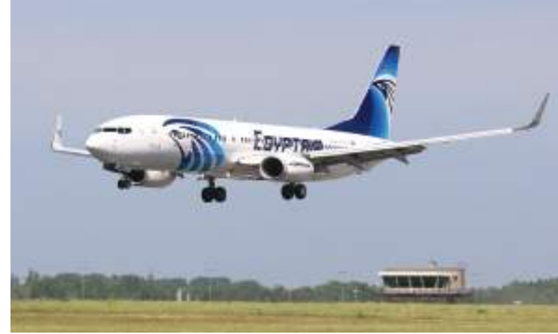
القاهرة - (الوحدة):

استأنفت شركة مصر للطيران يوم الثلاثاء رحلاتها الجوية بين مطاري لندن والأقصر بعد توقف دام عامين بسبب تداعيات وباء كورونا.