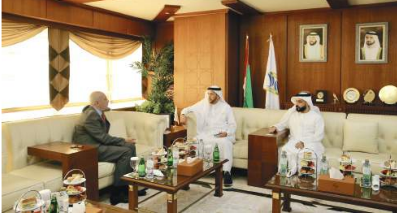
عجمان - وام:

وجهد القيادة الرشيدة لتوفير المقومات اللازمة لبنية تحتية اقتصادية متكاملة لإمارة عجمان، والتي تعزز دورها من تنافسية اقتصاد الإمارة وتدعم ريادته بمختلف المجالات».