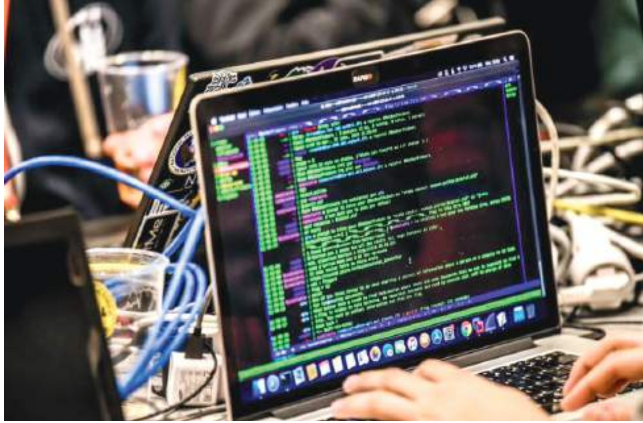
أبوظبي - (وام):

أعلن مصرف الإمارات العربية المتحدة المركزي عن إنشاء مركز عمليات الشبكات والأمن السيبراني لتعزيز حماية وأمن البنية التحتية الرئيسية للنظام المالي في دولة الإمارات ضد الهجمات السيبرانية.