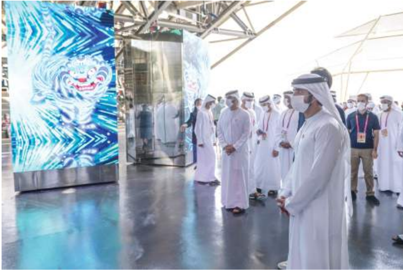
حمدان بن محمد خلال زيارته لأجنحة إسبانيا والمجر وكوريا

يتمتع بها المجتمع الكوري ومفاهيم التكافل والالتزام بالإبداع والابتكار والمرونة الكبيرة في مواجهة التحديات والتغلب عليها بحلول تعتمد على التقنيات الحديثة، وهي القيم التي حرص الكوريون على إبرازها من خلال التصميم الفريد لواجهة الجناح المكونة من مئات المكعبات الدوارة ذات الألوان الزاهية التي ترمز بحركتها التفاعلية إلى الديناميكية العالية التي يتمتع بها المجتمع الكوري.