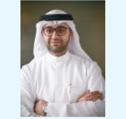
الشارقة - وام:

أعلنت هيئة الشارقة للاستثمار والتطوير «شروق» عن تعاقدتها مع شركة «لوكس كوليكتيف» السنغافورية الرائدة عالمياً في مجال المنشآت الفندقية لإدارة اثنين من أحدث مشاريع الضيافة التي تتولى الهيئة تطويرها في المنطقة الوسطى والساحل الشرقي بإمارة الشارقة وهما «منتجع الجبل لوكس» في خورفكان و«منتجع البردي لوكس» في الذيد.