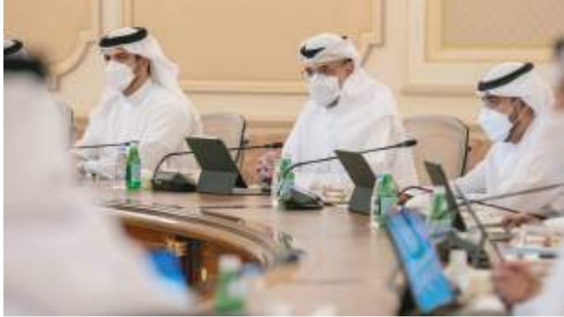
ولي عهد الشارقة خلال ترؤسه الاجتماع