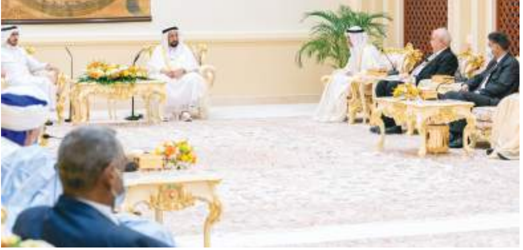
حاكم الشارقة خلال لقائه رؤساء وكبار مسؤولي المجمع اللغوية في الوطن العربي