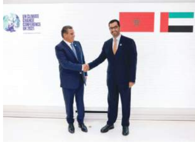
ديجا - (الوحدة):

للتغير المناخي لدولة الإمارات العربية المتحدة: «استقبلنا عزيز أخنوش رئيس الحكومة المغربية في جناح الإمارات في «COP٢٨»، فخورون بالعلاقات التاريخية والاستراتيجية والروابط الأخوية مع المغرب الشقيق، تجمعنا رؤية وأهداف مشتركة، ونعمل على تعزيز فرص التعاون في مجالات الطاقة، والطاقة المتجددة والعمل المناخي».