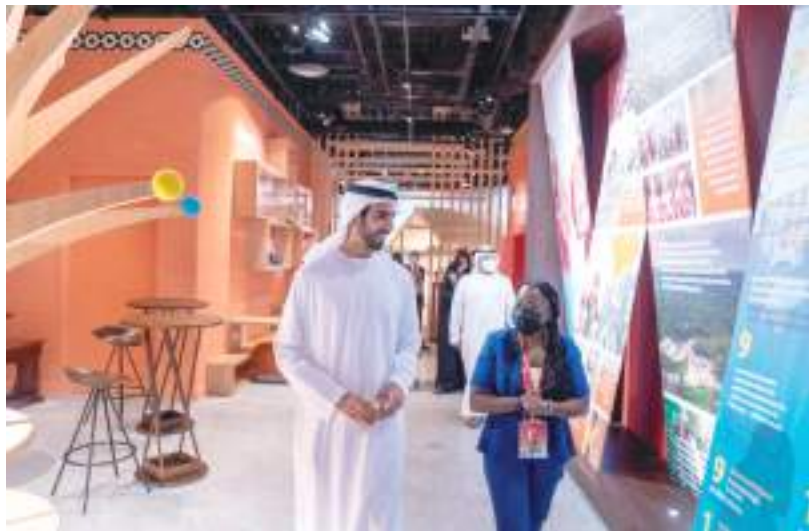
شخبوط بن نهيان آل نهيان خلال زيارته المعرض