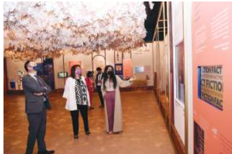
نائبة رئيسة المفوضية الأوروبية للديمقراطية خلال زيارتها المعرض