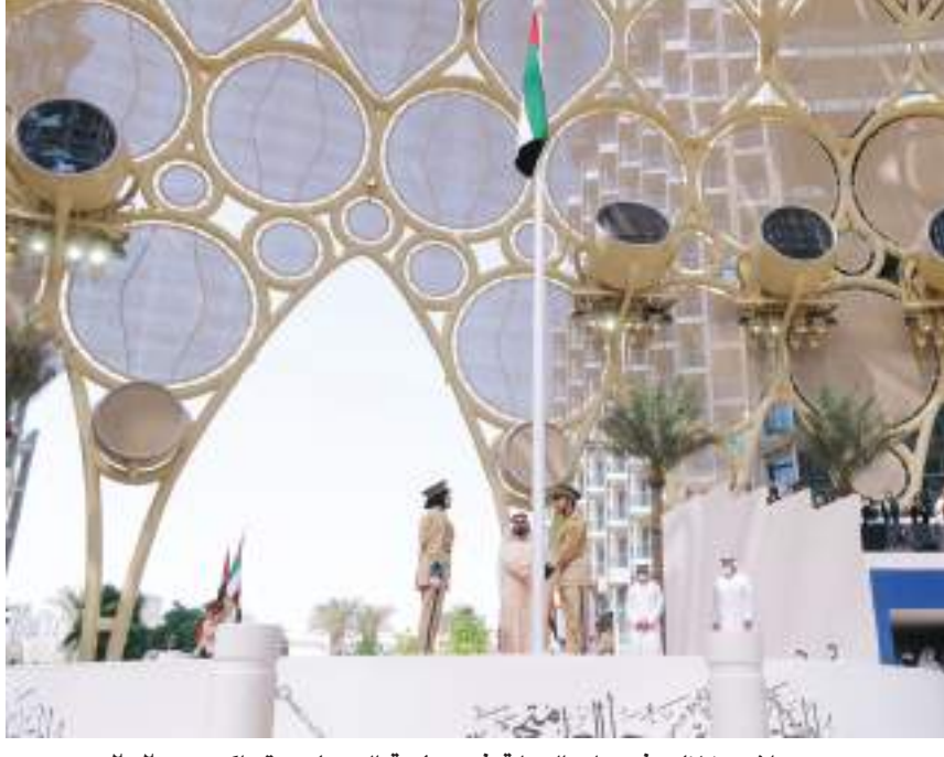
محمد بن راشد خلال رفع علم الدولة في ساحة الوصل بمقر إكسبو ٢٠٢٠ دبي

نُعلي العَلَم والأجيال من بعدنا رمزاً لرفعة الإمارات وعنواناً لهويتها وقوة اتحادها