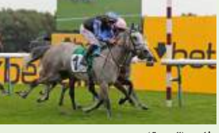
أبوظبي (الودعة) :

يعود مهرجان سباقات سمو الشيخ منصور بن زايد آل نهيان، مجدداً إلى الساحة البلجيكية، حين يستضيف مضمار والوني غداً الخميس، سباق كأس الوثبة ستاليونز، المخصص للخيل العربية الأصيلة، لمسافة 2100 متر، بجائزة تبلغ 5 ألف يورو.