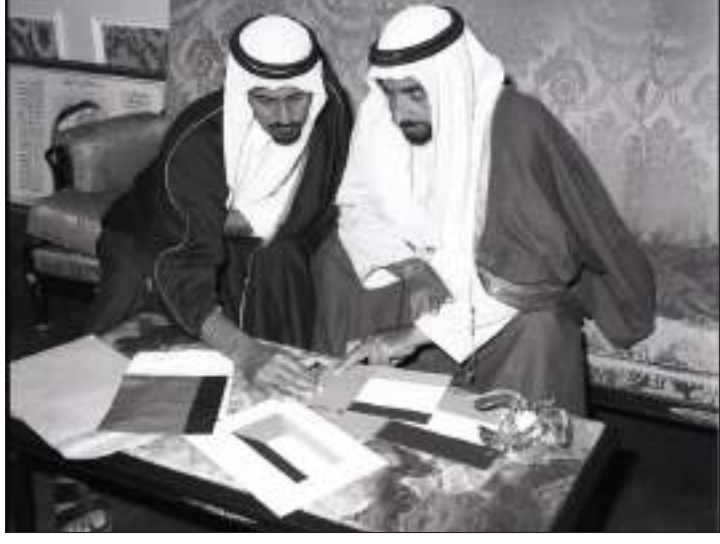
أبوظبي - الوحدة:

جدد صاحب السمو الشيخ محمد بن زايد آل نهيان ولي عهد أبوظبي نائب القائد الأعلى للقوات المسلحة في "يوم العلم" العهد مع الوطن بقيادة صاحب السمو الشيخ خليفة بن زايد آل نهيان، رئيس الدولة، حفظه الله. وقال سموه في تغريدة بصفتها الرسمية في موقع تويتر: قبل خمسين عاماً، توحد شعبنا واجتمعت كلمته تحت راية واحدة، وفي "#يوم_العلم" نجدد العهد مع الوطن بقيادة الشيخ خليفة بأن تبقى رايته مصدر فخرنا واعتزازنا ورمزاً لقوة وحدتنا.