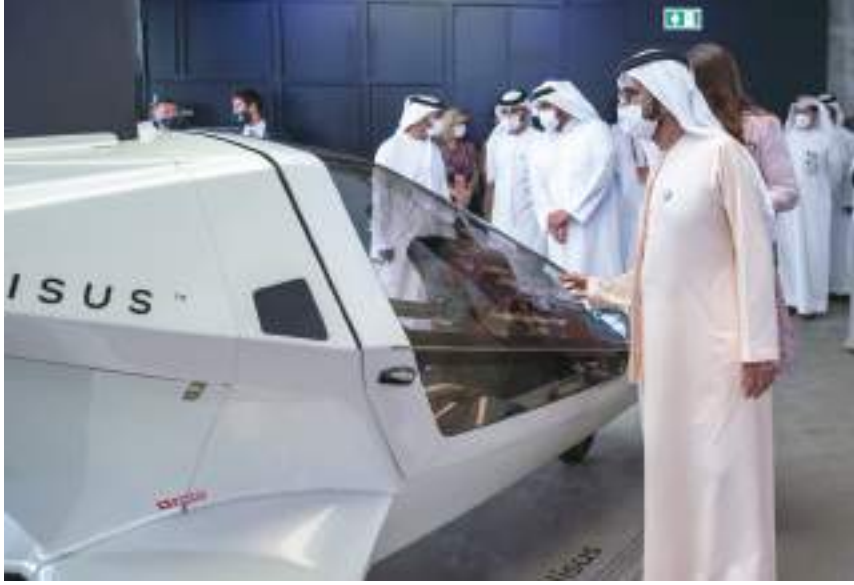
محمد بن راشد خلال زيارته المعرض «وام»

إلى ذلك زار صاحب السمو الشيخ محمد بن راشد آل مكتوم جناح جمهورية إستونيا المقام في منطقة «التنقل»، وهي تعد من أكثر دول العالم تقدماً في مجال التكنولوجيا والحلول الرقمية حيث يعرض الجناح للخدمات الرقمية المتنوعة التي تقدمها إستونيا علاوة على نموذج الحوكمة الرقمي الذي تتبعه، فيما يقدم الجناح تعريفاً بالحلول الذكية التي تبنيها إستونيا في أغلب معاملاتها بما في ذلك تقنيات الدفع غير النقدي والبلوكتشين، حيث تعد إستونيا من الدول الرائدة عالمياً في مجال الاقتصاد الرقمي، وتعتبر مختبراً عالمياً كبيراً للحلول المبتكرة، وتوفر مساحة داعمة لانطلاق الشركات الصغيرة والناشئة.