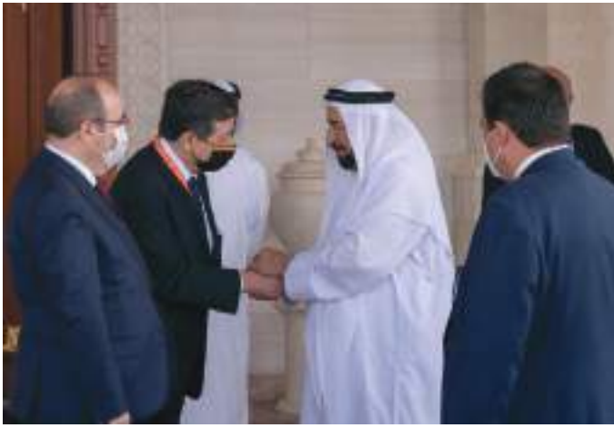
حاكم الشارقة خلال استقباله وزير الثقافة الإسباني

وتناول اللقاء مناقشة جملة من الموضوعات الثقافية ذات الاهتمام المشترك، والتي من شأنها تعزيز