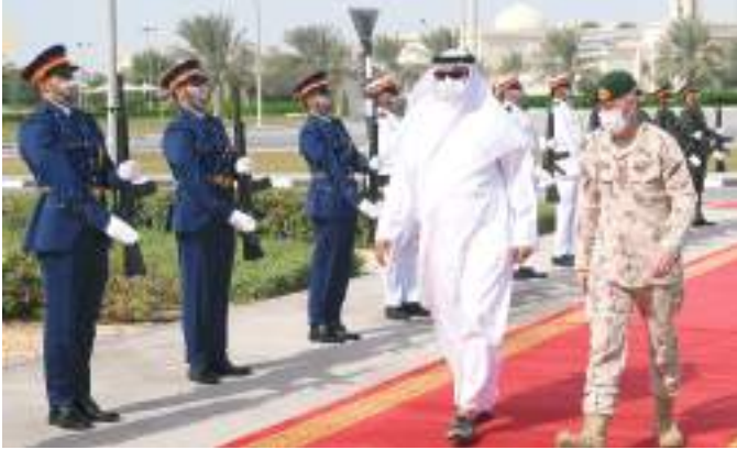
محمد بن أحمد البواردي خلال زيارته قيادة حرس الرئاسة

أكد معالي محمد بن أحمد البواردي وزير الدولة لشؤون الدفاع جنابي سعادته بتمثيل بلاده لدى دولة الإمارات لما تحظى به من مكانة إقليمية ودولية مرموقة بفضل السياسة الحكيمة لصاحب السمو الشيخ خليفة بن زايد آل نهيان رئيس الدولة «حفظه الله» تولى العنصر البشري المواطن أولوية كبيرة وتعول كثيراً عليه وهي مؤمنة أنه ثروة الإمارات الحقيقية والركيزة الأساسية لتسيير عجلة التنمية مشيراً إلى أنها تؤمن بأن الاستثمار الفعلي لا يكون إلا فيه ومن أجله ومن هذا المنطلق عملت على رعايته واحتضانه ووفرت بيئته العمل المناسبة له.