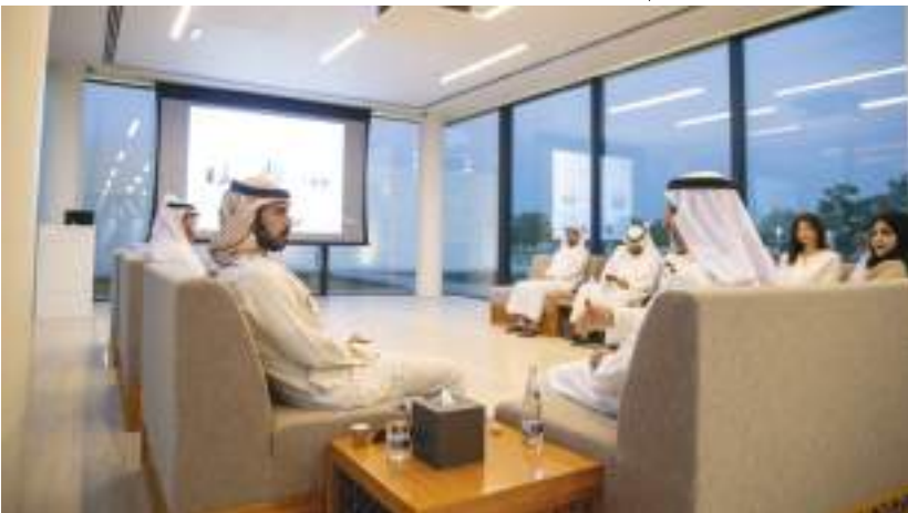
خليفة بن طحنون خلال استقباله الوفد الكويتي