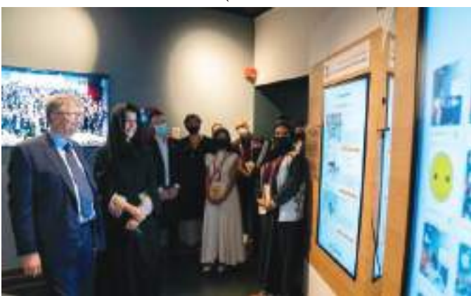
بيل غيتس خلال زيارته إكسبو دبي

استقبلت معالي ريم بنت إبراهيم الهاشمي وزيرة دولة لشؤون التعاون الدولي المدير العام لإكسبو ٢٠٢٠ دبي، في موقع الحدث الدولي بيل غيتس، الملياردير الأميركي والشريك المؤسس لعملاق التكنولوجيا مايكروسوفت وتكتسب زيارة بيل غيتس إلى إكسبو ٢٠٢٠ دبي أهمية خاصة، حيث يتعاون إكسبو ٢٠٢٠ دبي مع مؤسسة بيل وميليندا غيتس من أجل دعم المبتكرين على المستوى المجتمعي ممن يملكون الطموح لتحسين حياة الأفراد الذين يعيشون في مجموعة متنوعة من البيئات الإنسانية المعقدة أو الهشة أو المهمشة. بدأ غيتس زيارته لإكسبو ٢٠٢٠ دبي بقاءً ثنائي مع معالي ريم الهاشمي، قبل أن يزورا جناح إكسبو لايف، الذي يتعاون بشكل مباشر مع مؤسسة بيل وميليندا غيتس، حيث تعرف غيتس على أبرز الابتكارات التي يدعمها البرنامج في أنحاء العالم بهدف تسريع الحلول الإبداعية التي تعمل على تحسين جودة الحياة مع الحفاظ على عالمنا.