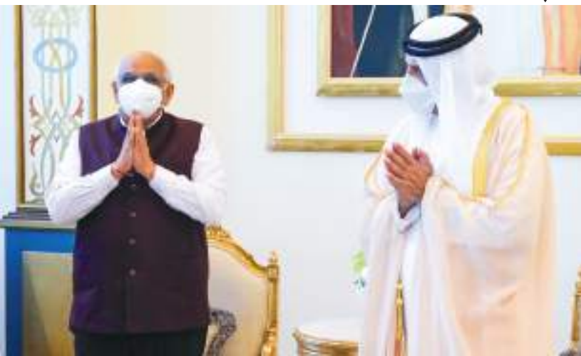
حاكم رأس الخيمة خلال استقباله رئيس وزراء ولاية غوجارات الهندية