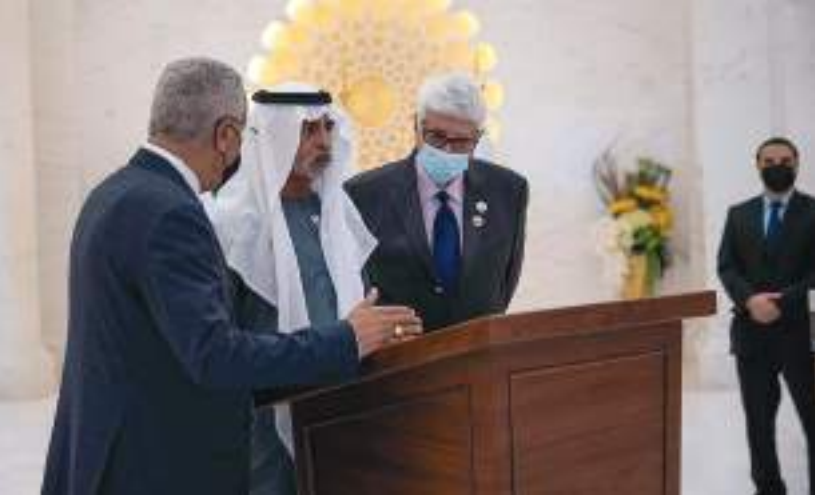
نهيان بن مبارك خلال حفل التدشين