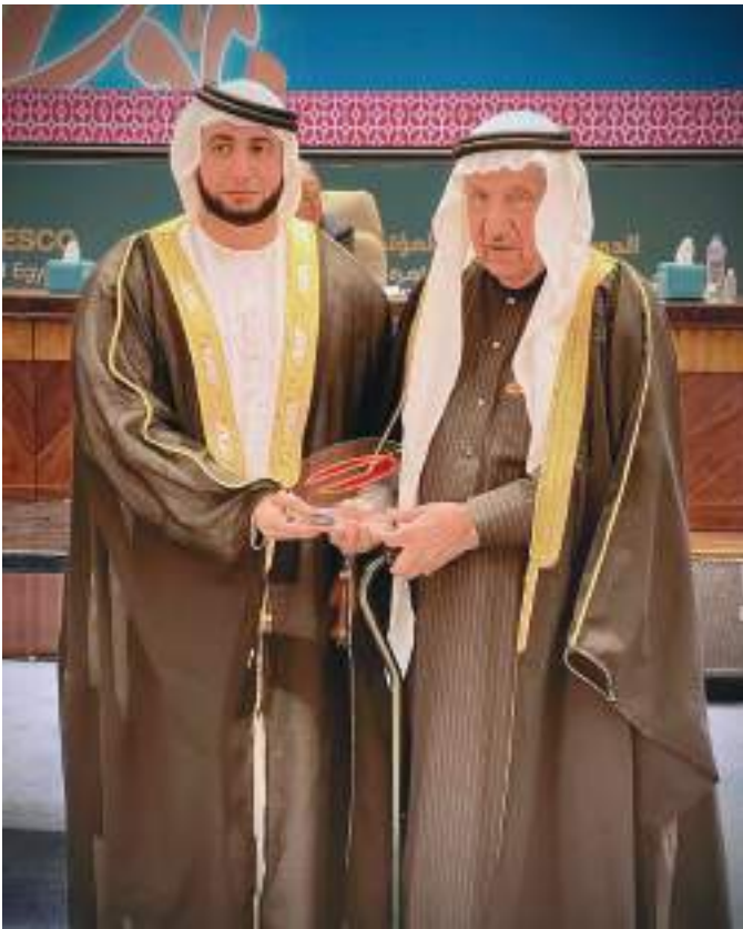
خلال حفل التكريم

وأعرب معالي حسين بن إبراهيم الحمادي، رئيس مجلس أمناء مؤسسة حمدان بن راشد آل مكتوم للاداء التعليمي المتميز عن سعادته بالنتائج التي حققتها الجائزة قياساً بحداثتها والتحديات التي واجهتها إثر تداعيات جائحة كورونا. وقال معالي الحمادي إن مؤسسة حمدان بن راشد آل مكتوم للاداء التعليمي المتميز تظن بكل تقدير حفاوة الاستقبال والاستضافة التي دأبت جمهورية مصر العربية الشقيقة على تقديمها للأشقاء والزائرين كما تشكر منظمة الإيسيسكو على شراكتها واهتمامها ورعايتها ونشرها للجائزة والقيام بكل الإجراءات التي تتطلبها من إعلان وتحكيم وتقييم إلى مزيد من التعاون لخدمة التعليم والارتقاء به إلى آفاق التحديات المستقبلية. وتقدم وزير التربية والتعليم رئيس مجلس أمناء المؤسسة بالتهنئة للفائزين مشدداً على ضرورة دور القطاع الخاص من المؤسسات والأفراد نحو الأسهم في تمكين التعليم في المجتمعات الإسلامية النائية.