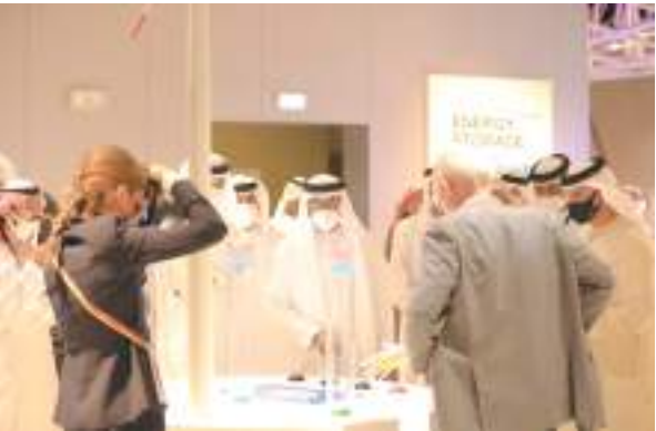
فيصل بن سلطان القاسمي خلال جولته في اكسبو ٢٠٢٠

المملكة العربية السعودية وعدد من الأقسام والجناح الأمريكي والصيني المنوعة.