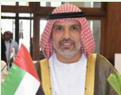
الرياض / وام :

ابن مجرن يحتفظ بعضوية المكتب التنفيذي للجان الأولمبية العربية