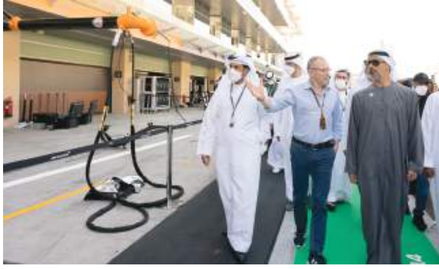
خالد بن محمد بن زايد خلال قيامه بجولة على بعض مرافق حلبة ياس

ويعد مراسم توقيع تمديد الاتفاقية، أجرى سموه جولة على بعض مرافق حلبة مرسى ياس، كان أبرزها مسار صيانة سيارات السباق واطلع على أجنحة المؤسسات الراعية لهذا الحدث العالمي، كما تفقد سموه جاهزية مركبة سباق الفورمولا-١ في طرازها الجديدة لعام ٢٠٢٢، وأهم خصائصها الفنية.