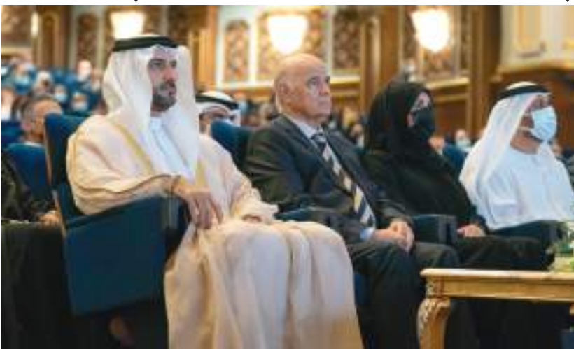
سلطان بن أحمد القاسمي خلال حضوره حفل الافتتاح