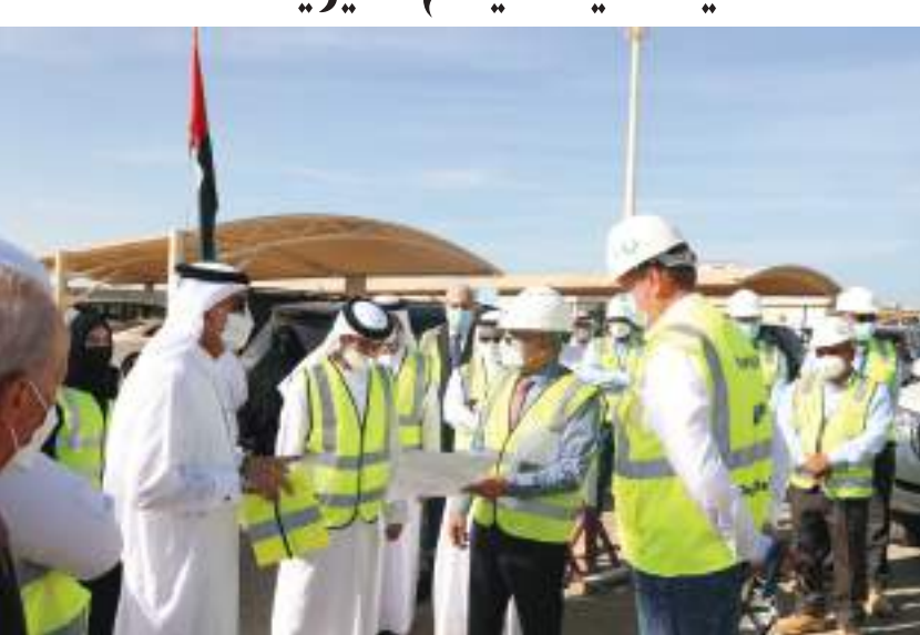
خلال تدشين المرحلة الأولى من المحطة الجديدة لتحلية مياه البحر في أم القيوين

أحد أهم المشروعات التي من شأنها تحقيق مستهدفات الاستراتيجية الوطنية للأمن المائي ٢٠٣٦، موضحاً أنه بتدشين المرحلة الأولى سيتم تشغيل خزانين بسعة ٣٠ مليون جالون لكل منهما.