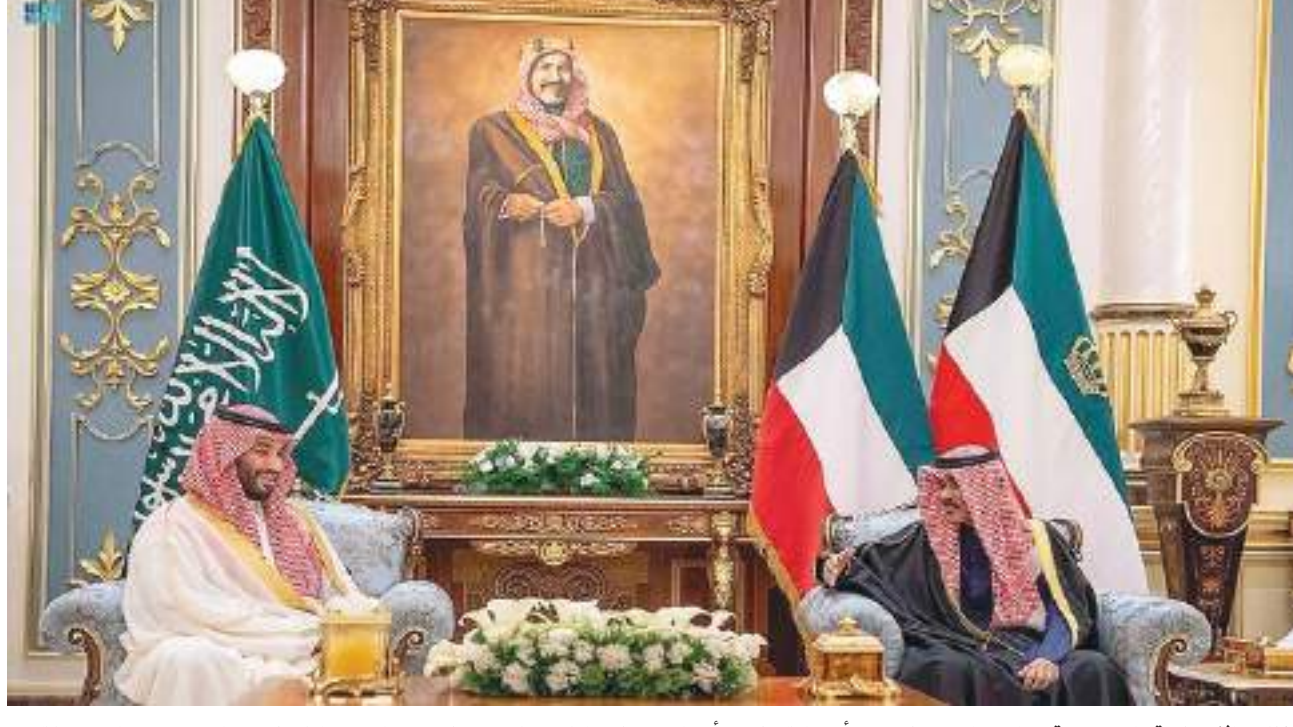
قناة «الإخبارية» السعودية، إن «العمليات أسفرت عن مقتل ١٩٠ عنصراً حوثياً وتدمير ٢٠ آلية عسكرية ووحدات تحكم طائرة بدون طيار تابعة للمليشيا الإرهابية في مأرب».

وأشار التحالف العربي لدعم الشرعية في اليمن، في بيان صحفي إلى تنفيذ ٣٦ عملية استهداف ضد ميليشيات الحوثي الإرهابية في مأرب خلال الـ ٢٤ ساعة الماضية. وقال التحالف، حسب