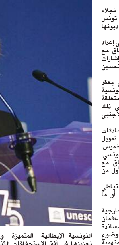
عن الخارجية التونسية، إلى موضوع إعادة تصدير حاويات النفايات إلى إيطاليا، حيث أكد السفير سعي السلطات المركزية ببلادها وخاصة وزير الشؤون الخارجية والداخلية إلى استكمال مسألة استرجاع النفايات وتأكيد الحكومة الإيطالية لشرعية الطلب التونسي.

وبحث الجرندى، خلال لقائه سفير إيطاليا بتونس لورينزو فنارا، العلاقات التونسية-الإيطالية المتميزة وسبل تعزيزها في أفق الاستحقاقات الثنائية المقبلة وعلى رأسها الزيارة المرتقبة لوزير الشؤون الخارجية الإيطالي لويجي دي مايو إلى تونس يوم ٢٨ ديسمبر الجاري. وتطرق المسنونان، حسبما ذكر بيان صادر