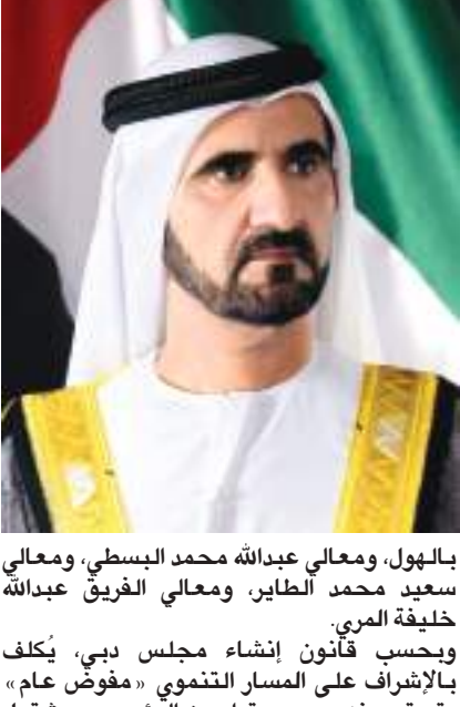
بالهول، ومعالي عبدالله محمد البسطي، ومعالي سعيد محمد الطاير، ومعالي الفريق عبدالله خليفة المري.

ومعالي عبدالله محمد البسطي، ومعالي سعيد محمد الطاير، ومعالي الفريق عبدالله خليفة المري. وبحسب قانون إنشاء مجلس دبي، يُكلف بالإشراف على المسار التنموي «مفوض عام» يتم تعيينه بموجب قرار من الرئيس.. ويشتمل المسار التنموي على عدد من الجهات التي يتم تحديدها بموجب قرار التعيين.. ويقوم المفوض العام بالإشراف على أعمال المسار التنموي وتسيير شؤونه، والعمل على ضمان تحقيق أفضل المستويات العالمية. ويقوم نواب الرئيس بمتابعة الأداء العام للمسار التنموي وما به من مشاريع وخطط تحولية، فضلا عن الإشراف على المفوض العام ومدراء المشاريع وتقييم أدائهم. ونص قانون إنشاء مجلس دبي على أن يتولى المكتب التنفيذي القيام بمهام الأمانة العامة وتقديم الدعم اللازم للمجلس ومعاونته في أداء مهامه وذلك بما يشمل الدعم الإداري والفني وإعداد القرارات والتوصيات وإجراء البحوث. ويتولى رئيس المكتب التنفيذي أو من يفوضه القيام بمهام الأمين العام لمجلس دبي على أن يقع ضمن اختصاصاته الإشراف العام على قيام الأمانة العامة بإنجاز المهام المنوطة بها في سبيل دعم المجلس وتمكينه من تحقيق أهداف.