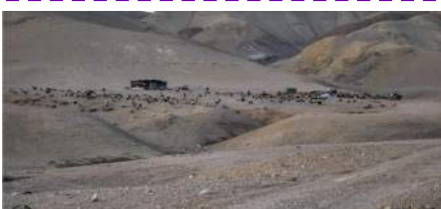
بادية الشام في الأردن

باح العزا يا عقاب صبري غدا وين لو درت عندي ذرة ما تجدها صبري دنفته بالزبارة ببيرين الله يكافي شر منهو جدها ياسين يام عقاب ياسين ياسين يا شبه عنز الريم ترعا وحدها بنت الرجال وخالط عقلها زين روايح الريحان ريحة جسدها جتني عطا ما سقت فيها تلامي شيمة فهود كل من جا حمدها ويقول الرواة أن هذه القصيدة أيضاً نظمها نمر بعد وفاة ((وضحا)) بعد أن أشاع عنه ابن عمه حمود أنه أصابه جنون طمعا بالزعامة التي تخلى عنها نمر تلقاء نفسه لابن عمه حمود بعد وفاة وضحا يا حمود قل لحمود وشجاه مني علم تحاكي به وعنهم تحوني عند العرب يا حمود أضحك بسني وبأرض الخلا يا حمود أبيع كنوني