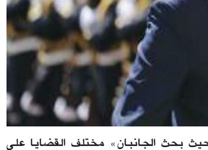
وأكد رئيس مجلس الوزراء اللبناني نجيب ميقاتي، يوم السبت، أن الانتخابات النيابية ستجري في موعدها، مشيراً إلى أن لبنان سيتجاوز الأزمة التي يمر بها بتضامن جميع أبنائه. وحسب بيان صادر عن الموقع الرسمي لميقاتي جاء ذلك خلال لقائه مع مفتي الجمهورية اللبنانية الشيخ عبد الطيف دريان

ومن المقرر أن تجري الانتخابات النيابية في الربيع المقبل وفق القانون النسبي والصوت التفضيلي، ولم يحسم بعد موعدها بانتظار أن يبت المجلس الدستوري بالطعن المقدم من