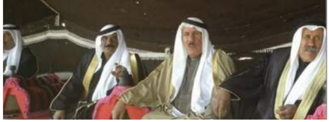
جماعة من أهل البادية

قمت اتوجد عند ربع حشاما جوني على فرقا خليلي يعزون قالوا تزوج وأنس لامة بلاما تري العذارى عن بغضهم يسلون قلت انا اخاف من غاديات الذماما اللي على ضيم الدهر مايساعدون تزعل عيالي بالنهر والكلاما وانا تجرعني من المر بصحون والله لولا هالصغار ألتامنا واخاف عليهم من السكه يضيعون لاقول كل البيض عقبه حراما واصبر كما يصبر على الحبس مسجون عليه مني كل يوم سلاما عدّة حجيج البيت واللي يطوفون واعداد مانبت النفل والخزاما على النبي اللي حضرتوا تصلون. وفي قصيدة أخرى قال عن زوجته وضحى راثيا: