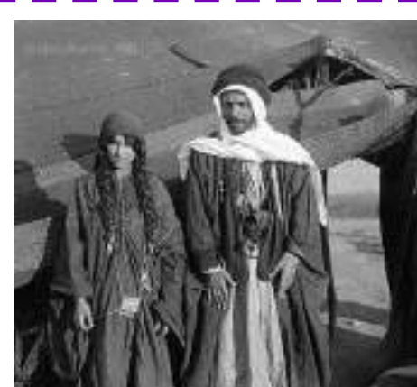
رجل وامرأة من قبيلة العدوان

غاد نكرها والقوانين يرمون تسمع لها بين الجرايد حطاما ومن نوحها تدعي المولىف يبكون مرحوم ياللي مات شهر الصياما صافي الجبين بليله العيد مدفون حطوا عليه من الخرق ثوب خاما وقامو عليه من التراب يهلون مرحوم ياللي ماشى باللاما جيران بيته راح مامنه يشكون اخذت انا وياه عشرة اعواما مامتلهن في كيفة مالها لون والله كنه يا عرب صرف عاما وياحيلة الله شغل الأيام وشلون واكبر همومي من بزور يتاما لاحيتهم قدام وجهي يبكون وان قلت لاتبكون قالوا علاما نبيكي ويبيكي مثلنا كل محزون قلت السبب تبكون قالوا يتاما قلت اليتيم انا وانتم تسجون مع البزور وكل جرح بلاما الا جروح بخاطري مايطيبون