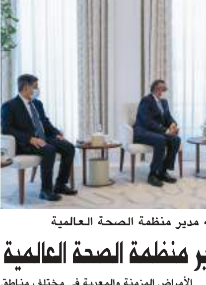
محمد بن زايد خلال استقباله مدير منظمة الصحة العالمية

التنموية المستقبلية لإمارة دبي وتطويرها على النحو الذي يضمن تنافسيها العالمية، ويعزز من ريادتها وجاذبيتها وذلك من خلال إطلاق المشاريع الكبرى النوعية والمبادرات التحولية وغير الاعتيادية للإمارة والتي يعتمدها المجلس، بهدف إحداث قفزات تنموية تسهم في توفير أفضل حياة لمواطنيها وساكنيها وزائريها. ويتراس مجلس دبي صاحب السمو الشيخ محمد بن راشد آل مكتوم، نائب رئيس الدولة