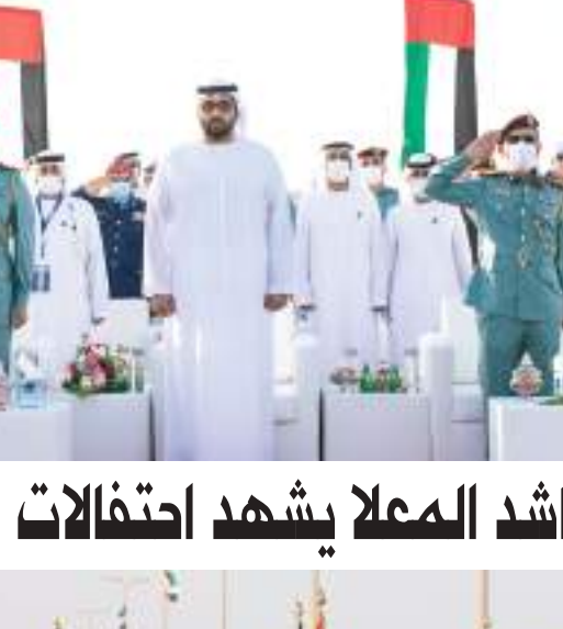
محمد بن زايد خلال استقباله مدير منظمة الصحة العالمية