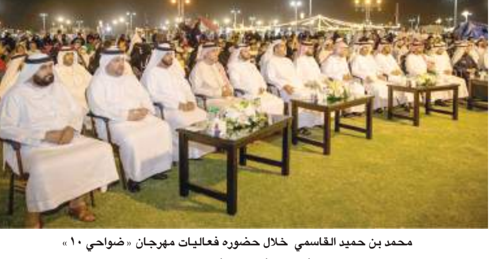
محمد بن حميد القاسمي خلال حضوره فعاليات مهرجان «ضواحي ١٠»

افتتح الشيخ محمد بن حميد القاسمي رئيس دائرة الاحصاء والتنمية المجتمعية في الشارقة فعاليات «مهرجان ضواحي ١٠» التي تنظمها دائرة الضواحي وشؤون القرى في حديقة القرائن ٥ بمدينة الشارقة والتي تستمر لمدة ٣ أسابيع بمشاركة ٣٧ جهة داعمة وراعية. حضر الافتتاح الشيخ ماجد بن سلطان القاسمي مدير دائرة شؤون الضواحي والقرى وسعادة خميس بن سالم السويدي رئيس دائرة الضواحي وشؤون القرى إلى جانب عدد من كبار المسؤولين ورؤساء ومدراء الدوائر الحكومية في إمارة الشارقة وأعيان البلاد والمدعوين وأهالي الأحياء السكنية. وقال سعادة خميس بن سالم السويدي : يتوج افتتاحنا للنسخة العاشرة من مهرجان «ضواحي» مرحلة قطعها الدائرة لترسخ رؤية ثقافية خطها صاحب السمو الشيخ الدكتور سلطان بن محمد القاسمي عضو المجلس الأعلى حاكم الشارقة من أجل الأسرة وترابطها وتماسكها وفعاليتها ينظرها الأهالي لتكون