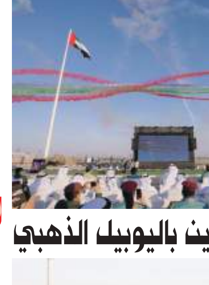
محمد بن زايد خلال استقباله مدير منظمة الصحة العالمية