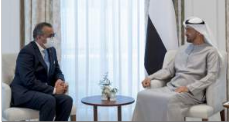
أبوظبي - وام:

استقبل صاحب السمو الشيخ محمد بن زايد آل نهيان ولي عهد أبو ظبي نائب القائد الأعلى للقوات المسلحة يوم السبت الدكتور تيدروس أدهانوم غيبريسوس مدير عام منظمة الصحة العالمية. وبحث سموه والدكتور تيدروس أدهانوم