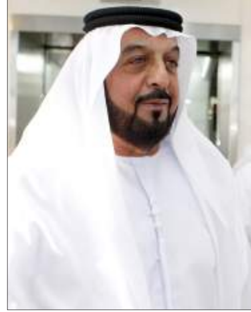
أبوظبي - وام:

بعث صاحب السمو الشيخ خليفة بن زايد آل نهيان رئيس الدولة « حفظه الله » برقية تعزية إلى أخيه صاحب السمو الشيخ نواف الأحمد الجابر الصباح أمير دولة الكويت الشقيقة في وفاة الشيخ دعيج خليفة عبدالله الخليفة الصباح.