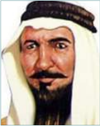
الفارس نمر بن عدوان

بقلم / أنور بنت حمدان الزعابجا - كاتب وشاعر إماراتي