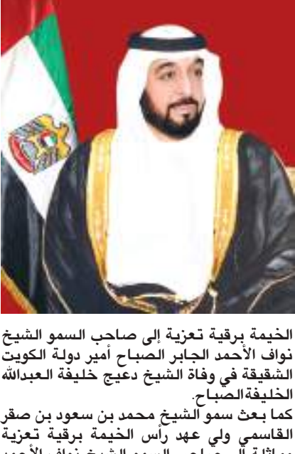
الخيمة برفقة تعزية إلى صاحب السمو الشيخ نواف الأحمد الجابر الصباح أمير دولة الكويت الشقيقة في وفاة الشيخ دعيح خليفة العبدالله الخليفة الصباح.

الأحمد الجابر الصباح أمير دولة الكويت الشقيقة في وفاة الشيخ دعيح خليفة العبدالله الخليفة الصباح. كما بعث سمو الشيخ محمد بن حمد بن محمد الشرقي عضو المجلس الأعلى حاكم الفجيرة برفقة تعزية إلى صاحب السمو الشيخ نواف الأحمد الجابر الصباح أمير دولة الكويت الشقيقة في وفاة الشيخ دعيح خليفة العبدالله الخليفة الصباح. كما بعث سمو الشيخ محمد بن حمد بن محمد الشرقي ولي عهد الفجيرة برفقة تعزية مماثلة إلى صاحب السمو الشيخ نواف الأحمد الجابر الصباح. كما بعث صاحب السمو الشيخ سعود بن صقر القاسمي عضو المجلس الأعلى حاكم رأس