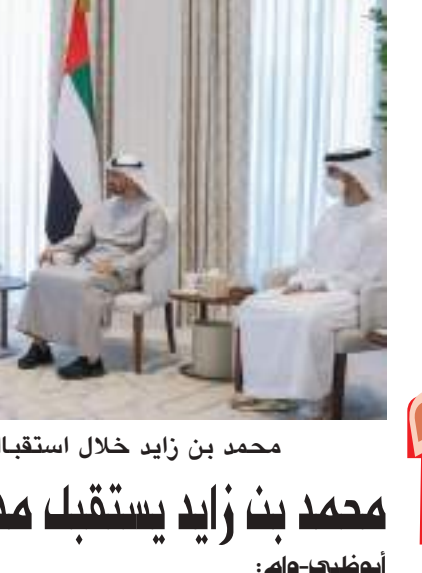
محمد بن زايد خلال استقباله مدير منظمة الصحة العالمية