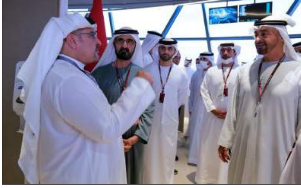
أبو ظبي- وام:

شهد صاحب السمو الشيخ محمد بن راشد آل مكتوم نائب رئيس الدولة رئيس مجلس الوزراء حاكم دبي "رعاه الله" وصاحب السمو الشيخ محمد بن زايد آل نهيان ولي عهد أبوظبي نائب القائد الأعلى للقوات