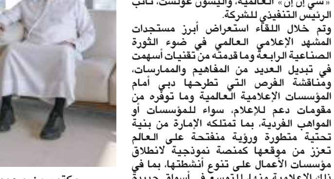
مكتوم بن محمد خلال استقباله رئيس شبكة «سي إن إن» العالمية