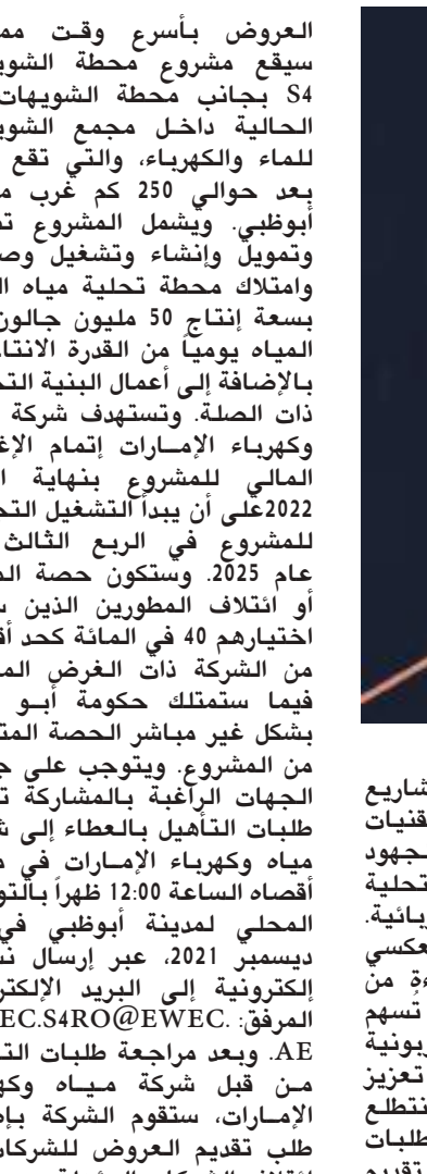
أعلنت شركة مياه وكهرباء الإمارات عن إصدار تقديم طلبات التأهيل لتطوير مشروع الشويحات S4 لتحلية المياه بتقنية التناضح العكسي في أبوظبي.