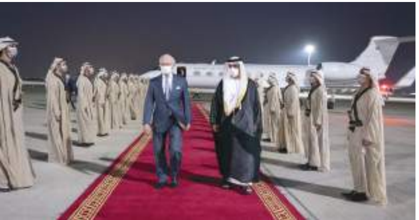
ملك السويد يصل إلى البلاد وحامد بن زايد في مقدمة مستقبليه