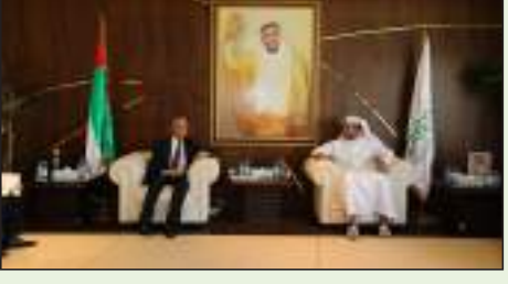
أبوظبي - الوحدة:

استقبل الدكتور ابراهيم الزعابي مدير ادارة البرامج والمشاريع و عبدالله سالم العامري مدير مكتب المبر العام بمقر مؤسسة زايد بن سلطان ال نهيان للأعمال الخيرية والانسانية معالي محمد يوسف إمامزاده وزير التعليم لجمهورية طاجيكستان وجرى البحث في مجالات التعاون وخاصة المساعدات الإنسانية التي تقدمها المؤسسة في مجال التعليم لتحقيق الاهداف الرئيسية للمؤسسة.