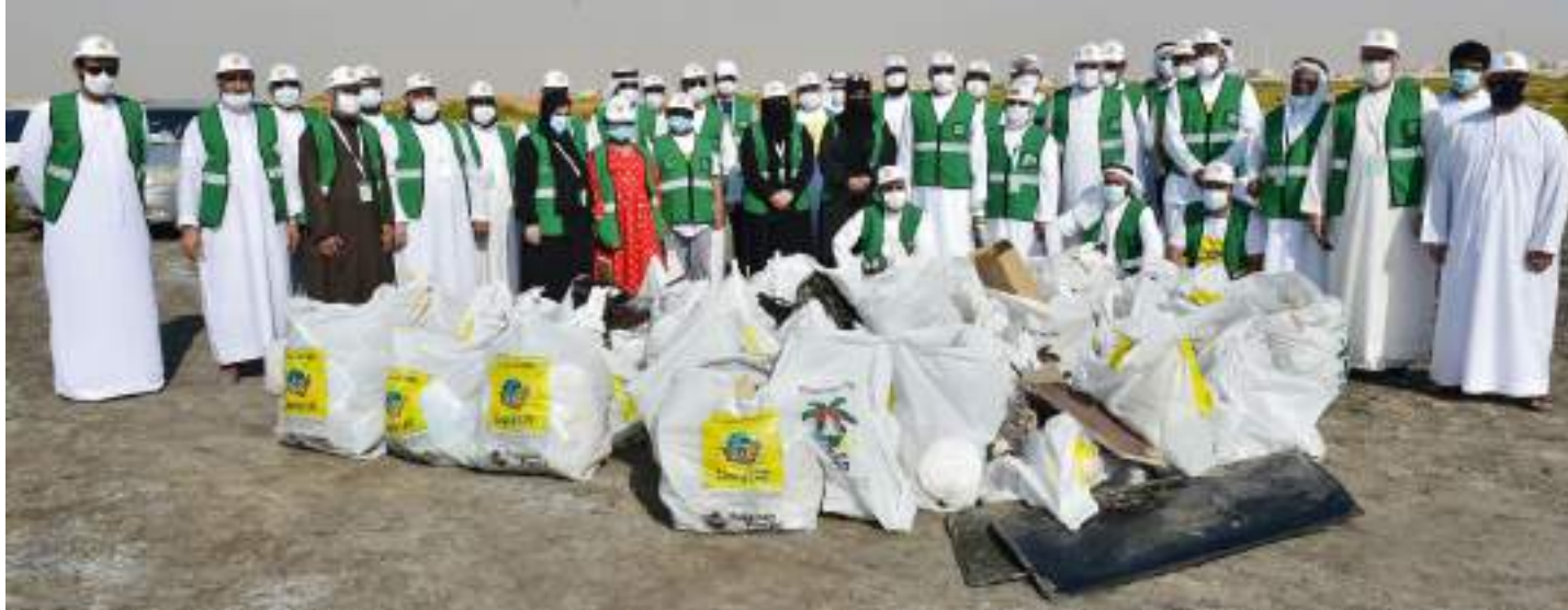
أبوظبي - الوحدة:

شاركت الهيئة العامة للشؤون الإسلامية والأوقاف والمسؤولون فيها والمتطوعون من الموظفين والموظفات في حملة "نظفوا الإمارات" التي نظمتها مجموعة عمل الإمارات للبيئة، حيث تقدمهم رئيس ومدير عام الهيئة في هذه المبادرة الوطنية الخلاقة التي تنم عن الحب المثالي للوطن.