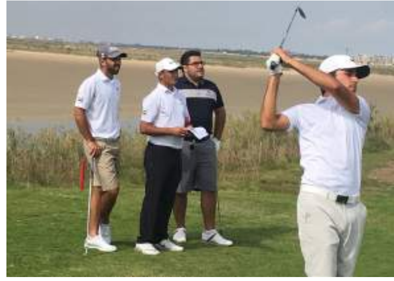
دبجيا - الوحدة:

وشدد أبو الخير على أهمية هذا الحدث الرياضي والذي يقام على هامشه