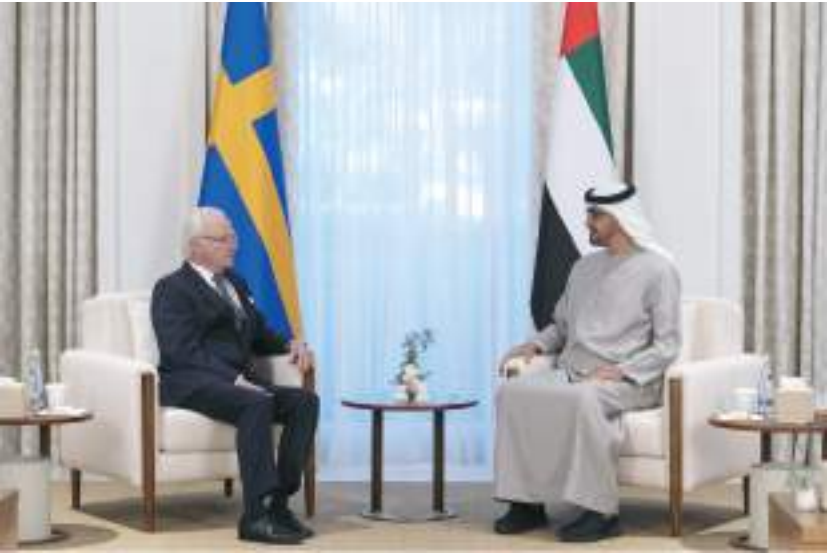
محمد بن زايد خلال استقباله ملك السويد