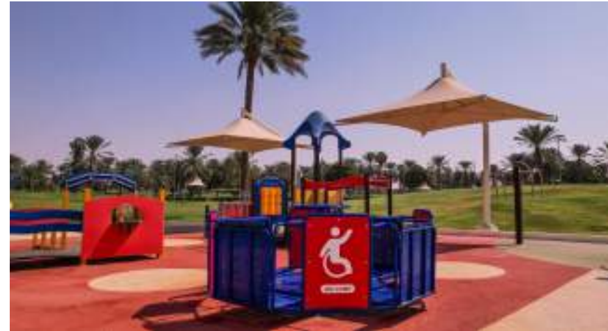
الظفرة - الوحدة:

والسلامة. كما تم انشاء ممر حركة خاص لأصحاب الهمم وكبار المواطنين على شاطئ المرفأ انطلاقاً من المسؤولية المجتمعية للبلدية تجاه هذه الفئة الغالية على قلوبنا لتمكنهم من الوصول إلى أقرب نقطة للشاطئ بكل سهولة ويسر، بالإضافة إلى توفير مواقف ومداخل خاصة لهم بمباني البلدية، وتوفير خدمة توصيل المواد الغذائية لإسعادهم.