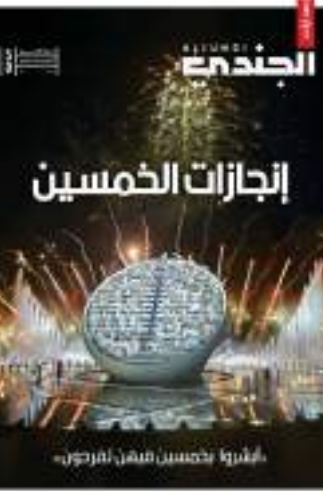
أبوظبي - وام:

أصدرت مجلة "الجندي" التابعة لوزارة الدفاع ملحقاً خاصاً بمناسبة اليوبيل الذهبي للدولة، وذلك في إطار مواكبتها للمناسبات الوطنية الخالدة في تاريخ الدولة، وحرصها على المشاركة في الاحتفاء بعيد الاتحاد الخمسين وتخليد هذه الذكرى المجيدة.