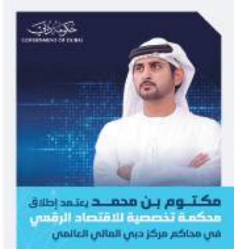
مكتوم بن محمد بتعمد إطلاق محكمة تخصصية للاقتصاد الرقمي

تستهدف محكمة الاقتصاد الرقمي تبسيط تسوية النزاعات المدنية والتجارية المعقدة للاقتصاد الرقمي وتختص بالنزاعات الوطنية والدولية المعقدة المتعلقة بالتقنيات والبيانات والعمليات المتعلقة بالفضاء الإلكتروني والذكاء الاصطناعي، والخدمات السحابية، والتزامات المتابعة بالبرقيات الصوتية غير الموقّعة، وتدابير الحماية ثلاثية الأبعاد، والروبوتات. يتم تقديم الخدمات فيها خلال الربع الأول من 2022 وتوظيف نخبة من خبراء القضاء الدوليين لتسهيل والإعتراف على البيئة التقنية الرقمية والفرات القديمة المتطورة