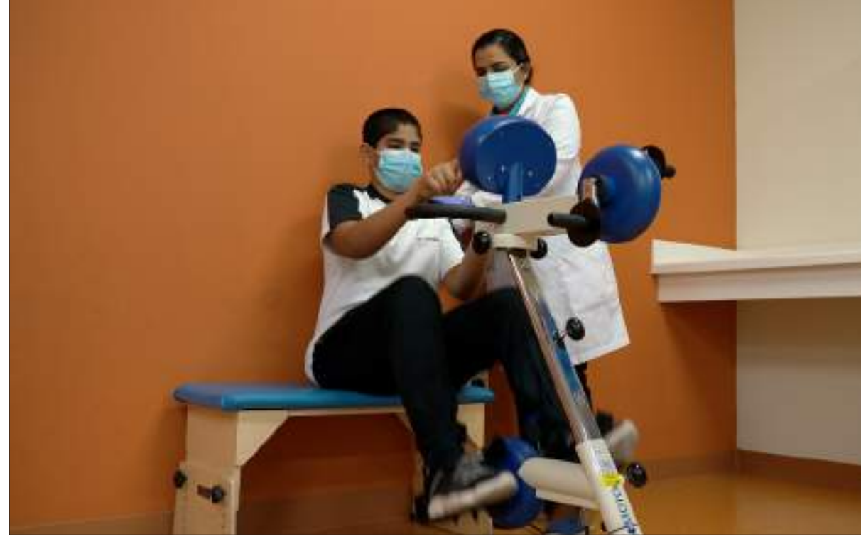
أبوظبي - الوحدة:

أكدت شركة أبوظبي للخدمات الصحية "صحة" أهمية الإنتباه لصحة الأطفال، وحثهم على اتباع نمط حياة صحي، والمحافظة على الوزن المثالي لهم، وذلك بدءً من الإنتباه على طرق تناول الطعام وأنواعه، وصولاً إلى المداومة على بعض العادات الصحية اليومية.