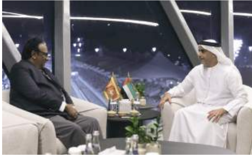
سيف بن زايد خلال لقائه وزير الأمن العام السريلاكي