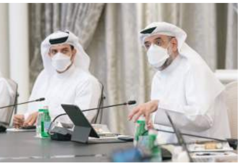
ولي عهد الشارقة خلال ترؤسه إجتماع المجلس التنفيذي