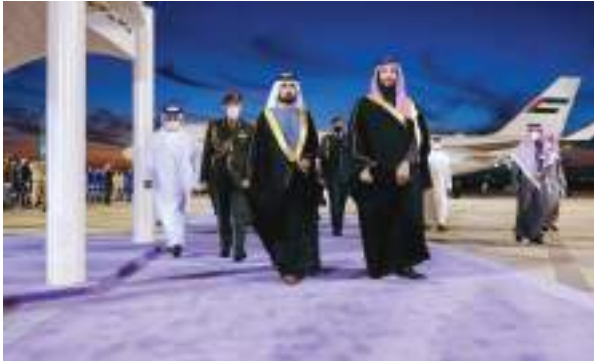
محمد بن راشد يصل الرياض

وعد من الأمراء والوزراء وكبار المسؤولين السعوديين. ويرافق صاحب السمو إلى القمة وفد رفيع يضم: سمو الشيخ