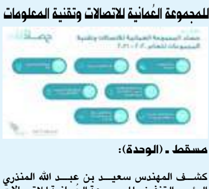
مسقط - (الوحدة):

زخم الحركة الاقتصادية وتنوعها. وإلى جانب المساهمة المباشرة لمداخل القطاع السياحي في تنويع الاقتصاد الوطني، يسهم نمو السياحة في الدولة في ازدهار قطاعات رديفة مثل قطاعات خدمات الطعام والضيافة والتجهيزات الرياضية وتأجير المركبات. كما ترسخ الإمارات مكانتها وجهة عالمية مفضلة للسياحة التسوق نظرا لاحتوائها على تنوع هائل من السلع من مختلف أنحاء العالم، وبفضل تطبيقها نظام استرداد ضريبة القيمة المضافة المتاحة للسياح والزوار، وتوفير مراكز التسوق الشهيرة عالميا في الدولة، واستضافتها لمقرات إقليمية لشركات ومنتجات عالمية، وتقديمها تجارب الأسواق المتخصصة، مثل أسواق السيارات والمزادات وأسواق الذهب والمعادن الثمينة وغيرها. وتسهم سياحة التسوق في تعزيز زخم الحركة التجارية وتجارة الترانزيت وإعادة التصدير وتخلق المزيد من الفرص في قطاعات التوصيل والشحن والخدمات اللوجستية. ويسهم إقبال السياح والزوار من المنطقة والعالم على الاستفادة من الخدمات الاستشفائية والصحية والعلاجية الموثوقة عالمية المستوى في الإمارات في توفير قيمة مضافة للقطاع الطبي بالدولة وخلق مزيد من الفرص الاقتصادية فيه وتعزيز سمعة القطاع الصحي، والذي أثبت كفاءة نوعية أثناء جائحة كوفيد-١٩ أهلت الدولة للتصدير عالميا في سرعة الاستجابة للجانحة والتعامل بكفاءة مع تداعياتها.