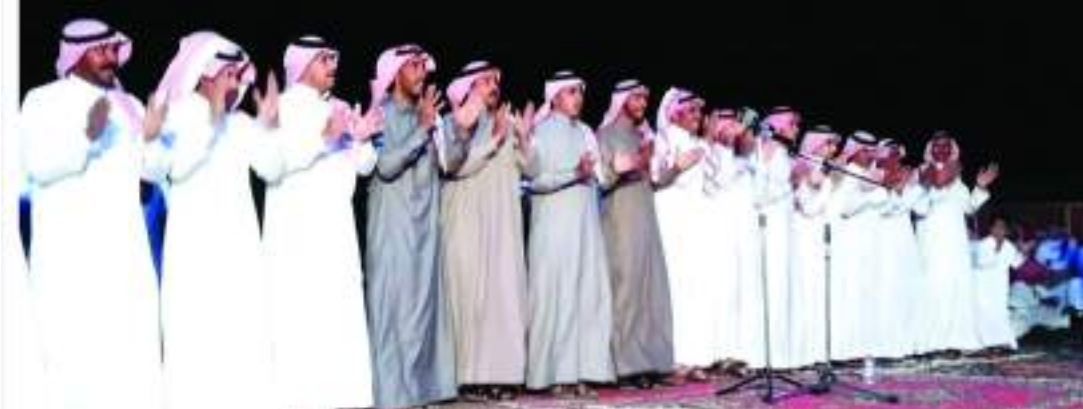
شعراء المحاوراة القلطة

وحنا بمامينا نعيد النقاشي من عقب ما كنا جبال شوأميخ صرنا تحت حلم الليالي ولا شي شي عجيب يدوخ الراس تدويخ وتلنن بعد الحر حام الفراشي أقولها والقلم أقوى من الصيخ متى نشوف الحق بالأرض ماني وحول مسابقات الشعر في القنوات التلفزيونية قال للأسف بعد أن زاد عدد المسابقات والمحطات الشعرية تدهور وضع الشعر وكثر الغث، والبسو يقولون ما كثر من شي إلا سمج.