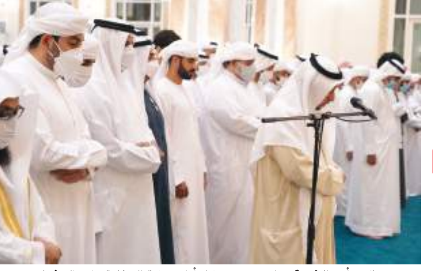
حاكم رأس الخيمة وولي عهده خلال أداء صلاة الجنازة على الجثمان

وأدى صاحب السمو الشيخ سعود بن صقر القاسمي، عضو المجلس الأعلى حاكم رأس الخيمة، وسمو الشيخ محمد بن سعود بن صقر القاسمي، ولي عهد رأس الخيمة، صلاة الجنازة على جثمان المغفور له