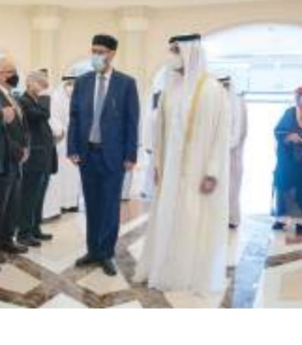
سلطان بن أحمد القاسمي خلال تكريم الفائزين

وأضاف سموه « إن الجائزة تطل من جديد على جميع المتخصصين في فروع علم اللسان في شتى أقطار العالم في توثيق الجريد اليوم، ولا أبالغ إذا قلت : هي الجائزة العربية المتخصصة المستمرة التي شقت طريقها إلى النجاح منذ أربعة أعوام، وينظرها المثقفون المتخصصون