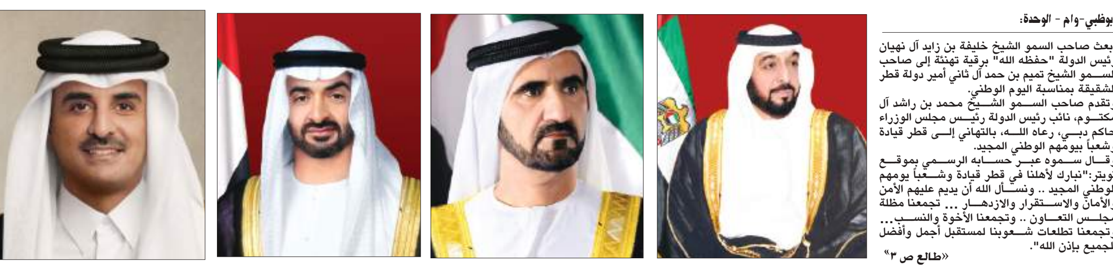
أبوظبي-وام - الوحدة:

محمد بن راشد: نبارك لأهلنا في قطر قيادة وشعباً يومهم الوطني المجيد