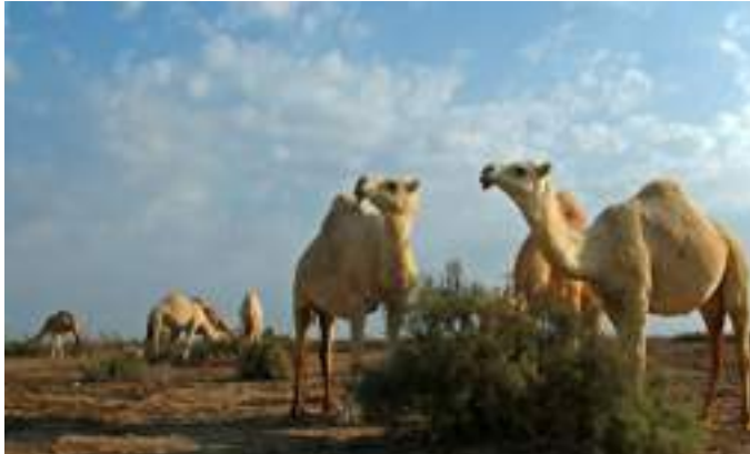
هجن صحراء الكويت