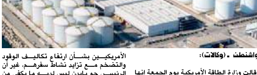
واشنطن - (وكالات):

قالت وزارة الطاقة الأمريكية يوم الجمعة إنها ستبيع ١٨ مليون برميل نفط من الاحتياطي الاستراتيجي، على أن تكون العروض من الشركات لتزويدها في الرابع من يناير كانون الثاني، وذلك في إطار ما سبق الإعلان عنه من إفراج عن احتياطي بهدف تهدئة أسعار الوقود. وإعلان البيع كان متوقعا، وذلك بعد أن أعلنت إدارة بايدن عنه في إطار زيادة الإفراج عن ٥٠ مليون برميل أخرى من الاحتياطي بالتنسيق مع دول أخرى مستهدفة للنفط منها الصين والهند وكوريا الجنوبية. وكانت وزارة الطاقة قد قالت يوم الجمعة الماضي إنه من المقرر الإعلان عن البيع في ١٧ ديسمبر كانون الأول. تحاول الإدارة التعامل مع مخاوف المستهلكين