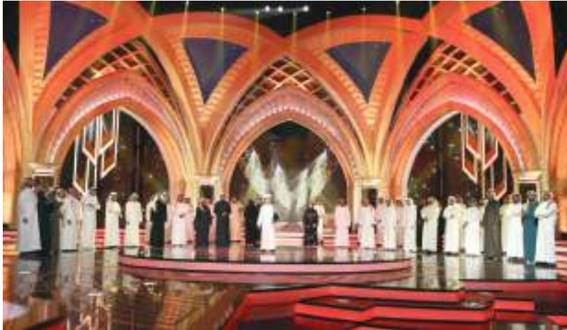
أبوظبي - الوحدة:

يحتفي بالمواسم العاشر لبرنامج الشعر النبطي «شاعر المليون»، الذي تنتجه وتنظمه لجنة إدارة المهرجانات والبرامج الثقافية والتراثية بأبوظبي، بـ ١٥ عاماً في خدمة الشعر والشعراء، والمساهمة في تطور الذاكرة الأدبية والأرتجاع بالوعي الثقافي والإنساني في العالم العربي، وتشجيع الأجيال الجديدة على تنمية مواهبهم الشعرية، وإتاحة الفرصة لهم للاحتكاك مع شعراء صغار في السن على نجاح الأوزان والقوافي والمدارس الشعرية المختلفة.