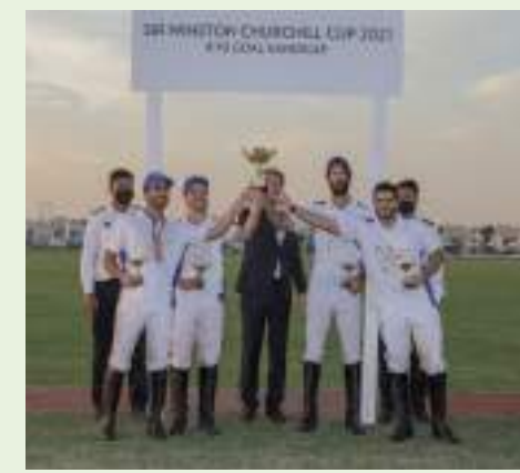
دبي - الوحدة:

فاز بالبطولة الثالثة على التوالي بن دري يتوج بطلاً لكأس ونستون تشرشل (ويحلق) في سماء البولو