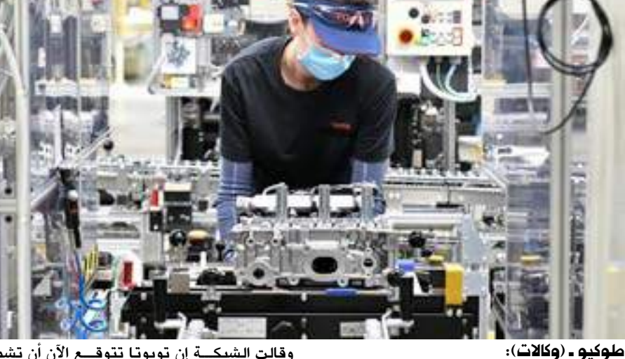
طوكيو - (وكالات):

وقالت الشبكة إن تويوتا تتوقع الآن أن تشمل عمليات تعليق الإنتاج ٢٢ ألف وحدة إنتاج في الشهر الجاري بارتفاع بواقع ١٤ ألف وحدة عن توقعات سابقة. كانت الشركة قد قالت إنها بصدد توسيع عمليات إغلاق مصانع في اليابان في ديسمبر الجاري، حسبما ذكرت وكالة بلومبرج للانباء.