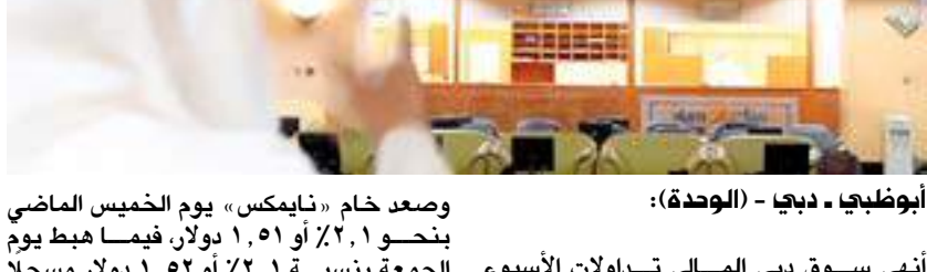
أبوظبي - دبي - (الوحدة):

أنهى سوق دبي المالي تداولات الأسبوع الماضي، مرتفعا بنسبة ٠,٦٪ عند مستوى ٣٢٧٣ نقطة، ويتداولت بلت قيمتها الإجمالية ٤٧٩ مليون درهم. وأفضل سوق أبوظبي لسلاوق المالية يوم الخميس الماضي، مرتفعا -بعد ٣ جلسات متواصلة من الانخفاض- بنسبة ٠,٤٪ عند ٨٨٥٦ نقطة، ويتداولت كبيرة بلغت قيمتها الإجمالية ٧,٧ مليار درهم. وقد ارتفع خام «برنت القياسي» يوم الخميس الماضي بنسبة ٠,٥٪ أو ١,١٤ دولار، فيما هبط يوم الجمعة ٠,٤٪ أو ١,٥٠ دولار ليصل إلى ١٨٠٤,٩٠ دولار للاوقية عند التسوية، مسجلا مكاسب أسبوعية تتجاوز ١٪.