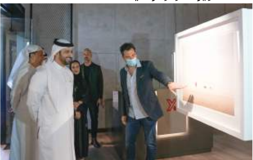
سلطان بن أحمد القاسمي خلال تفقده معرض «X للتصوير الفوتوغرافي»