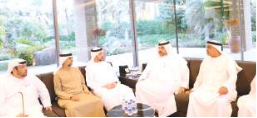
سلطان بن خليفة خلال تقديم واجب العزاء في وفاة ماجد الفطيم