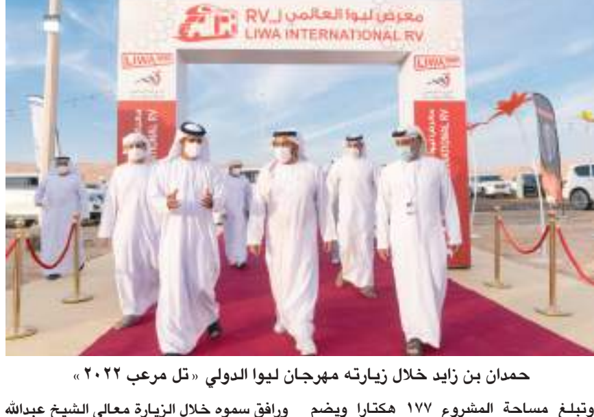
حمدان بن زايد خلال زيارته مهرجان ليوا الدولي «تل مرعب ٢٠٢٢»

كما تفقد سموه موقع مشروع منتج طين ليوا التي تنفذه شركة مدن العقارية وبلغت نسبة الإنجاز فيه ١٩ بالمائة .