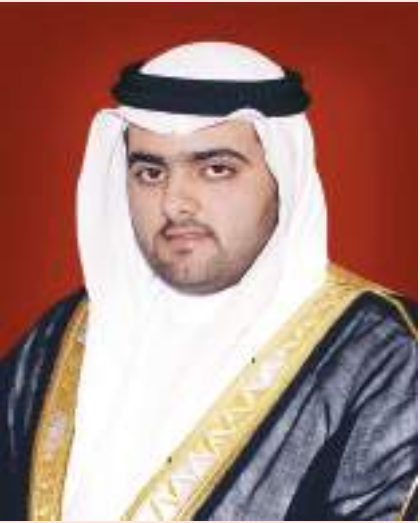
ولي عهد الفجيرة