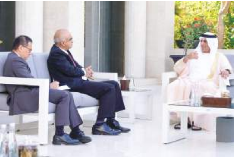
حاكم رأس الخيمة خلال استقباله سفير جمهورية سنغافورة