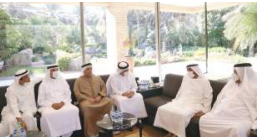
أحمد بن سعيد خلال تقديم واجب العزاء في وفاة ماجد الفطيم