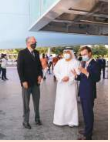
دبي - وام :

زار معالي عبدالرحمن بن محمد العويس وزير الصحة ووقاية المجتمع جناح جمهورية البرازيل في منطقة الاستدامة بمعرض إكسبو 2020 دبي والذي يحمل شعار "معا من أجل التنمية المستدامة".