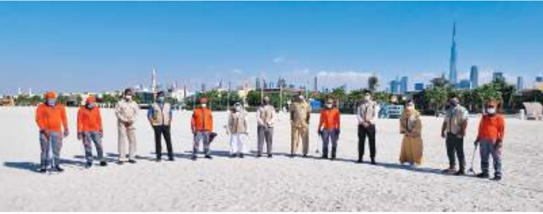
ديبي - الوحدة:

مع التزامهم الكامل بجميع الإجراءات الاحترازية الخاصة بالوقاية من جائحة «كوفيد - ١٩»، تشكل مشاركة «أفاق الإسلامية للتعمول» في مبادرة «ساعة مع عامل النظافة» تحية تقدير لعمال النظافة، وشكر لدورهم الكبير في الحفاظ على نظافة شوارعنا ومديرتنا، من خلال المساعدة في عملهم الأساسي هذا؛ وتأتي في سياق التزام «أفاق» بالارتقاء بالعمل التطوعي، وترجمة توجهاتها في توسيع نطاقه بين موظفيها، وتثقيفهم ببنينا وتوجيه رسائل توعوية حول أهمية العمل التطوعي وما يثمله من دور مهم لنجاحية المساهمة في التنمية الاجتماعية. كما تأتي تماشياً من