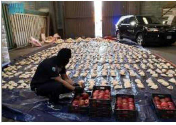
بيروت- (د ب أ):

كشفت وزارة الداخلية والبلديات اللبنانية القاضي بسام مولوي، يوم الأربعاء، عن شحنة من الليغون مرفقاً بيروت ضبطت في داخلها حوالي 9 ملايين حبة كبتاجون كانت في طريقها إلى الخليج. وقال الوزير مولوي «نعد كل الدول الشقيقة، وعلى رأسها دول الخليج أن لبنان والسلطات اللبنانية