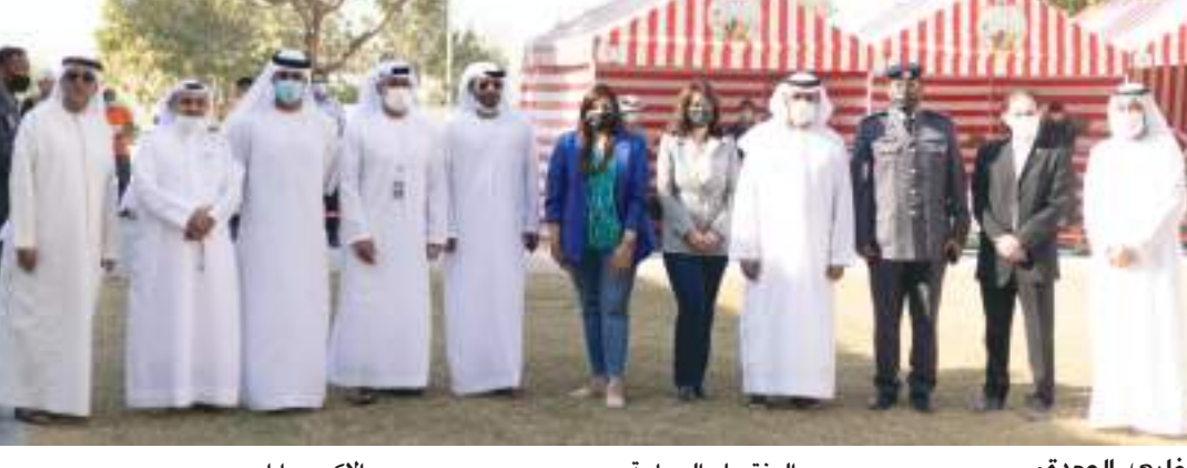
أبو ظبي - الوحدة:

أعلن ديرفيلدز مول، أحد أبرز مراكز التسوق والترفيه في أبو ظبي، عن إعادة إطلاق فعالية سوق المزارعين ابتداءً من يوم الجمعة في يوم الأحد حتى ٣١ مارس ٢٠٢٢، وذلك استجابةً لطلب الزوار لتنظيم العرض الفعالية التي توفر للمتسوقين أفضل