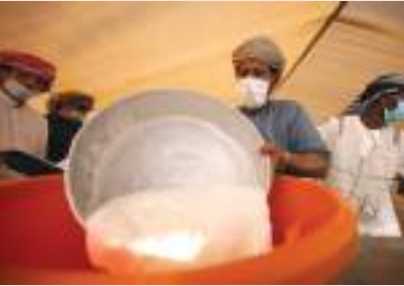
الزينة - الوحدة:

شهدت مسابقة المحالب مهرجان صاحب السمو الشيخ محمد بن زايد آل نهيان لسباق الهجن ومزاينة الإبل، إقبالاً كبيراً من ملك الإبل المحليات والمهجنات الأصيل في الإمارات ودول الخليج وعدد من الدول العربية.