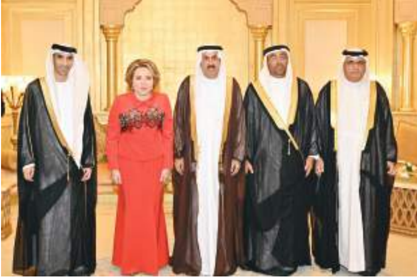
أبو ظبي - وام :

ومروان المهيري أعضاء المجلس الوطني الاتحادي و الدكتور عمر النعيمي الأمين العام للمجلس، وسعادة عفراء البسطي الأمين العام المساعد للاتصال البرلماني. وقال صقر غباش رئيس المجلس الوطني الاتحادي إن العلاقات الثنائية بين دولة الإمارات وجمهورية روسيا الاتحادية تتمتع بمستوى عالٍ من التقارب والانفتاح، مشيراً إلى أن الزيارات الثنائية البرلمانية لها دور مهم في تعزيز وتطوير التعاون الاستراتيجي المشترك في مختلف المجالات منها السياسي والدبلوماسي والاقتصادي والتجاري والاستثماري والثقافي. وأكد أهمية التعاون بين الدولتين في جميع المجالات لا سيما في دعم توجهات الجانبين في القضايا ذات الاهتمام المشترك لما تحققه هذه الشراكة من مزيد من التفاهم والتعاون والتنسيق على الصعيد الدولي.