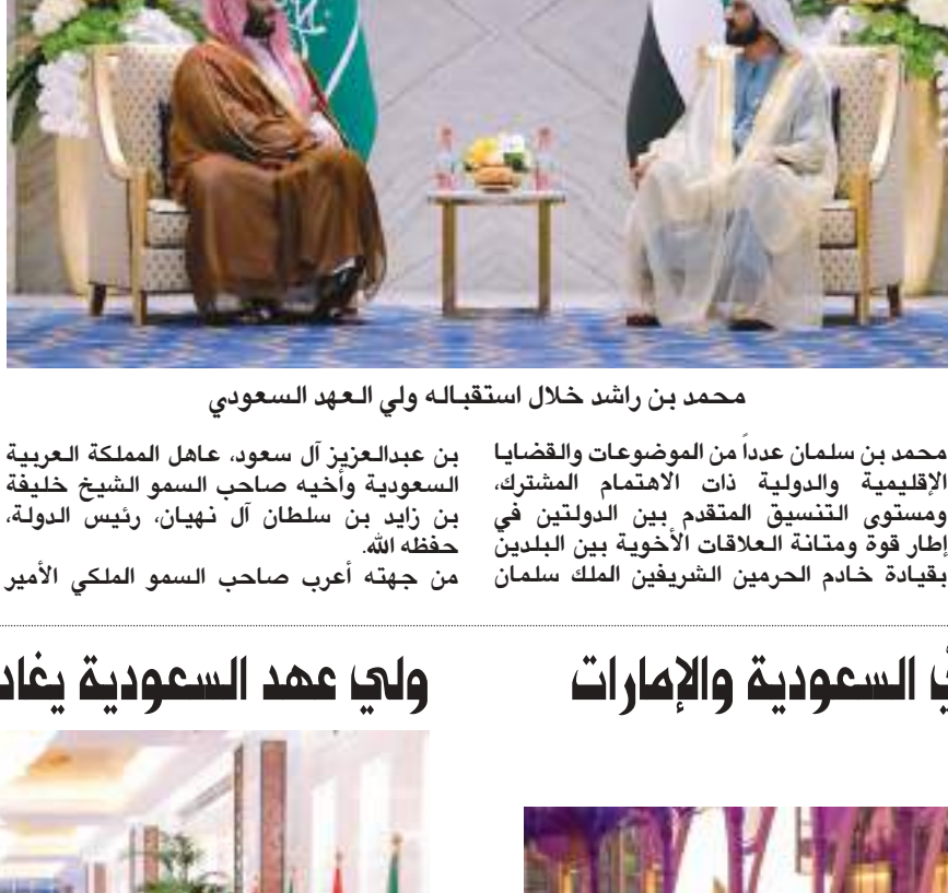
محمد بن راشد خلال استقباله ولي العهد السعودي

واستعرض صاحب السمو الشيخ محمد بن راشد آل مكتوم وصاحب السمو الملكي الأمير