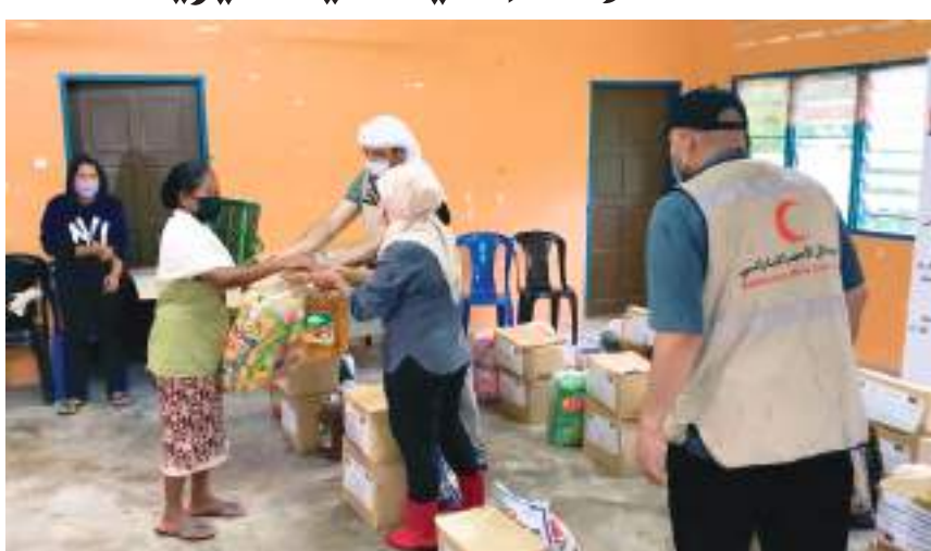
خلال توزيع المساعدات

من جانبه أكد سعادة الدكتور محمد عتيق الفلاحي الأمين العام لهيئة الهلال الأحمر الإماراتي أنه بتوجيهات القيادة الرشيدة