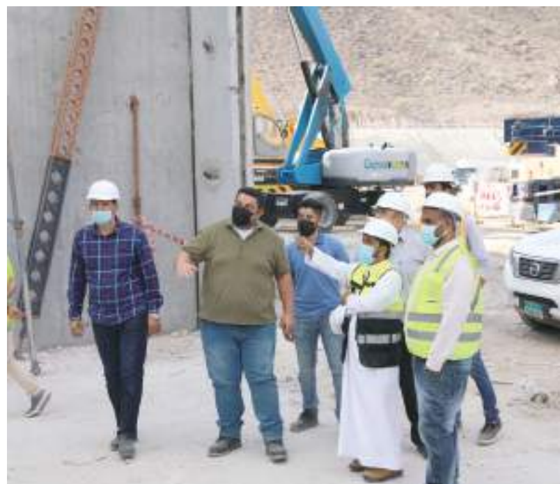
خلال تفقد سير العمل في مشاريع الدائرة

وأضافت إن البرنامج يعتبر مشروعاً متكاملًا يشمل الجانب العلمي والجانب العملي ويتضمن أيضاً دورات حضورية واقتراضية تقدم مواضيع عن تنمية القدرات وتطوير الشخصيات من أجل تحمل المسؤولية تجاه النفس والمجتمع والعمل مشيرة إلى أن النسخة الرابعة من البرنامج تعمل على إتاحة فرص جديدة للشباب