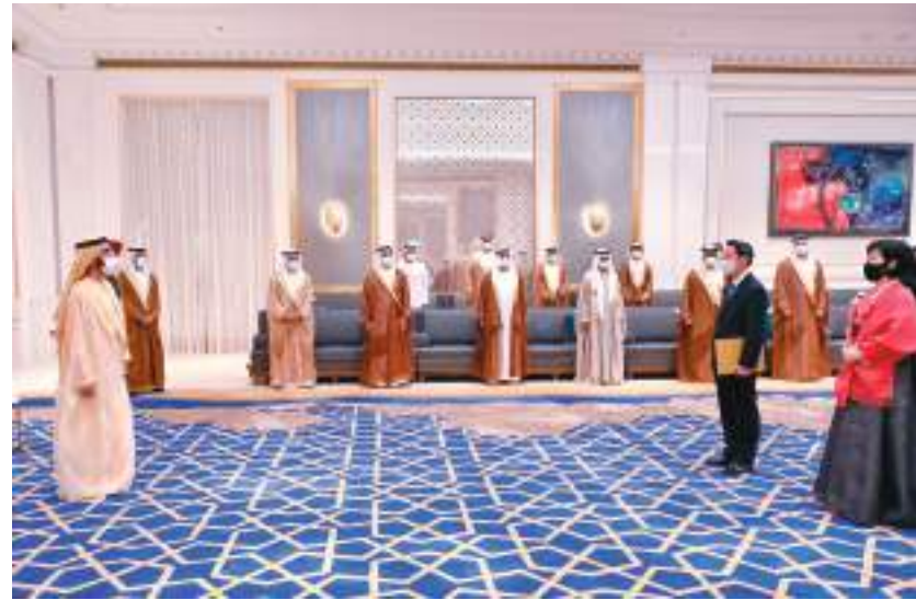
محمد بن راشد خلال تسلمه أوراق اعتماد سفير كوريا الجنوبية