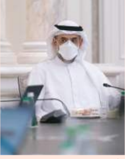
الشارقة - وام :

ترأس سمو الشيخ سلطان بن محمد بن سلطان القاسمي ولي العهد نائب حاكم الشارقة رئيس المجلس التنفيذي، صباح الثلاثاء ويحضره سمو الشيخ سلطان بن أحمد بن سلطان القاسمي نائب حاكم الشارقة، اجتماع المجلس التنفيذي لإمارة الشارقة، وذلك في مكتب سمو الحاكم. بحث المجلس خلال اجتماعه مجموعة من الموضوعات المرجحة على جدول أعماله، واتخذ خلالها القرارات التي تصب في مصلحة الإمارة من خلال تطوير العمل الحكومي ورفد الإمارة بأفضل البنى التحتية في مختلف المجالات. واستمرار الجهود في دعم رواد الأعمال الشباب من المواطنين لتأسيس مشروعات تجارية تحقق لهم الدخل المناسب وتعزز من خبراتهم في الأعمال، وتدعم السوق الاقتصادي، اعتمد المجلس مقترح إنشاء «حاضنة رواد الافتراضية»، التي تهدف إلى تعزيز بيئة الأعمال في إمارة الشارقة من خلال جذب الشباب الطموح من الطلاب وخريجي الجامعات ورواد الأعمال مع توفير التسهيلات التي تساعدهم للدخول في مجالات الاستثمار والعمل الحر.