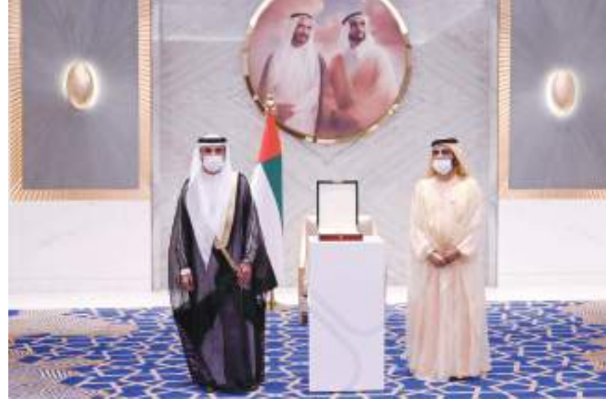
محمد بن راشد خلال تكريم الفائزين