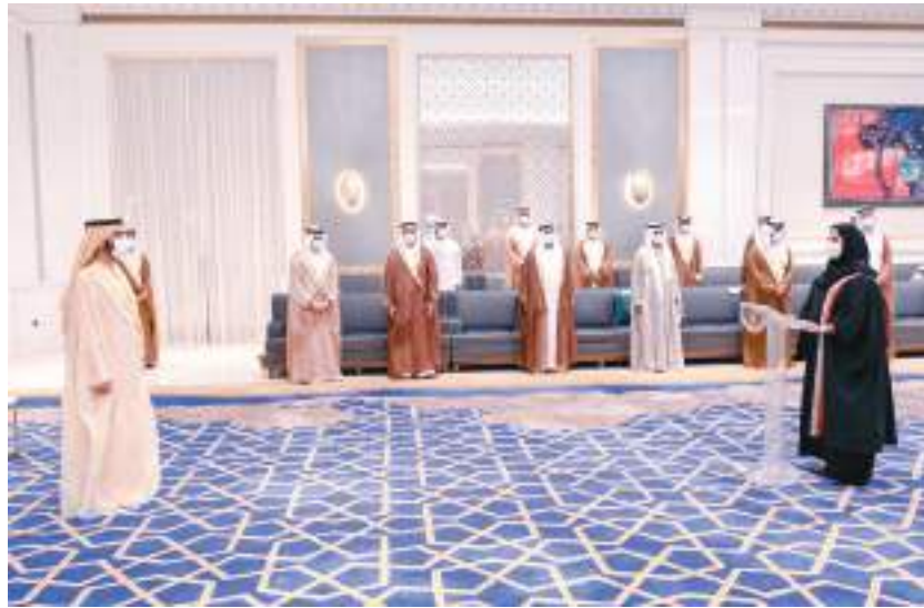
أمام محمد بن راشد عدد من القضاة الجدد يؤدون اليمين القانونية