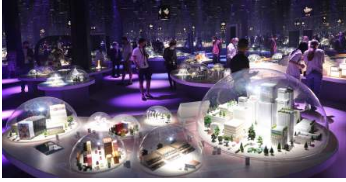
دبي - وام:

أشادت يابوناكا أيكو، الأمين العام لجنام اليابان في إكسبو 2020 دبي، بالتنظيم المتميز والجهود الحثيثة التي قامت بها دولة الإمارات حتى يظهر معرض إكسبو 2020 دبي الدولي في صورة استثنائية رغم جائحة «كوفيد 19»، وبالالتزام الكامل بالإجراءات الاحترازية من ارتداء الكمامات وعمل اختبارات دورية لسلامة الزائرين والعاملين.