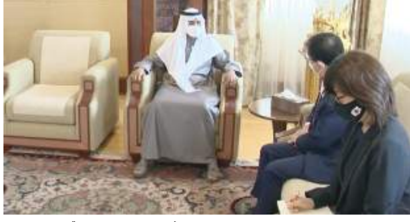
نهيان بن مبارك خلال استقباله سفير اليابان لدى الدولة.