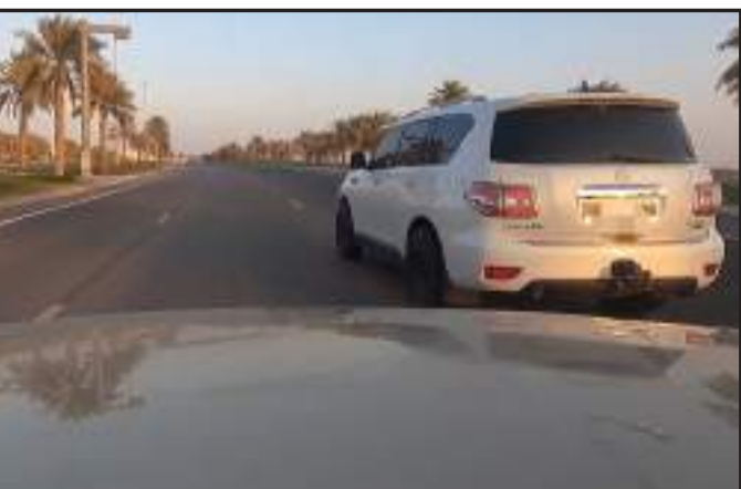
أبو ظبي - الوحدة:

دعت شرطة أبو ظبي السائقين إلى أهمية استعمال إشارة تغيير الاتجاه عند قيادة المركبة في الوقت المناسب وكذلك إنباء السائق المناسب تجنباً لوقوع الحوادث المرورية الناتجة عن الانحراف عن الطريق دون تنبيه المركبات الأخرى وأوضحت أنه تم تحرير 16378 مخالفة في إمارة أبو ظبي لعدم استعمال الإشارات عند تغيير اتجاه المركبة أو الدوران خلال عام 2021م.