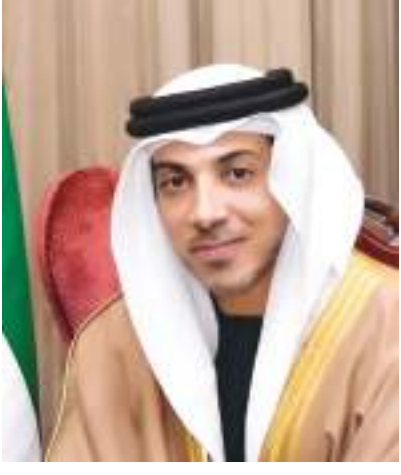
منصور بن زايد

تحت رعاية سمو الشيخ منصور بن زايد آل نهيان، نائب رئيس مجلس الوزراء وزير شؤون الرئاسة، نظم برنامج الإمارات لبحوث علوم الاستمطار حفلا في جناح دولة الإمارات بمعرض «إكسبو ٢٠٢٠ دبي» لتكريم الحاصلين على منحة الدورة الرابعة للبرنامج، بحضور معالي الدكتور سلطان بن أحمد الجابر، وزير الصناعة والتكنولوجيا المتقدمة، ومعالي فارس محمد المزروعى، المستشار بوزارة شؤون الرئاسة، رئيس مجلس أمناء المركز الوطني للأرصاد.