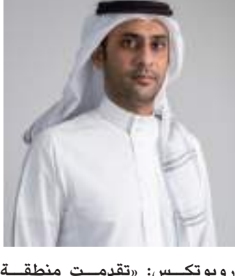
دبي - الوحدة:

يذكر أن مركز الخدمات الأول من نوعه لشركة بروفن روبوتكس يعزز عمليات الشركة في المنطقة في وقت يشهد ارتفاع الطلب على التقنيات المتقدمة في جميع أنحاء العالم. فمن المتوقع أن ينمو سوق خدمات الروبوتات عالمياً بواقع 35 مليار دولار أمريكي خلال الفترة بين عامي 2021 و 2025 بمعدل نمو سنوي مركب قدره 22 بالمائة، فيما تنتقل الشركات إلى الحلول المؤتمتة لدعم عملياتها اليومية والصيانة وخدمات ما بعد البيع لا زالت تمثل تحدياً في المنطقة بينما يتم شحن قطع الغيار إلى بلد المنشأ لصيانتها». وأضاف: «نشهد تحولاً سريعاً لمفهوم عمل الروبوتات والبشر بكل كبير وبخاصة في قطاعات النقل والتنظيف الاحترافي والطب والضيافة والصناعة.