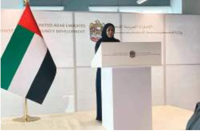
بوميد وزيرة تنمية المجتمع

في حال عزمها القيام بجمع التبرعات فيها. وأكدت سعادتها أنه يتم النظر حاليا في شأن الجمعيات والمؤسسات الخيرية الإنسانية على مستوى الدولة وآلية جمع التبرعات لديها حسب ما يرد في اللائحة التنفيذية للقانون بما يحقق الأهداف المرجوة وفق بنود وضوابط قانون جمع التبرعات مشيرة إلى أن الوزارة تعمل بالتنسيق مع الجهات المحلية على وضع آلية موحدة لتصنيف هيئات وجمعيات ومؤسسات خيرية أخرى في الدولة سيتم إضافتها لقائمة الجمعيات والمؤسسات المعتمدة لجمع التبرعات إذا ما استوفت الشروط والضوابط في شهادة التصنيف.