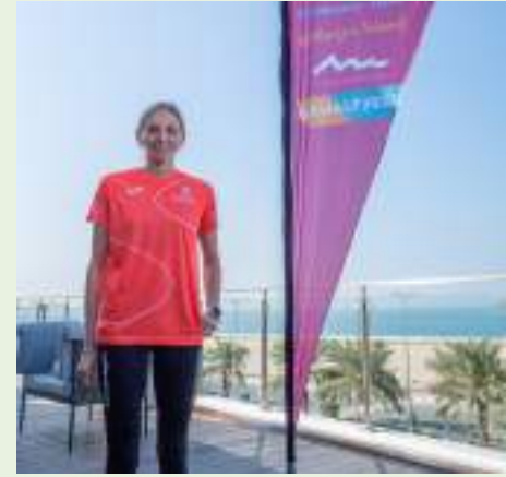
رأس الخيمة / وام /

نصف ماراثون رأس الخيمة يعلن انضمام نخبة العدائين في العالم