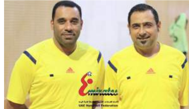
أبوظبي - وام :

الثلاثاء إلى المملكة العربية السعودية، لمتابعة منتخبنا الوطني الأول خلال مشاركته في البطولة الآسيوية للرجال التي تقام في "الدامام" خلال الفترة من 18 إلى 31 يناير الجاري. وكانت بعثة منتخبنا الوطني قد وصلت إلى المملكة العربية السعودية أمس الأحد استعداداً لمشاركته في البطولة الآسيوية، حيث يتواجد منتخبنا بالمجموعة الثالثة التي تضم منتخبات قطر والعراق وعمان.