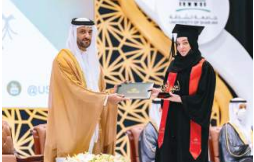
سلطان بن أحمد القاسمي خلال حضوره حفل التخرج

المجالات، وأن تضع نصب عينيها بأن القادم هو مرحلة عطاء ومساهمة في تنمية الأوطان، وأن دورها في بناء الأثرة التي ستنهض بالمجتمعات هو الأهم، لأنه أصبح مينيًا على علم ودراية بالحياة وشؤونها. كما أدعوكن إلى استحضار الإخلاص في ميادين العمل، وأن تكن