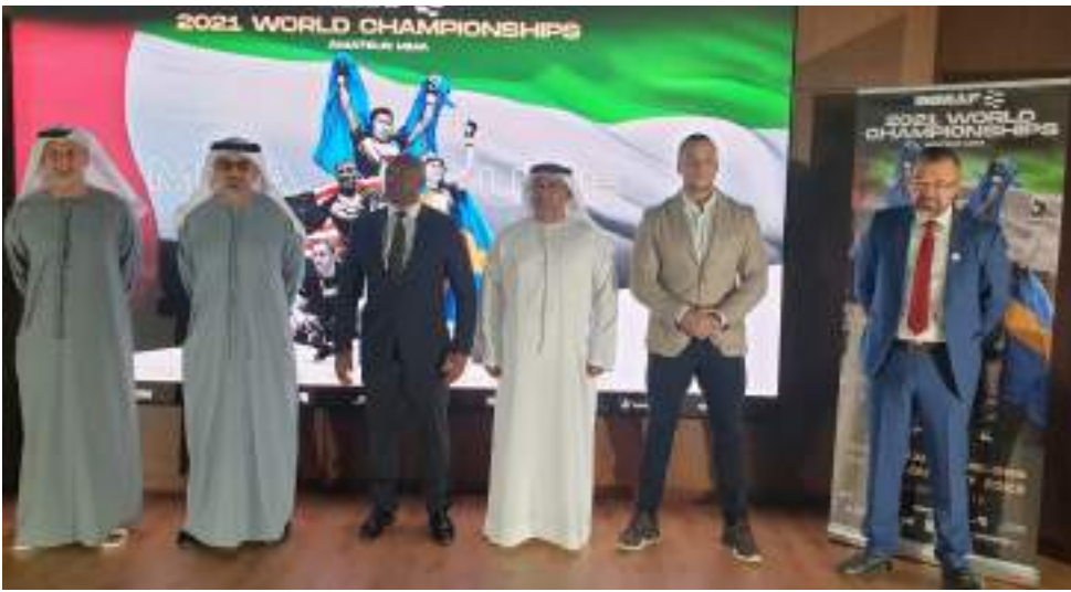
أبوظبي - الوحدة:

كشفت مجلس أبوظبي الرياضي عن آخر المستجدات والتحضيرات لإستضافة بطولة العالم للفنون القتالية المختلطة، التي ستقام بصالة أرينا جوجيتسو في مدينة زايد الرياضية، والتي تقام فعاليتها خلال الفترة من 24 إلى 29 من يناير الجاري، في خطوة تؤكد المكانة والسمة المرموقة للعاصمة أبوظبي وريادتها في استضافة البطولات الرياضية العالمية