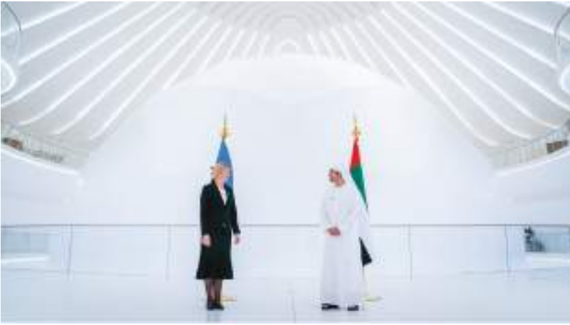
عبدالله بن زايد خلال استقباله وزيرة خارجية إستونيا في مقر إكسبو ٢٠٢٠