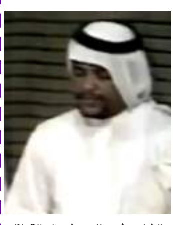
الشاعر في برنامج شعراء القبائل