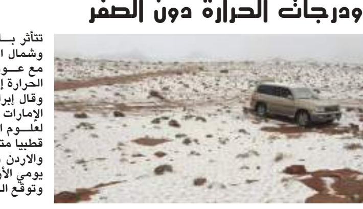
تتأثر بلاد الشام والاردن والعراق وشمال السعودية بمنخفض قطبي مع عودة الثلوج وانخفاض درجة الحرارة إلى دون الصفر.

الحرارة المتدنية واستمرار الأجواء الباردة خلال الأسبوع المقبل على المناطق الشمالية من الجزيرة العربية وبلاد الشام والعراق. وأوضح أنه من المتوقع ان تصاحب تقدم هذه الكتلة هطول أمطار وثلوج على بلاد الشام حيث قد تتدنى درجات الحرارة الدنيا إلى ما دون 5 - درجات مئوية تحت الصفر في العاصمة السورية دمشق خلال الفترة من الخميس إلى الأحد.