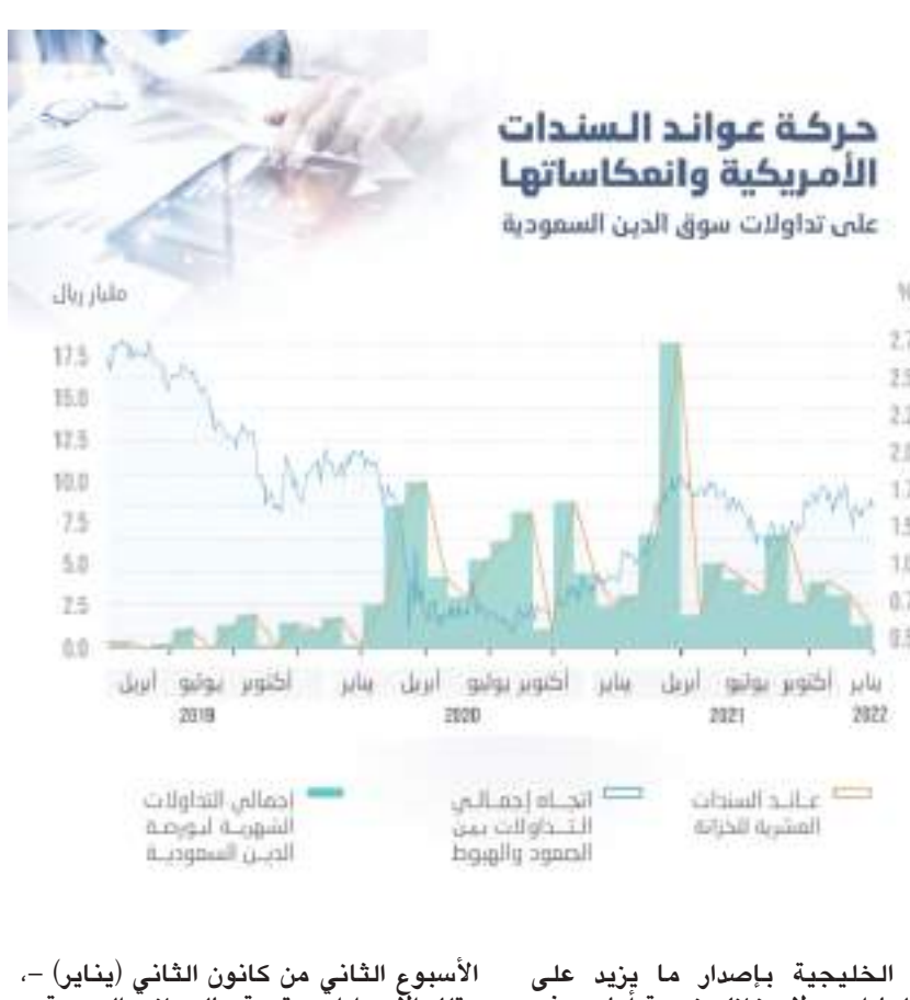
حركة عوائد السندات الأمريكية وانعكاساتها على تداولات سوق الدين السعودية

إعداد البيانات المالية للجهات المستثمرة، حيث يوشك المستثمرون المؤسسيون سواء في السعودية أو الأسواق الناشئة على إقفال دفاترهم المحاسبية خلال تلك الفترة. وأسهم ارتفاع عوائد الخزائنة الأمريكية في التأثير في معنويات المتداولين في السوق المحلية وذلك بعد انخفاض قيم إجمالي التداول في سوق أدوات الدخل الثابت المحلية بمقدار 19,31 في المائة على أساس سنوي للعام الماضي وذلك على الرغم من تصاعد أسعار النفط فوق المتوسط السنوي وتحسن نشاط الأعمال في القطاعات غير النفطية وصدور توقعات إيجابية لنمو الناتج المحلي الكلي من صندوق النقد الدولي، حيث أعطى ارتفاع أسعار النفط دفعة إيجابية لاقتصاد المملكة. يذكر أن سوق الدين قد بلغت ذروتها من حيث إجمالي التداولات السنوية في 2020 حين وصلت إلى 75 مليار دولار، بينما في 2019 بلغت 10,18 مليار دولار. ونقلت منصة «ريد»، المتخصصة في التحليلات المتعمقة عن أدوات الدخل الثابت في الأسواق الناشئة، عن قيام جهات