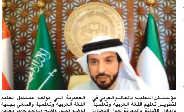
الشارقة - وام:

المجال، مع دعم كل الأطراف المعنية بتعليم اللغة العربية وتعلمها للناطقين بها، وبغيرها من المعلمين، والمترجمين، التربويين، ومصممي المناهج والباحثين، ومخططي السياسات التعليمية، وذوي الاختصاص من العاملين في مجال التربية والتعليم. كما تضمن الافتتاح فقرة العرض المرئي من إعداد المركز التربوي للغة العربية لدول الخليج بالشارقة، والذي استعرض فيه أهم إنجازاته خلال هذا العام في مجال التدريب والمؤتمرات، والندوات، والإصدارات العلمية، والبرامج. وفي ختام فقرات الافتتاح جاءت كلمة المشاركين بالمؤتمر والتي القاها سعادة الدكتور وائل بن مطر الحربي والتي قال فيها: «لقد كان نزول القرآن الكريم باللغة العربية تحولا عظيما في تاريخ هذه اللغة: فقد أدى ذلك إلى ارتباط اللغة العربية بكتاب سماوي تكفل الله بحفظه ويقانه إلى يوم الدين، قال تعالى: /إننا نحن نزلنا الذكر وإنا له لحافظون/ وبهذا خرجت من إطار محدود إلى أطر لا محدودة مكانيا وزمانيا وأمتدت بامتداد الإسلام نفسه». وقيل الإعلان عن بدء فعاليات المؤتمر جاءت فقرة التكريم عن بعد حيث تم تقديم الدروع إلى وزارة التربية والتعليم ومكتب التربية العربي لدول الخليج على الدعم المستمر للمركز. كما تم تكريم المشاركين في الجلسة الافتتاحية للمؤتمر، وهم معالي الأستاذ الدكتور عبدالحميد مذكور الأمين العام لجمع اللغة العربية بالقاهرة والأمين العام لاتحاد المحامد مذكور اللغوية وسعادة الأستاذ الدكتور محمد المرسي عضو مجمع اللغة العربية بالقاهرة وسعادة الدكتور محمد المستغنامي أمين عام مجمع اللغة العربية بالشارقة وسعادة الأستاذ الدكتور مامون وجيه عضو مجمع اللغة العربية بالقاهرة ورئيسة الندوة