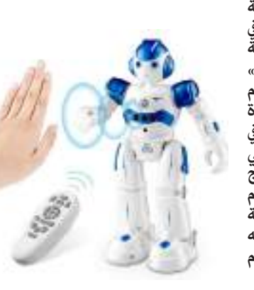
الروبوتات التي أوردتها الدورية العلمية «ساينس أدفانس»

ابتكر فريق من الباحثين في الصين رقاقة إلكترونية مرنة تثبت على الجلد بغرض التحكم عن بعد في حركة الروبونات. ويقول الباحثون في الدراسة التي أوردتها الدورية العلمية «ساينس أدفانس» إنه تم من قبل اختراع العديد من الأنظمة للتحكم عن بعد في الروبونات، ولكن معظم هذه الأجهزة كانت ضخمة ولا تتيح التحكم بسهولة في حركة الروبونات. ولكن الرقعة الإلكترونية التي طورها الفريق البحثي من جامعات هونج كونج وداليان وتسينجهاوا، بالإضافة إلى جامعة العلوم الإلكترونية والتكنولوجيا في الصين، تثبت بسهولة على ذراع الشخص من أجل تسجيل حركاته المختلفة ثم تحويلها إلى إشارات لاسلكية للتحكم في حركة الروبوت.