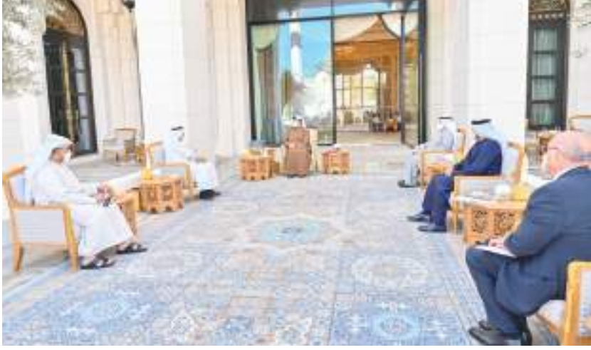
منصور بن زايد خلال استقباله مجلس إدارة الأرشيف والمكتبة الوطنية