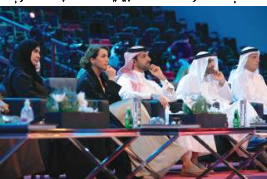
سلطان بن أحمد القاسمي خلال حضوره الجلسة الأولى للقمة البيئية

ملايين الأطنان سنوياً من النفايات البلاستيكية، الكفيلة بالقضاء على أنواع كثيرة منها. وقال // أعمال في الوقت الراهن مع /ناشيونال جيوغرافيك/ على مشروع /عجائب الطبيعة/. لوضّح قيمة الماء وقيمة التنوع البيولوجي، وأثار ذلك على الحياة، على مدار عقود من الزمن، فاجبتنا أن نقدم لكم صورة للتغيرات التي يشهدها هذا الجانب من الطبيعة، لفهمها والوعي بأثرها، ومدى أهمية أن ندرّكوا أن الحياة مترابطة وتحدثت جينيفر هايز عن فقرة الهاربور «الخاتم» وما تتعرض له من مخاطر بسبب التغيير المناخي، وتقلص المساحات الجليدية، مشيرة إلى أنها مرّت بتجربة سيئة جدا في خليج سانت لورانس، إذ بعدما انتهت من رحلة بحرية لاستكشاف هذا النوع من الفقمات والمخاطر المحدقة به، تلقت خبراً مفاجئاً حول ضرب عاصفة قوية لذلك الخليج، ما تسبب في قتل العديد من الفقمات التي كانت تستعد هناك للتكاثر، بحكم أنها لا تتكاثر إلا على الجليد.