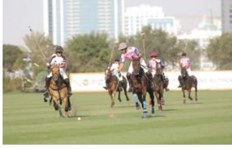
الشوط يحرز انكورا هدفه الأول . وفي الشوط الثالث يدرك فريق انكورا بهدفي الشوط الثاني ويستأنف اللعب

حقق فريق الباشا فوزاً مستحقاً على منافسه فريق إيست لامار وبسطة أهداف مقابل أربعة أهداف في بطولة الماسترز للبولو والتي تستمر حتى يوم السبت الموافق الثاني عشر من شهر فبراير الجاري تقام ببادي ومنتجع الجوتور للبولو والفروسية دبي لاند بعد مباراة جيدة المستوى شهدت ذبابة في شوطها الأول والثاني فيما رجحت كفة الباشا في الشوطين الآخرين ليخرج فائزاً بنتيجة الجارة وفي المباراة الثانية والتي جمعت بين فريقين الإمارات وانكورا فقد تساوت الكفتان حيث بدأت المباراة بحذر بالبطولة اما المباراة الثانية فسوف تقام في الرابعة عصرا وتجمع بين فريق إيست لامار وفريق مهرة.