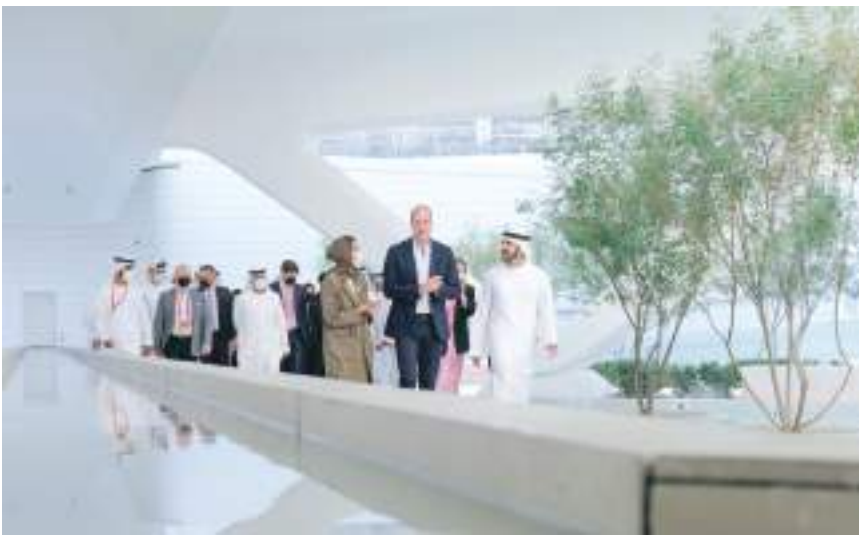
حمدان بن محمد خلال استقباله الأمير وليام في إكسبو

وأكد سمو الشيخ حمدان بن محمد بن راشد آل مكتوم اعترافاً بن دعم إحدى أبرز المبادرات التي أطلقها الأمير وليام، وهي مبادرة «متحدون من أجل حماية الحياة البرية»، من خلال مشاركة