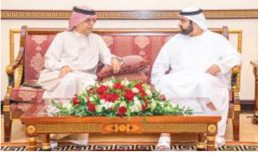
ولي عهد الفجيرة خلال استقباله رئيس اتحاد كرة القدم الآسيوي