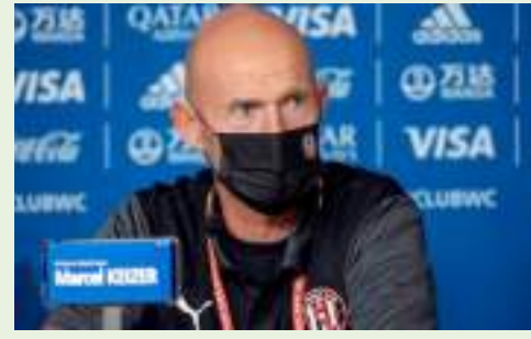
أبو ظبي - وام :

مدرب الجزيرة : فريقي لم يظهر بالشكل المطلوب أمام مونتييري