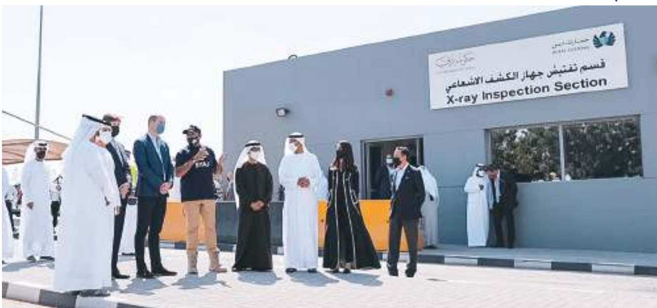
الأمير ويليام خلال زيارته وإطلاعه على جهود شركاء مبادرة «متحدون من أجل الحياة البرية»