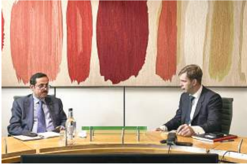
صقر غباش خلال لقائه رئيس لجنة شؤون الدفاع في مجلس العموم البريطاني