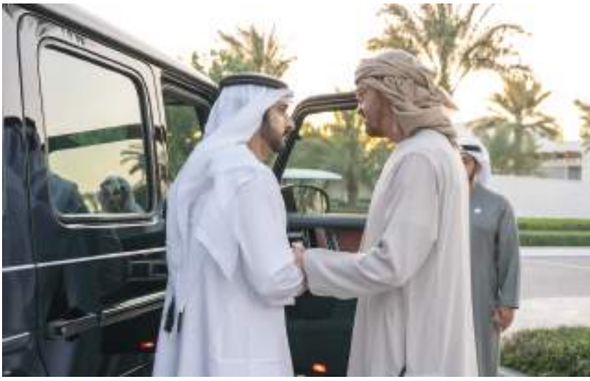
محمد بن راشد ومحمد بن زايد خلال اللقاء بحضور حمدان بن محمد

ويأتي نشر هذه المعلومات في إطار حملة النيابة العامة للدولة المستمرة لتعزيز الثقافة القانونية بين أفراد المجتمع ونشر جميع التشريعات المستحدثة والمحدثة بالدولة، ورفع مستوى وعي الجمهور بالقانون، وذلك بهدف نشر ثقافة القانون كأسلوب حياة.