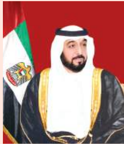
رئيس الدولة ونائبه ومحمد بن زايد يهنئون الرئيس الإيراني باليوم الوطني