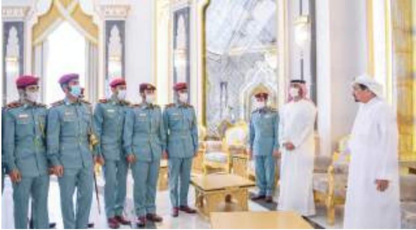
حاكم عجمان خلال استقباله خريجي «حفل تخريج الخمسين» بحضور ولي عهده

وأضاف سموه أن القيادة الرشيدة لدولة الإمارات لن تدخر جهداً من أجل رفع المستوى التدريبي لشباب الوطن وكذلك القائمين على أمر وزارة الداخلية وإدارات الشرطة الذين يعملون دائماً من أجل إتاحة الفرصة لكل المواطنين وتزويدهم بالعلم والأساليب الحديثة في قيادة العمل