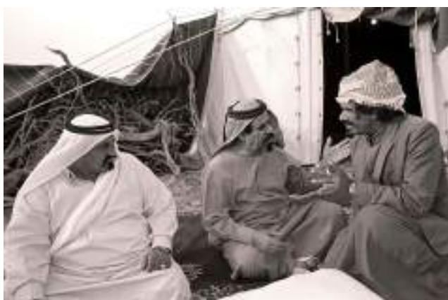
جلسات الرجال في البادية