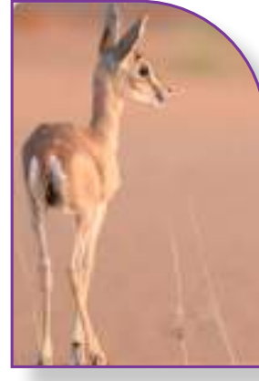
خشف الريم أو ابن الغزال يتردد ذكره بين الشعراء