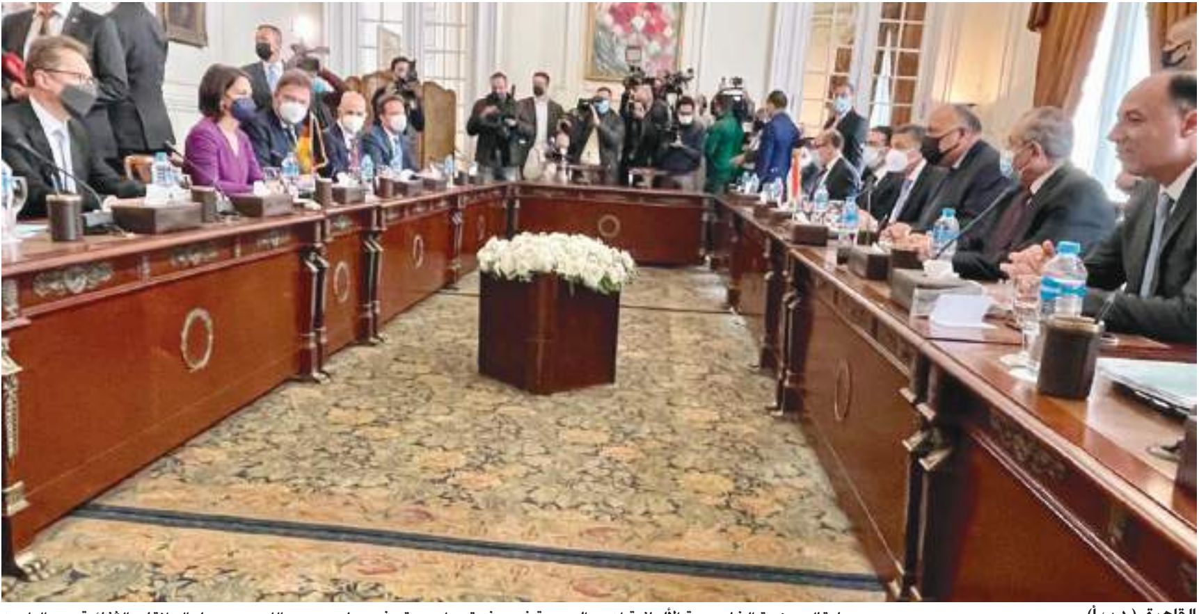
القاهرة (د ب أ) -

بدورها. قالت وزيرة الخارجية الألمانية إن بلادها تقدر دور الوساطة الذي تلعبه مصر في النزاع بالشرق الأوسط، وبشكل خاص الجهود المبدولة من أجل سكان قطاع غزة. وشددت الوزيرة الألمانية على أن «حكومة بلادها على قناعة بضرورة حل الدولتين المبني على المفاوضات في السبيل الوحيد للسلام الدائم، حتى وإن كان الطريق نحو الحل مازال طويلا، ونريد أن نواصل بذل الجهود المشتركة لأن الوضع الحالي لا يمكن الإبقاء عليه، فيدون فرصة السلام المستقبلي سوف يتكرر اندلاع العنف والتصعيد بالمنطقة». وأضافت أن مصر والمانيا يربطهما تعاون وشراكة في كافة المناحي والأوجه، معربة عن سعادتها باهتمام الشعب المصري بالمانيا، بحسب ما ذكره المتحدث باسم الخارجية