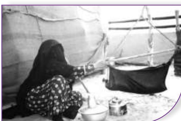
قربة خض اللبن أو السعن