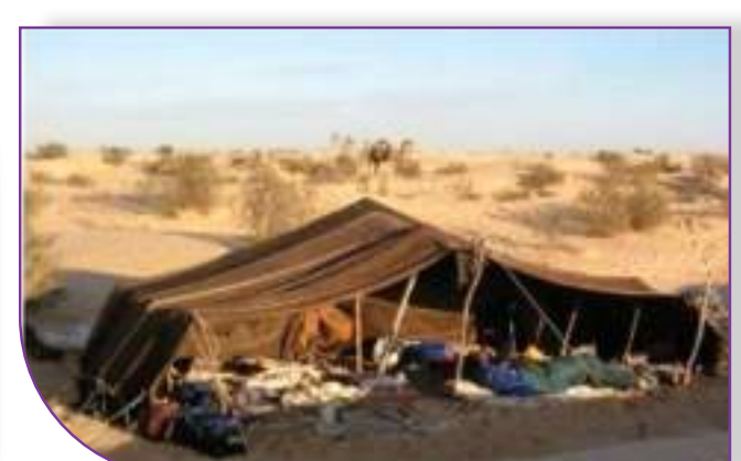
خيمة عربية أو بيت الشعر في البادية