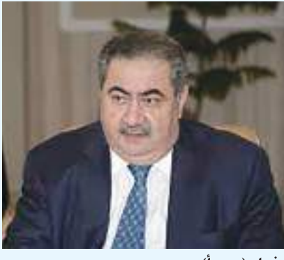
بغداد (د ب أ) -

وصف القيادي في الحزب الديمقراطي الكردستاني هوشيار زيباريا الأحد قرار المحكمة الاتحادية العليا في العراق بعدم دستورية ترشيحه لرئاسة الجمهورية للسنوات الأربع المقبلة بأنه «تسفيح ويوم حزين للعراق». وقال زيباريا في تصريح صحفي إن «قرار استبعادنا من الترشيح لرئاسة الجمهورية تسفيح، ونحن لسنا دلاء وقد استوفينا كل شروط الترشيح لرئاسة الجمهورية». وذكر نحن «نحترم قرار القضاء لكن قرار المحكمة بإستبعادنا من الترشيح للرئاسة مبيت ومسيس وهو ليس نهاية العالم ولكننا تعرضنا للظلم». وأضاف «لا يريدون رئيسا قويا للعراق وأنا مسؤول عن كلامي ولا يوجد ترشيح جديد من جانب الحزب الديمقراطي الكردستاني للمنصب وأنا المرشح الوحيد للحزب حتى الآن». وكانت المحكمة الاتحادية العليا في العراق قد أصدرت اليوم الأحد قرارا بعدم قبول ترشيح زيباريا لمنصب رئيس الجمهورية للسنوات الأربع المقبلة.