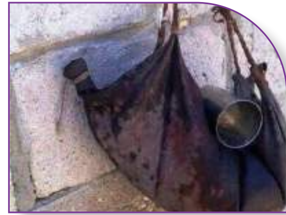
قربة الماء أو السعن في البادية