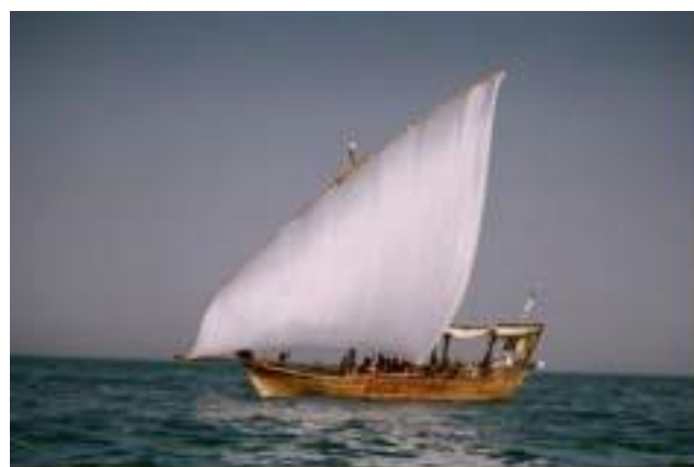
سبوك في زمن الغوص