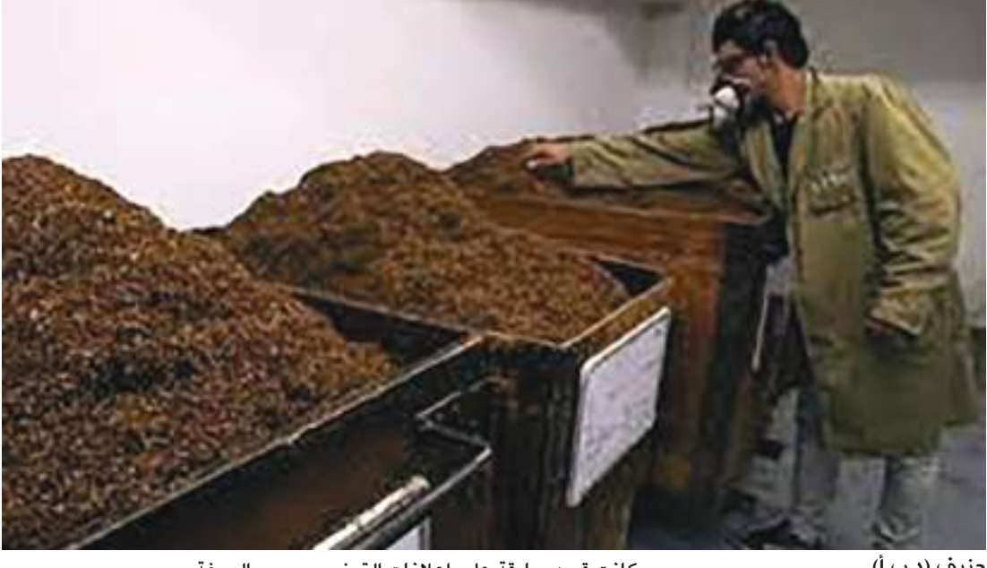
جنيف (د ب أ) -

عارض الناخبون في سويسرا الحكومة في قضيتين رئيسيتين في استفتاء جرى يوم الأحد، وفقا لتوقعات. وأيد نحو ٥٧٪ من الناخبين حظرا أكثر صرامة على إعلانات التبغ، وهي مجال مهم للإيرادات بالنسبة للحكومة، حسبما توقع استطلاعات الرأي. وسيتم منع إعلانات التبغ مستقبلا في أي مكان يمكن رؤيته من جانب الأطفال وصغار السن، ما يضع نهاية للملصقات الإعلانية لمنشآت التبغ في الأماكن العامة، بما في ذلك دور السينما ووسائل الإعلام أو في الساحات الرياضية.