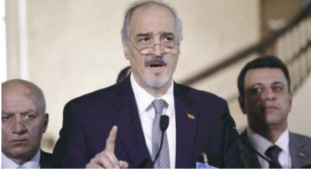
دمشق (د ب أ) -

السورية، على هامش حفل الاستقبال الذي أقامته السفارة الإيرانية بدمشق بمناسبة الذكرى الثالثة والأربعين لانتصار الثورة الإيرانية ونشرته أمس الأحد، أن «العلاقات السورية الإيرانية غيرت منطق علاقات السياسة الدولية، ومفهوم الجغرافية السياسية، لذلك علاقات البلدين ليست اعتيادية، وهي علاقة تحالف ونحن