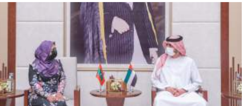
ولي عهد عجمان خلال استقباله سفيرة المالديف