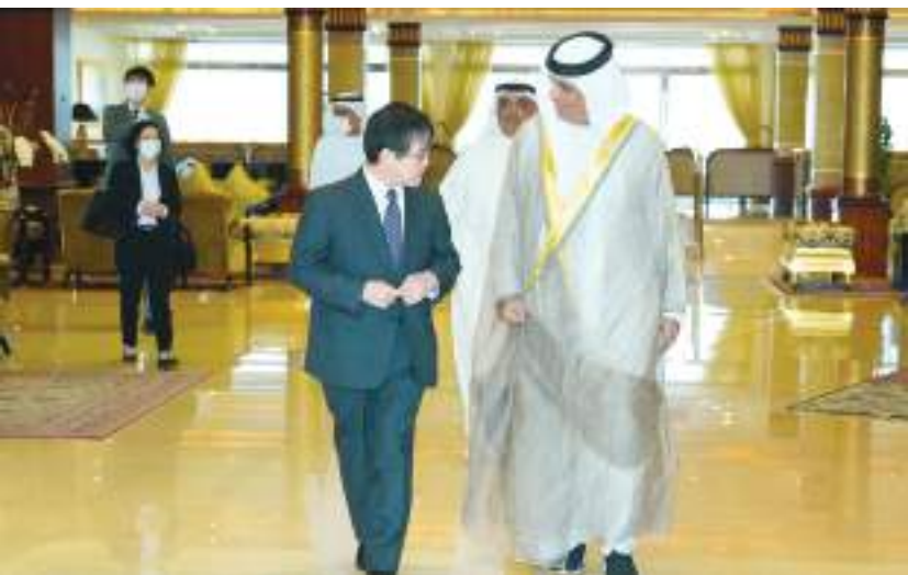
حاكم رأس الخيمة خلال استقباله سفير اليابان