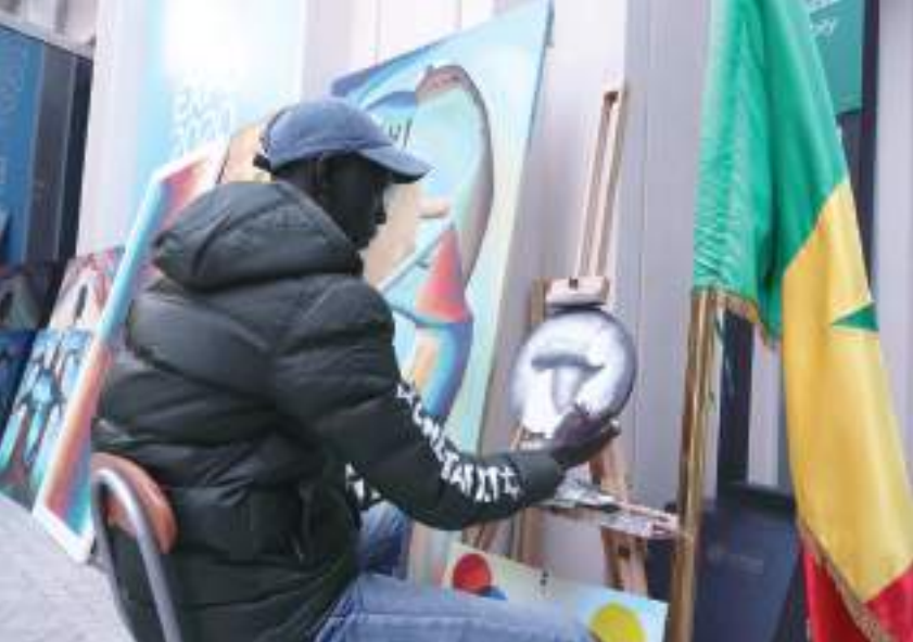
دبجيا - واهم:

شكلت الأعمال الفنية طريقها إلى العالمية من خلال معرض إكسبو ٢٠٢٠ دبي، تلك المنصة العالمية التي تسمح للفنانين والمثقفين بالتألق والإبداع والابتكار، لتصبح اللوحات الفنية، من خلال إطلالة على عالم الألوان، والتي تمزج الواقع بالرسم لتقدم لنا إحياءات تحمل أبعداً فلسفية، وفرصة للعين لتري جمال التفنن في اختيار الألوان.