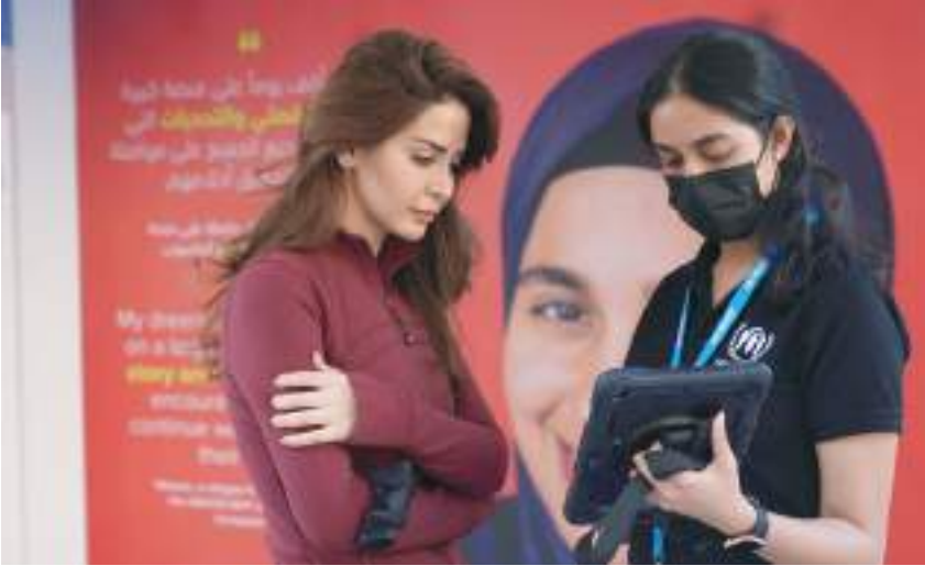
دبجيا - الوحدة:

نظمت المفوضية السامية للأمم المتحدة لشؤون اللاجئين حملة استمرت خمسة أشهر في دبي بدولة الإمارات العربية المتحدة، بالشراكة مع مجموعة ميركس للاستثمار، وهي إحدى المشاريع المشتركة بين شركة بروكفيلد لإدارة الأصول وشركة دبي القابضة. وتهدف هذه الحملة إلى حشد الدعم لبرنامج المفوضية للمنتج الدراسية الطموح للأعلى وذلك لدعم فرص التعليم العالي للاجئين حول العالم.