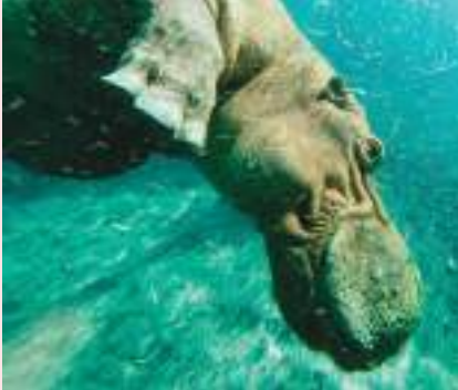
العين - واهم:

تقدم حديقة الحيوانات بالعين العديد من البرامج المتخصصة لحماية ورعاية مجموعتها من فرس النهر وذلك ضمن أعلى المعايير وأفضل الممارسات العالمية المتبعة لإكثاره وضمن جهودها في حماية الحيوانات المهددة بالانقراض.