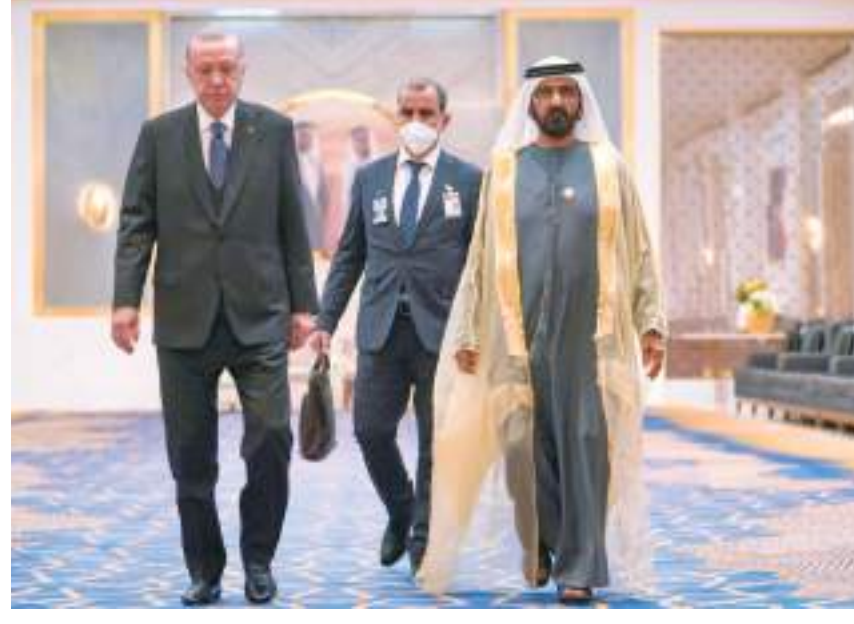
محمد بن راشد خلال استقباله رئيس جمهورية تركيا