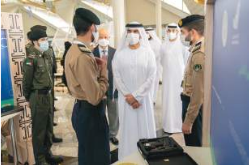
عبد الله بن سالم القاسمي خلال زيارته فعاليات شهر الإمارات للابتكار في الشارقة