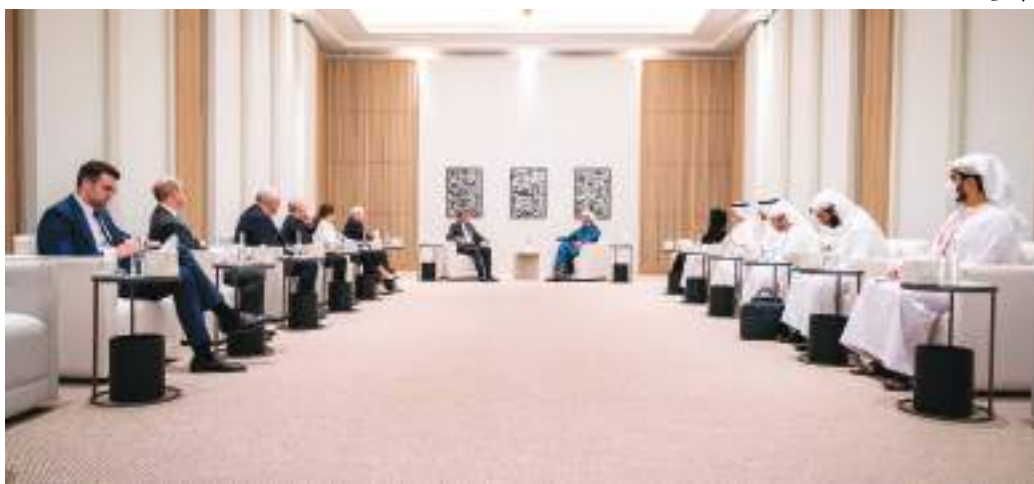
عبدالله بن زايد خلال استقباله وفد مجموعة الصداقة البرلمانية الإماراتية البريطانية فيا إكسبو

للبلدين ويعود بالخير على شعبيهما. وأشار سموه إلى أن تنظيم دولة الإمارات لإكسبو ٢٠٢٠ دبي جاء تجسيدا لنهجها الحريص على تعزيز علاقات التعاون المشترك والصداقة مع دول العالم والعمل على نشر قيم التسامح والتعايش ودفع مسارات التنمية والتقدم من أجل ازدهار المجتمعات ورخاء الشعوب. والحرص على تعزيزها في المجالات كافة بما يحقق المصالح المتبادلة