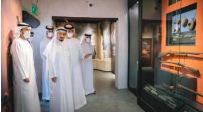
حاكم عجمان خلال جولته التفقدية بمتحف عجمان برفقة ولي عهده