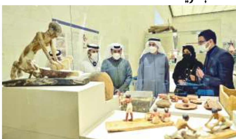
صقر غباش خلال زيارته المتحف القومي للحضارة المصرية