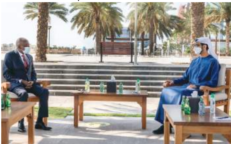
شخبوط بن نهيان خلال استقباله وزير الدولة للتنمية الاقتصادية والاجتماعية الأنغولي