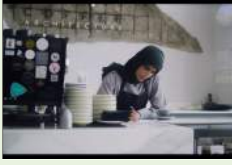
أبوظبي - وام:

في إطار احتفالات عام الخمسين، أعلنت لجنة الاحتفال باليوبيل الذهبي لدولة الإمارات عن أحدث مبادراتها وتحمل عنوان "خطوة أولى". وتدعو المبادرة كل من يعتبر الإمارات وطناً له لكتابة خطواته الأولى نحو تحقيق أحلامه وأهدافه التي يأمل بتحقيقها في الخمسين عاماً المقبلة.