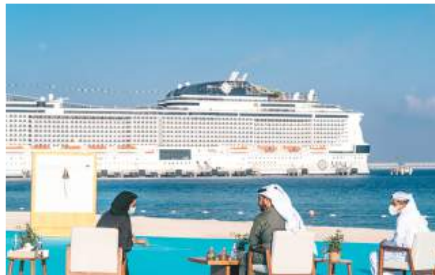
حمدان بن زايد خلال تدشين رصيف الرحلات البحرية الجديد في شاطئ صير بني ياس للسفن السياحية