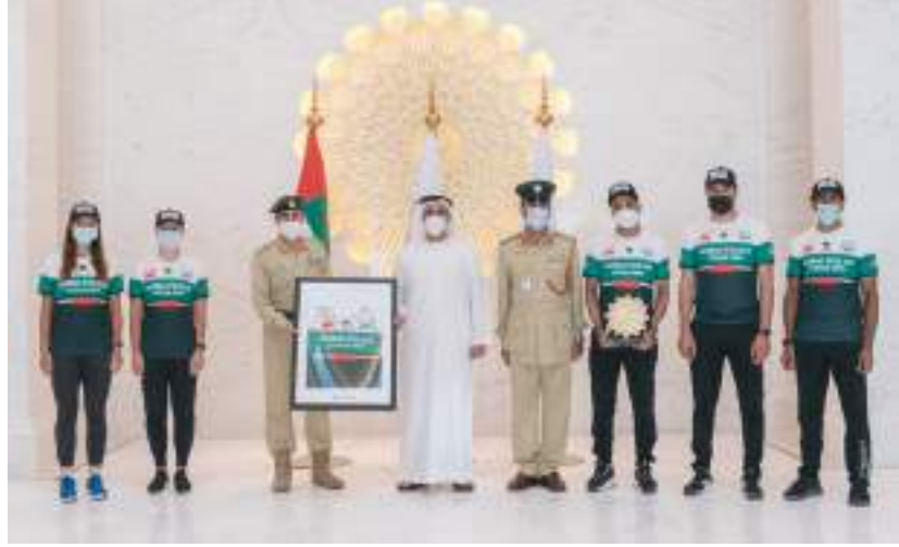
سيف بن زايد في صورة تذكارية خلال حفل التكريم