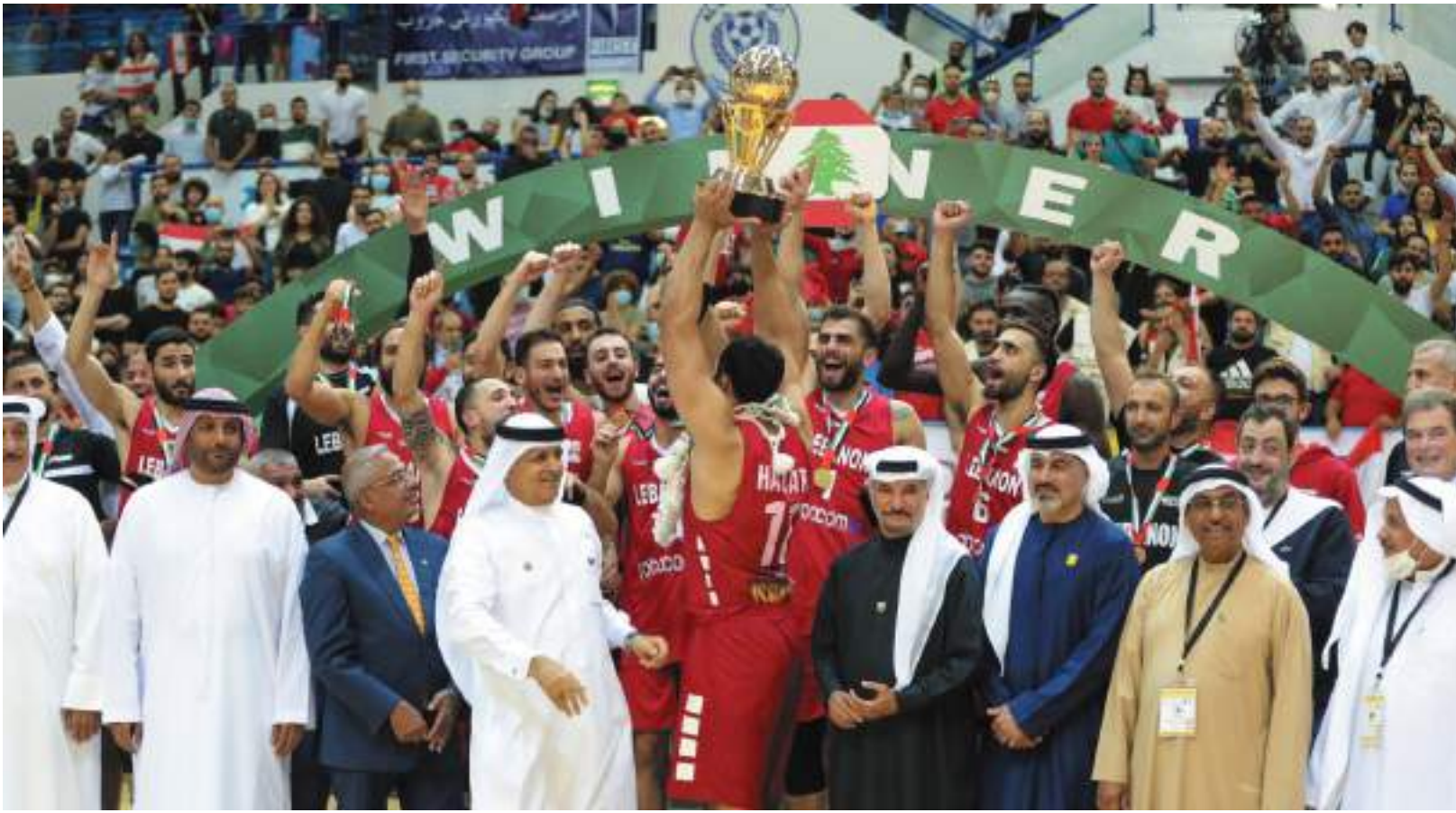
دبي - وام :

توج منتخب لبنان لكرة السلة بكأس المغفور له الشيخ حمدان بن راشد آل مكتوم، محققاً لقب البطولة العربية لكرة السلة في نسختها الرابعة والعشرين، للمرة الأولى في تاريخه، وذلك بعد تغلبه على نظيره التونسي 69-72 في المباراة النهائية التي جمعت بينهما مساء أمس الأول الأربعاء على صالة راشد بن حمدان بنادي النصر. ووسط حضور جماهيري مكثف من أبناء الجاليتين اللبنانية والتونسية، احتشدت بهم صالة الشيخ راشد بن حمدان، ساهما في إضفاء أجواء حماسية على النهائي، نجح المنتخب اللبناني في حسم نتيجة اللقاء لمصلحته في الثواني الأخيرة من المباراة بعد تأرجح النتيجة بين المنتخبين على مدار زمن الفترات الأربع وشوطي المباراة. وقبل هذه المباراة نجح المنتخب الجزائري في حسم المركز الثالث لمصلحته بعد تغلبه على نظيره الصومالي 93-79 في مباراة تحديد المركزين الثالث والرابع التي أقيمت قبل المباراة النهائية.