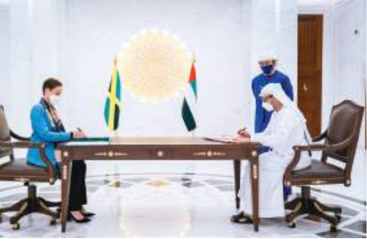
عبدالله بن زايد خلال حضوره التوقيع على مذكرة التفاهم بين الإمارات وجامايكا