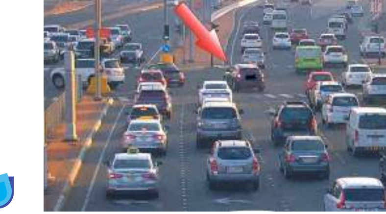
أبو ظبي - الوحدة:

دعت شرطة أبوظبي السائقين إلى ضرورة الالتزام بخط السير الإلزامي عند التقاطعات سواء كانت منظمة بإشارات ضوئية أو غيرها من التقاطعات التي تلزم السائقين عند عبورها الالتزام بخط سير محدد، موضحة أنها بدأت بتفعيل الضبط الآلي للسائقين الغير ملتزمين بخط السير الإلزامي في التقاطعات.