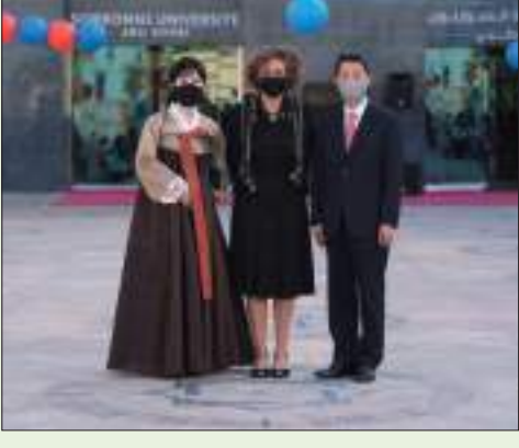
أبو ظبي - الوحدة:

بالتعاون مع سفارة جمهورية كوريا في دولة الإمارات العربية المتحدة والمركز الثقافي الكوري، احتفلت جامعة السوربون أبوظبي برأس السنة الكورية وذلك من خلال إقامة العديد من الأنشطة والفعاليات الثقافية في الحرم الجامعي. أتى هذا الحفل في إطار جهود جامعة السوربون أبوظبي المبذولة لإثراء التجربة الطلابية من خلال إقامة احتفالات وعروض ثقافية وتعزيز مبادئ أساسية كالتنوع الثقافي والشمولية.