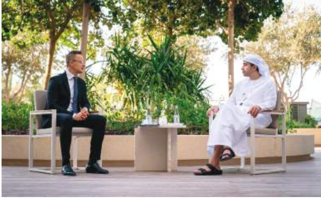
عبدالله بن زايد خلال استقباله وزير خارجية المجر في إكسبو ٢٠٢٠

وشهد سموه التوقيع على مذكرة تفاهم بين وزارة الطاقة والبنية التحتية ووزارة الداخلية بدولة المجر في مجال إدارة موارد المياه. وقع مذكرة التفاهم معالي سهيل بن محمد فرج فارس المزروعى وزير الطاقة والبنية التحتية ومعالي بيتر سيارتو وزير الشؤون الخارجية والتجارة بجمهورية المجر.