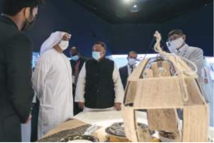
سيف بن زايد خلال لقائه وزير داخلية بنجلاديش في «إكسبو»