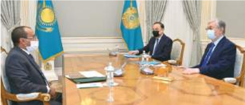
رئيس كازاخستان خلال استقباله سفير الإمارات