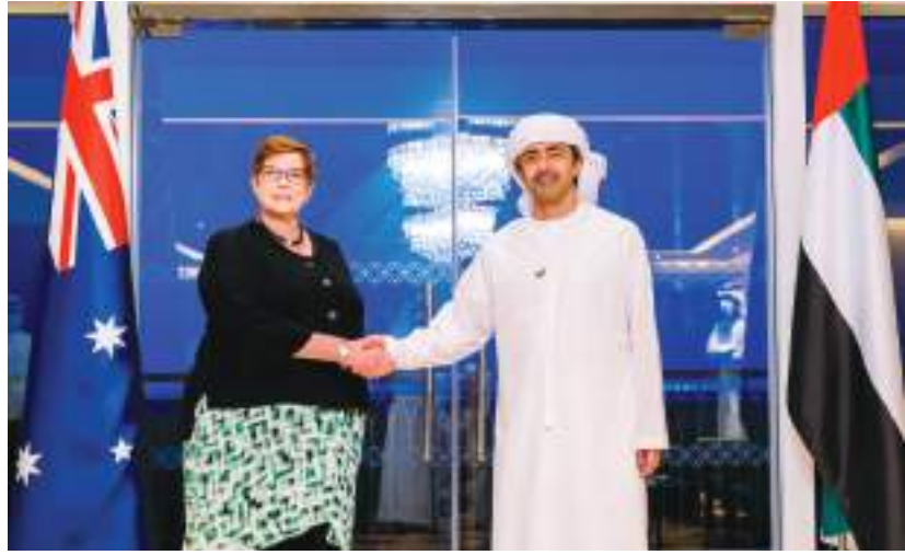
عبدالله بن زايد خلال استقباله وزيرة خارجية أستراليا