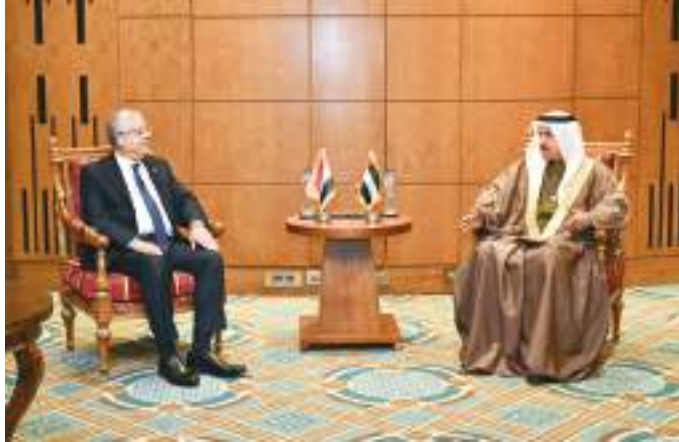
صقر غباش خلال مباحثاته مع رئيس مجلس النواب المصري

الدكتور حنفي الجبالي بزيارة معالي صقر غباش وأعضاء الوفد لجمهورية مصر العربية وإقامة المؤتمر الثاني والثلاثين للاتحاد البرلماني العربي في القاهرة. وأشاد معاليه بزيارته مؤخرا لدولة الإمارات وحجم الإنجازات والتطور الذي شهده على أرض دولة الإمارات وإهتمامها بالإنسان وتنميته، كل ذلك بفضل القيادة الرشيدة التي استطاعت نقل دولة الإمارات إلى مكانة متميزة يشار إليها بالبنان على مستوى العالم ودورها الملهم في تشجيع الابتكار والإبداع ومواكبة التطورات والتحديات الحديثة. كما أشاد في هذا السياق بإكسبو ٢٠٢٠ دبي الذي تشارك به ١٩٥ دولة.