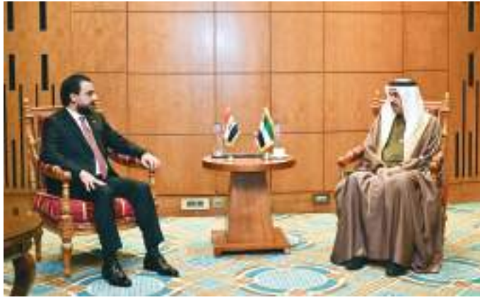
صقر غباش خلال مباحثاته مع رئيس مجلس النواب العراقي

التاريخية بين البلدين والشعبين الشقيقين وناقش الجانبان عددا من القضايا ذات الاهتمام المشترك والتي من أبرزها تطوير وتفعيل الدبلوماسية البرلمانية وأهمية تنسيق وتوحيد المواقف والتشاور خلال المشاركة في الفعاليات البرلمانية الدولية من خلال الدبلوماسية البرلمانية. من جانبه أعرب محمد الحلبوسي عن خالص شكره لمعالي صقر غباش على حفاوة الاستقبال وعلى التنظيم المتميز للمؤتمر الثاني والثلاثين للاتحاد البرلماني العربي، مؤكدا حرص بلاده على تعزيز مختلف العلاقات الثنائية مع دولة الإمارات في المجالات كافة خاصة منها البرلمانية. وجدد معالي محمد الحلبوسي إدانته للاعتداءات الإرهابية لميليشيات الحوثي على منشآت مدنية داخل دولة الإمارات، معربا عن تأييده الكامل لدولة الإمارات.