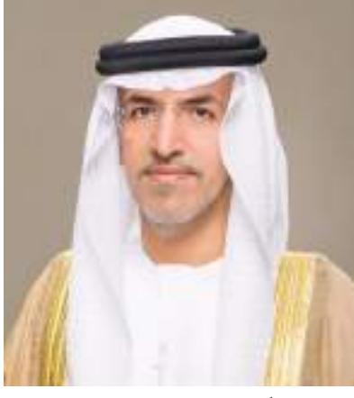
مغير خميس الخيلي

أكد معالي الدكتور مغير خميس الخيلي رئيس دائرة تنمية المجتمع في أبوظبي أن استمرار طواف الإمارات بإقامة النسخة الرابعة، دليل على النجاحات التي حققها في الأعوام الماضية، والتي تعكس ثقة المنظمات والاتحادات الدولية في مكانة وقيمة دولة الإمارات في تنظيم الفعاليات الرياضية العالمية بمنتهى الاحترافية، رغم الظروف التي مر بها العالم بسبب جائحة كورونا، ونجحت فيها الإمارات في تخطيها والتعامل معها بأعلى معايير السلامة والوقاية. وأشار معاليه إلى أن النسخة الرابعة من طواف الإمارات تؤكد مكانة الدولة، وتعد استكمالاً للنجاحات التي حققتها النسخ الثلاث الأولى للطواف، وسط مشاركة نخبة من أبرز دراجي العالم والفرق المحترفة. وقال « الإمارات نجحت من خلال ما قدمته في السنوات الماضية على تأكيد جدارتها ومكانتها المرموقة في استضافة كبرى الفعاليات الرياضية، ومن ضمنها طواف الإمارات الذي أصبح واحدا من الأحداث الرئيسية على الأجنحة العالمية لسباقات الاتحاد الدولي للدراجات الهوائية، وبأكورة سباقات موسم ٢٠٢٢». وأرجع الخيلي تلك النجاحات للدعم اللا محدود من القيادة الرشيدة لمختلف المجالات والقطاعات ومنها القطاع الرياضي، مشيراً إلى أن الطواف نجح في ترسيخ العديد من الأنس الرياضية النبيلة التي يحتاج إليها المجتمع بكامل فئاته حتى أصبحت تتفاعل مع مثل هذه الأحداث الراقية الهادفة إلى غرس القيم السامية في نفوس كافة المتواجدين على أرض الإمارات، التي أبهرت العالم بحضارتها وتقدمها وتميزها في كل المجالات.