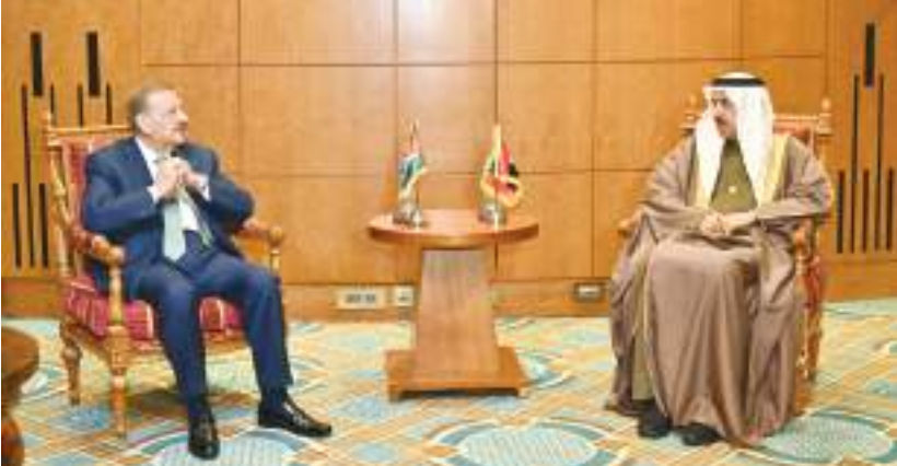
صقر غباش خلال مباحثاته مع رئيس مجلس النواب الأردني