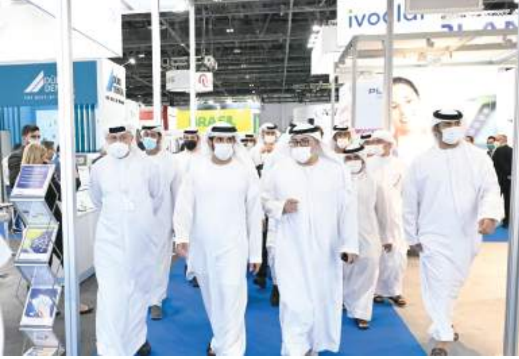
حمدان بن محمد خلال تفقده المعرض