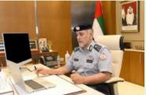
أبوظبي - الوحدة:

افتتح معالي اللواء ركن طيار فارس خلف المزروعى قائد عام شرطة أبوظبي بحضور سعادة اللواء مكتوم على الشريفى مدير عام شرطة أبوظبي فعاليات المشاركة ضمن فعالية «الإمارات تبتكر 2022» التي تحتفي بالابتكار في كافة إمارات الدولة، وترسيخ ثقافة الابتكار لدعم توجهات دولة الإمارات في الخمسين عاماً المقبلة.