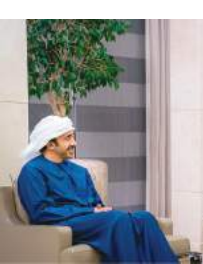
عبدالله بن زايد خلال استقباله وزير الدولة البريطاني لشؤون الشرق الأوسط