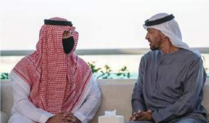
محمد بن زايد خلال استقباله وزير الداخلية السعودي

وأوضح أن الندوة تستهدف توفير منصة تفاعلية لنقل المعرفة وبناء القدرات للمعنيين بالقطاع لزيادة فاعلية الفواء بالمهام والمسؤوليات المرتبطة بمكافحة تطور المخاطر البيولوجية بأنواعها مؤكداً أهمية إقامة شراكات متعددة القطاعات والتحديث المستمر لتطبيقات الأمن والسلامة الحيوية.