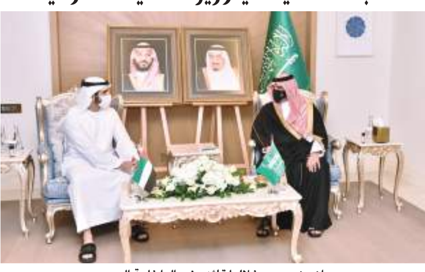
حمدان بن محمد خلال لقائه وزير الداخلية السعودي