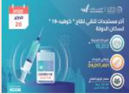
أبو ظبي- وام :

أعلنت وزارة الصحة ووقاية المجتمع عن تقديم ١٨,٣١٣ جرعة من لقاح «كوفيد-١٩» خلال الساعات الـ ٢٤ الماضية وبذلك يبلغ مجموع الجرعات التي تم تقديمها حتى اليوم ٢٤,٠١٧,٤٥١ جرعة ومعدل توزيع اللقاح ٢٤٢,٨٤ جرعة لكل ١٠٠ شخص. يأتي ذلك تماشياً مع خطة الوزارة لتوفير لقاح كوفيد-١٩ وسعيها إلى الوصول إلى المناعة المكتسبة الناتجة عن التطعيم والتي ستساعد في تقليل أعداد الحالات والسيطرة على فيروس كوفيد-١٩.