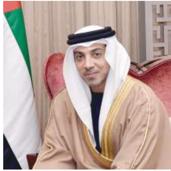
أبوظبي-وام: أصدر سمو الشيخ منصور بن زايد آل نهيان، نائب رئيس مجلس الوزراء، وزير شؤون الرئاسة، رئيس دائرة القضاء في أبوظبي، قرارات بمنح صفة الضبطية القضائية لـ ٧٨ من مأموري الضبط القضائي في ٣ دوائر حكومية في إمارة أبوظبي، تشمل التنمية الاقتصادية، البلديات والنقل، والثقافة والسياحة، وذلك بما يمنح المفتشين المختصين صلاحية مزاولة مهام الضبط القضائي بالنسبة للجرائم والمخالفات الإدارية التي تقع في دائرة اختصاصهم، وتكون متعلقة بأعمال وظائفهم وفق التشريعات السارية.

وأشار إلى اهتمام دائرة القضاء في أبوظبي، بتأهيل وتدريب المرشحين للحصول على صفة الضبطية القضائية، من خلال برامج تدريبية متخصصة لدى أكاديمية أبوظبي القضائية، وذلك في المقر الرئيس لدائرة القضاء في أبوظبي. وأكد المستشار علي البلوشي، أن منح صفة الضبطية القضائية لعدد من موظفي الدوائر الحكومية، لبدء ممارسة مهامهم في التفتيش والرقابة بحسب اختصاصاتهم الوظيفية، مع ضمان التطبيق الصحيح للقانون وتنفيذ الإجراءات الخاصة بعمليات الضبط والتدقيق وفق الضوابط القانونية المحددة، يسهم في تطوير الأداء المؤسسي والارتقاء بنوعية الخدمات المقدمة في مختلف القطاعات بإمارة أبوظبي، بما يعزز تنافسيتها عالمياً.