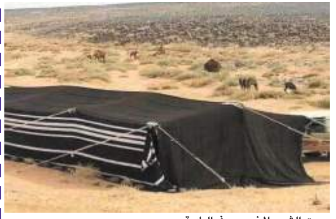
بيت الشعر المخوس في البادية