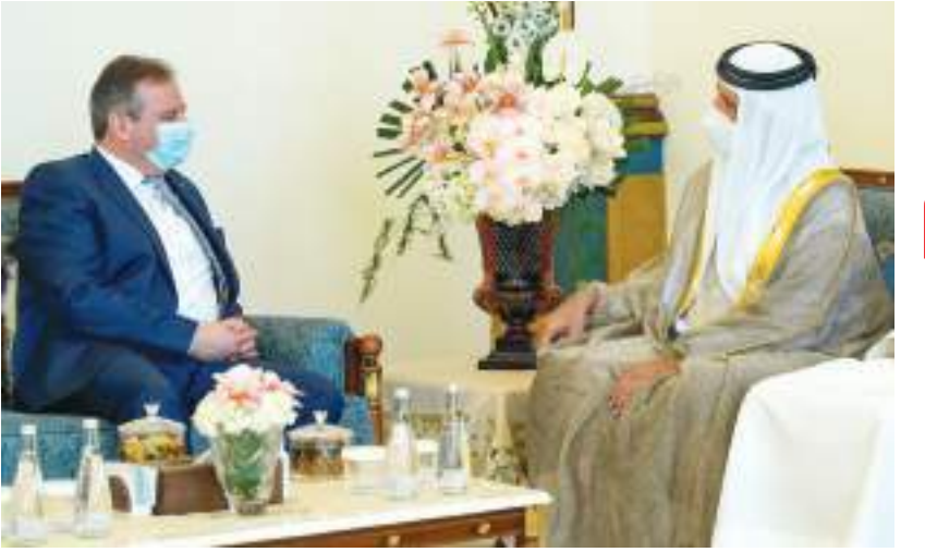
حاكم رأس الخيمة خلال استقباله السفير الألماني