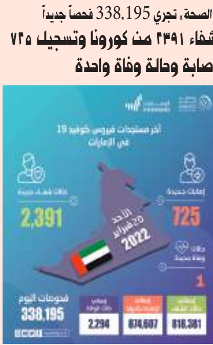
أبو ظبي- وام :

في مجالات البحث والتطوير والابتكار في مختلف القطاعات بما يخدم مصالح البلدين وشعبيهما الصديقين. حضر اللقاء .. سمو الشيخ هزاع آل نهيان نائب رئيس المجلس التنفيذي لإمارة أبوظبي وسمو الشيخ حمدان بن محمد بن زايد آل نهيان ومعالي الشيخ محمد بن حمد بن طحون آل نهيان مستشار الشؤون الخاصة في وزارة شؤون الرئاسة ومعالي أحمد بن علي محمد الصايغ وزير دولة وسعادة سعيد عبدالله القمزي سفير الدولة غير المقيم لدى الأوروغواي الشرقية وعدد من المسؤولين.