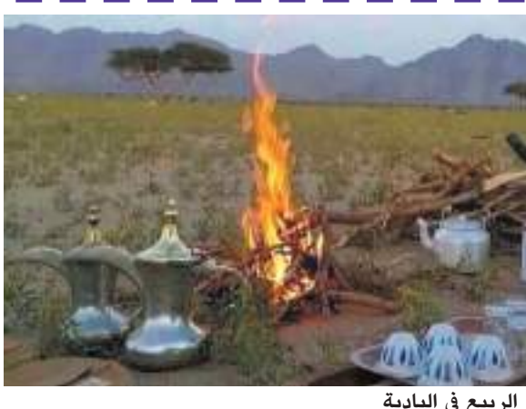
الربيع في البادية

هذا في ديره ماهيب ديره. ديار غرب مالي بها أحد يسال عن احوالي ويهتم بموضوعه. لا أخوال ولا أعمام هنا أقول في غيبتك رافقت من يسهرون الليل الذين هم زي حالتي مساجين وكالعادة السجين. ماله الا التوجد والأنين والأمل ..وأين مكان السجن