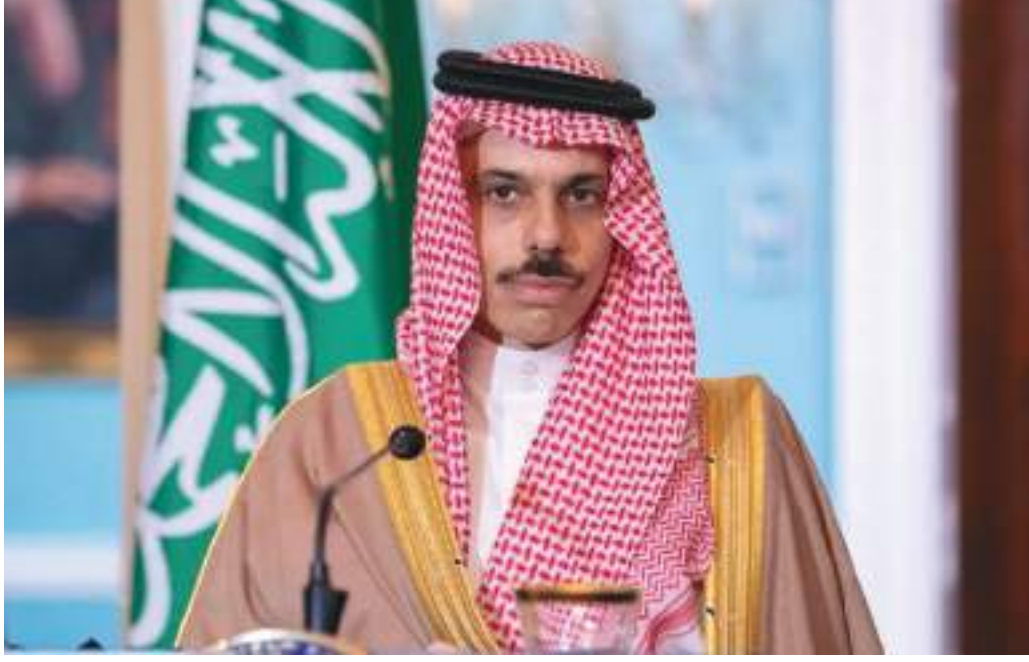
المنشآت والأعيان المدنية. وأكد وزير الخارجية السعودي أن تحالف دعم الشرعية في اليمن هدفه حماية ودعم الأمن والاشتراكية لليمن وحكومة اليمن هدفه حماية ودعم الأمن والاشتراكية للشعب والشريعة.

أكد وزير الخارجية السعودي لأمير فيصل بن فرحان، أن بلاده تدعم كافة الجهود الدولية بهدف ضمان أمن واستقرار منطقة الشرق الأوسط والعالم، وأنها تعمل مع الشركاء الدوليين لإنهاء الأزمة اليمنية عبر وقف شامل لإطلاق النار، والتوصل إلى حل سياسي بالحوار الجاد بين جميع الأطراف اليمنية، حسبما أفادت وكالة الأنباء السعودية (واس).