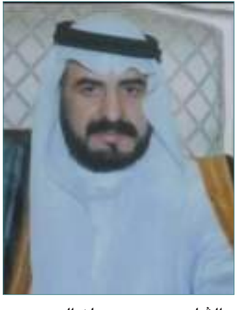
الشاعر محمد سوعان الربيع