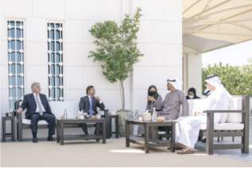
محمد بن زايد خلال استقباله رئيس الأوروغواي