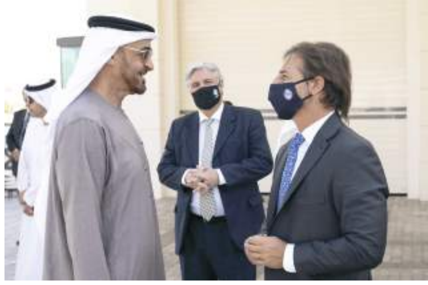
أبو ظبي- وام :

لا كاي بو .. وبحث معه العلاقات الثنائية بين دولة الإمارات والأوروغواي الشرقية وسبل تعزيزها وتوسيع أفاقها في مختلف المجالات بما يخدم أهداف التنمية في البلدين الصديقين .. إضافة إلى عدد من القضايا الإقليمية والدولية محل الاهتمام المشترك. كما تطرق اللقاء إلى أهمية « معرض إكسبو ٢٠٢٠ دبي » والنجاح الذي حققه خلال الشهور الماضية في تعزيز الحوار العالمي حول صناعة مستقبل أفضل للبشرية إضافة إلى مشاركة الأوروغواي في المعرض وأهميتها في التعريف بها وثقافتها ورؤيتها التنموية