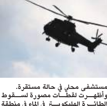
مروحية قرب شاطئ مزدحم في أمريكا

تجري وكالات اتحادية تحقيقاً في حادث سقوط طائرة هليكوبتر تقل ثلاثة ركاب وتحطمها في المحيط الأطلسي قرب رواد شاطئ في ميامي بيتش بولاية فلوريدا الأمريكية . وقالت إدارة الطيران الاتحادية إن الطائرة سقطت في المحيط قرب شاطئ مزدحم في الساعة 1:20 مساءً بالتوقيت المحلي، وتحقق الوكالة في سبب الحادث مع المجلس الوطني لسلامة النقل. وهرعت شرطة ميامي بيتش وإدارات الإطفاء إلى مكان الحادث، وقالت، على «تويتر»، إن اثنين من الركاب نُقلوا إلى