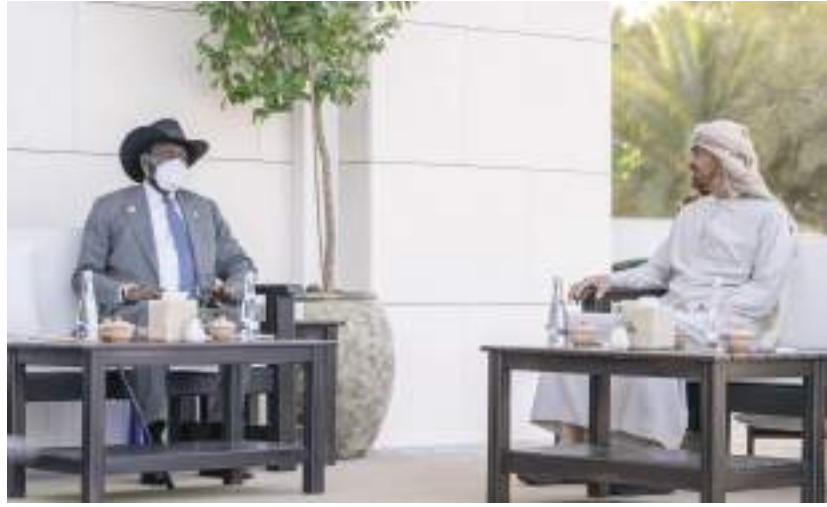
محمد بن زايد خلال استقباله رئيس جنوب السودان