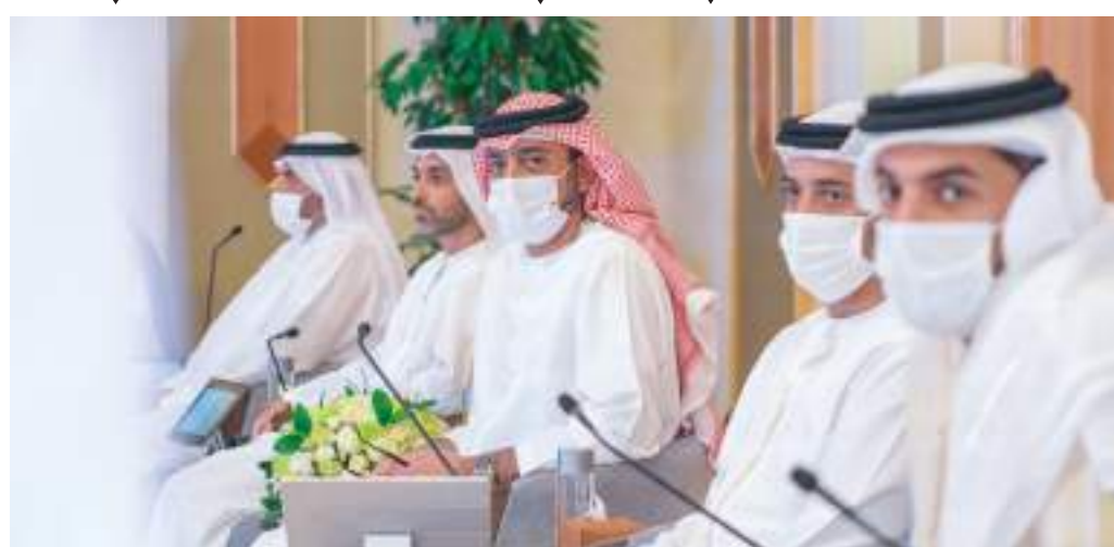
عمار النعيمي خلال ترؤسه جلسة المجلس التنفيذي لإمارة عجمان

واطلع سمو الشيخ عمار بن حميد النعيمي خلال الجلسة على تقرير مؤشر جاهزية الصناعة الذكية وتقارير أفضل المدن ملائمة للعيش لعام ٢٠٢١ كما ناقشت الجلسة عددا من التقارير متابعة تحديات العيش وإجراءاتها وآليات ضبط المواصفات واشتراطات السلامة على الحافلات المدرسية ومتابعة المستجبات والتقدم المحرز في دراسة تتبع الأعمال، واستعرضت الجلسة الثانية تقرير «مؤشر جاهزية الصناعة الذكية» والذي يأتي ضمن مبادرات الدولة الخمسين لتعزيز استراتيجية الدولة الصناعية وتبني حلول الثورة الصناعية الرابعة على المستوى الوطني ووضع خارطة طريق دقيقة ومخصصة لاعتماد التقنيات التي تتناسب مع قدرات المنشآت الاقتصادية بـ دف زيادة الإنتاجية الصناعية بنسبة ٣٠٪ وإضافة ٢٥ مليار در م إلى الناتج المحلي الإجمالي في الدولة خلال السنوات العشر المقبلة حيث بلغت حصة الصناعة التحويلية في إمارة عجمان من إجمالي الاستثمار