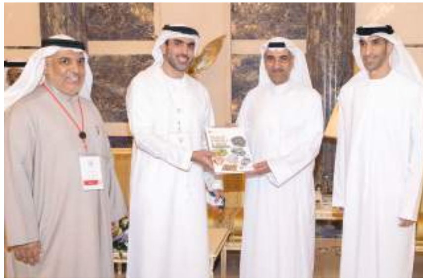
حاكم الفجيرة خلال استقباله ضيوف «مؤتمر الثروة المعدنية» ..

ويأتي الاستقبال على هامش افتتاح أعمال المؤتمر العربي الدولي للثروة المعدنية الذي يقام تحت رعاية صاحب السمو رئيس الدولة،