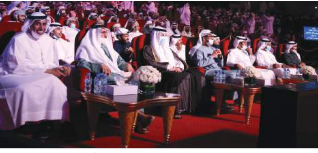
أبوظبيجا - وام :

انطلقت مساء الثلاثاء الأمسية المباشرة الثانية عشرة من برنامج شاعر المليون بموسمه العاشر، الذي تنتجه لجنة إدارة المهرجانات والبرامج الثقافية والتراثية بأبوظبي. وشهد مسرح شاطئ الراحة منافسات وتحدي بين الشعراء الذي قدموا قصائد مميزة، أمام الجمهور والمشاهدين عبر شاشات قناتي بيثونة والإمارات وتطبيق البرنامج.