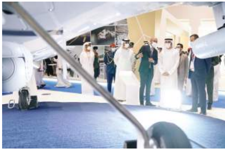
حمدان بن محمد خلال زيارته معرضي «يومكس» و «سيمتكس»

واستمع سمو ولي عهد دبي خلال الزيارة إلى شرح تناول التطور الذي شهده المعرض على مدار دوراته الأربع الماضية، حيث تشارك في الدورة الخامسة ١٣٤ شركة من ٢٦ دولة، منها سبع دول تشارك للمرة الأولى، مع زيادة مساحة المعرض بنحو ٢٥٪، ما يعكس نجاح الحدث في استقطاب الشركات العالمية المتخصصة في مجالات الأنظمة غير المأهولة والمحاكاة، والتدريب والذكاء الاصطناعي، بالإضافة إلى الروبوتات والأنظمة ذات الاستخدامات المتعددة