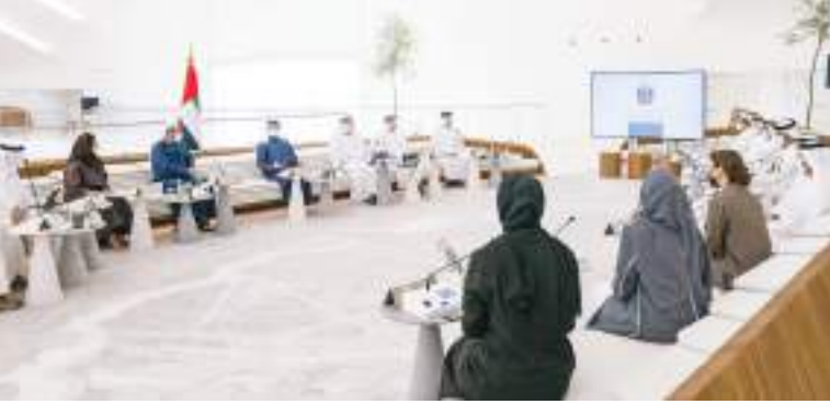
منصور بن زايد خلال ترؤسه الاجتماع

كما تمت مناقشة اللائحة التنفيذية للمسوم بقانون اتحادي في شأن العلامات التجارية من أجل الحفاظ على التوازن بين الحماية الفعالة لحقوق مالكي العلامات التجارية والمستهلكين وبين المصلحة العامة، والإسهام في رفع مرتبة الدولة في مؤشر الابتكار