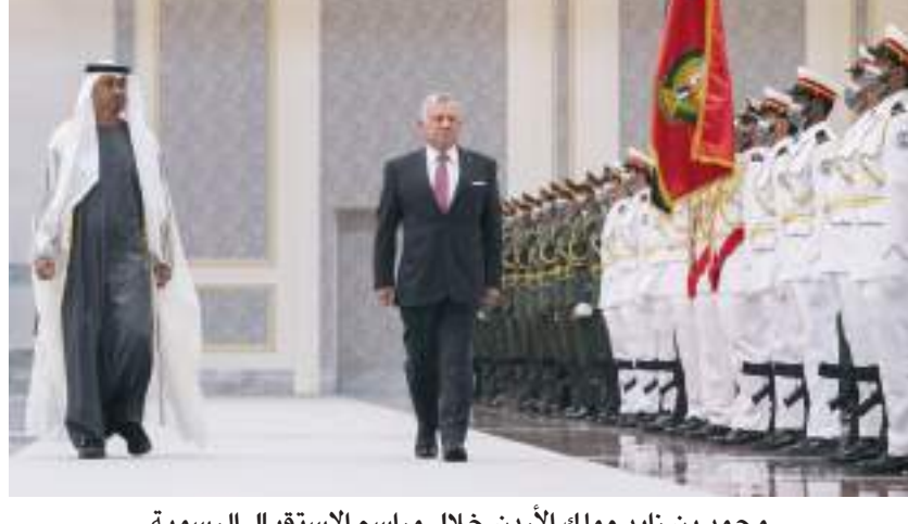
محمد بن زايد وملك الأردن خلال مراسم الاستقبال الرسمية

أبوظبي-وام: وصل جلالة الملك عبدالله الثاني ابن الحسين عاهل المملكة الأردنية الهاشمية الشقيقة إلى البلاد يوم الجمعة في زيارة رسمية إلى الدولة ترافقه قرينته الملكة رانيا العبدالله. وكان صاحب السمو الشيخ محمد بن زايد آل نهيان ولي عهد أبوظبي نائب القائد الأعلى للقوات المسلحة في مقدمة مستقبلي جلالتهم لدى وصوله والوفد المرافق مطار الرئاسة في أبوظبي، وجررت لضيف البلاد مراسم استقبال رسمية حيث اصطحب صاحب السمو الشيخ محمد بن زايد آل نهيان جلالة الملك عبدالله الثاني إلى منصة الشرف وعزف السلام الوطني لكل من دولة الإمارات والمملكة الأردنية الهاشمية فيما اصطفت ثلثة من حرس الشرف تحية لجلالته وترحبيا بالزيارة.