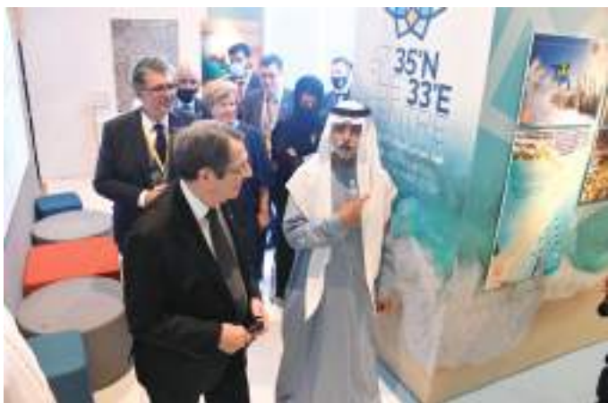
الرئيس القبرصي ونهيان بن مبارك في إكسبو

الصداقة والاحترام المتبادل و تنتقل إلى استكشاف فرص لمزيد من التعاون بلدينا كالتعليم والتبادل الثقافي بما يؤسس لعلاقات راسخة ودائمة بين الشعبين الإماراتي والقبرصي.»