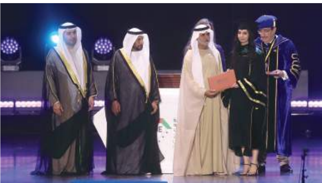
نهيان بن مبارك خلال حضوره حفل التخرج

فإننا على ثقة بتحملهم مسؤولية القيادة على الوجه الأكمل، وننعه باستمرار الجامعة الأمريكية في الإمارات، في تطبيق أفضل المعايير والخبرات العالمية، من الناحية الأكاديمية والإدارية، وتوفير بيئة ملائمة لطلبتنا، كي يبلغوا التميز والنجاح... مؤكداً أن الجامعة فخورة بنجاحها مع إكسبو ٢٠٢٠ دبي، لإقامة هذا الحدث في ساحة البويعيل، واختتمت احتفالية تكريم الدفاتر الثلاث، بإقامة حفل فني غنائي تقديراً للخرجين نظمته الجامعة بالتعاون مع إكسبو دبي ٢٠٢٠ وشهدت أجواء رائعة أدخلت البهجة والسرور على قلوب الطلاب ودويعهم، والحضور.