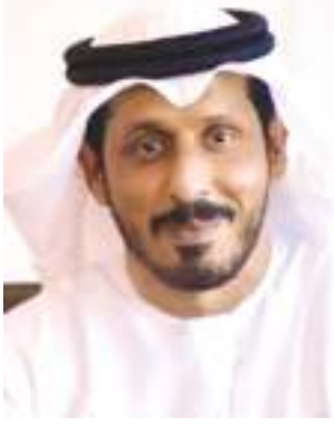
إن اعتراف مؤسسة عريقة مثل صندوق النقد الدولي بجهودنا

الإمارات المركزي لجهودها الرامية إلى "تفعيل إطار إشرافي جديد قائم على تقييم وتحليل المخاطر". و أشاد التقرير الذي تم نشره في 17 فبراير الجاري أيضا بترحيب رؤساء الجهات والمؤسسات ذات الصلة بالتقدم المحرز في مجال مواجهة غسل الأموال وتمويل الإرهاب، وتشجيعهم للسلطات المحلية على الحفاظ على معدلات الإصلاح والتقدم الذي تم إحراره في تعزيز تدابير مكافحة غسل الأموال وتمويل الإرهاب".