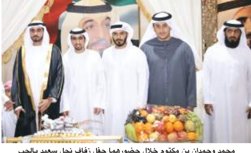
محمد وحمدان بن مكتوم خلال حضورهما حفل زفاف نجل سعيد بالحب

دبي-وام: حضر الشيخ محمد بن مكتوم بن راشد آل مكتوم والشيخ حمدان بن مكتوم بن راشد آل مكتوم حفل الاستقبال الذي أقامته عائلة المرحوم سعيد بالحب العامري بمناسبة زفاف نجلهم مطر إلى كريمة سعيد سلطان بن مرخان.