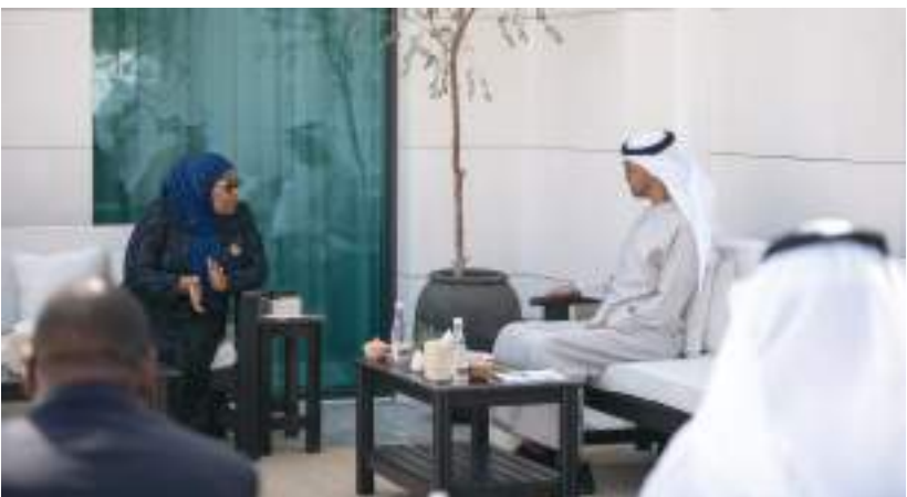
محمد بن زايد خلال استقباله رئيسة تنزانيا