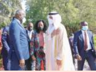
رأس الخيمة- وام:

استقبل صاحب السمو الشيخ سعود بن صقر القاسمي عضو المجلس الأعلى حاكم رأس الخيمة، في قصر سموه بمدينة صقر بن محمد، معالي أناتول كولينييه ماكوسو، رئيس وزراء جمهورية الكونغو، الذي يقوم بزيارة رسمية للبلاد، يرافقه وفد رفيع المستوى.