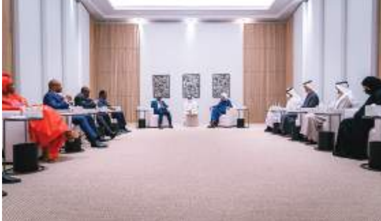
عبدالله بن زايد خلال لقائه رئيس وزراء الكونغو في أكسبو دبي

حضر اللقاء معالي الشيخ شخبوط بن نهيان بن مبارك آل نهيان وزير دولة.