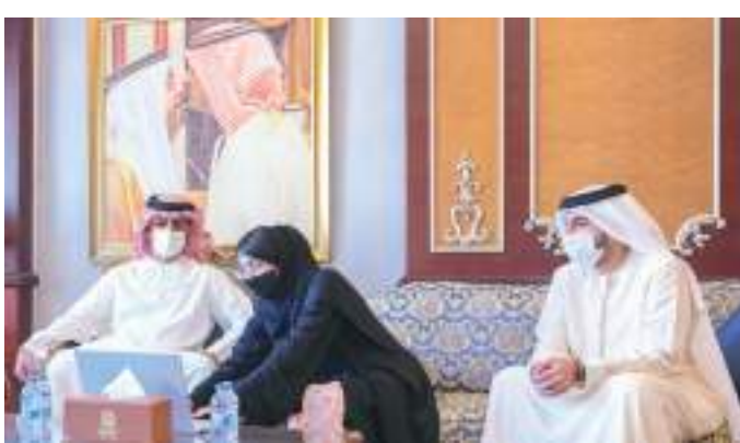
ولي عهد عجمان خلال لقائه سعيد سيف المطروشي

وفي نهاية الاجتماع، قدم سمو الشيخ عمار بن حميد النعيمي ولي عهد عجمان رئيس المجلس التنفيذي جزييل شكره وتقديره لفريق العمل من موظفي مركز عجمان للإحصاء والتنافسية على جهودهم الطيبة وتفانيهم بالعمل ومساهماتهم الفعالة من أجل انجاز هذا العمل الرائع. وأثنى سموه على تعاون جميع الجهات الحكومية المحلية والمستقلة وجميع السكان بالامارة على مساهمتهم الفعالة في إنجاز وانجاح هذا المشروع الحيوي وهو ما سيعود بالنفع العام على الفرد والمجتمع وحث سموه جميع الأسر الجديدة للتسجيل في منصة العد الذاتي وتحديث بياناتها بشكل دوري.