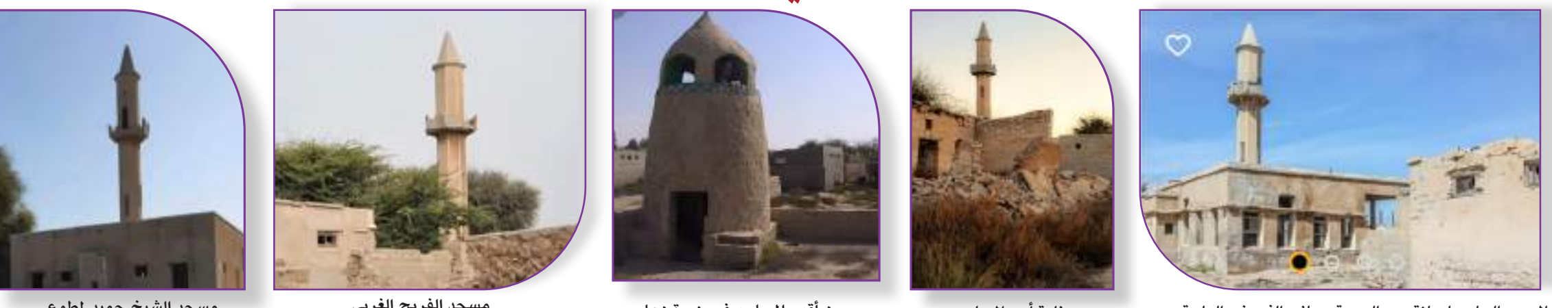
مسجد الشيخ حميد لمطوع مسجد الفريج الغربي من أقدم المساجد في جزيرة زعاب منارة أحد المساجد المسجد الجامع لصلاة يوم الجمعة بجانب الفروض العادية

*على مر العصور شكلت المساجد منارة العلم والتشريع والتاريخ والأصل والتراث، فتاريخ بنائها يمتد إلى ظهور الإسلام، وفي الإمارات يؤكد الباحثون أن عدداً من المساجد قد بنيت على امتداد سواحلها، منها ما لم يبق من آثارها ما يذكر، كما أن بعضها ما زالت ساقطة بماذنها بعد أن رُممت ولقيت كل العناية والاهتمام من المؤسسات المعنية، ويعتبرها الباحثون من أهم النقاط في سلسلة تاريخ المساجد الإسلامية في شرق شبه الجزيرة العربية. وفي جزيرة زعاب في رأس الخيمة هناك الكثير من المساجد الأثرية القديمة في أحيائها الشعبية المعروفة والتي كانت عامرة بأهلها الذين يجمعهم الحب والتآلف والتراحم وصلته القرى والقبيلة الواحدة. وكانت هناك ستة مساجد تقام فيها صلاة الجمعة. ويوم الجمعة يوم عظيم مبارك هدى الله المسلمين إليه ليكون يوم عبادة وقربى إلى الله ويوم تواصل ومودة ومحبة وصفاء بين المسلمين جميعاً.