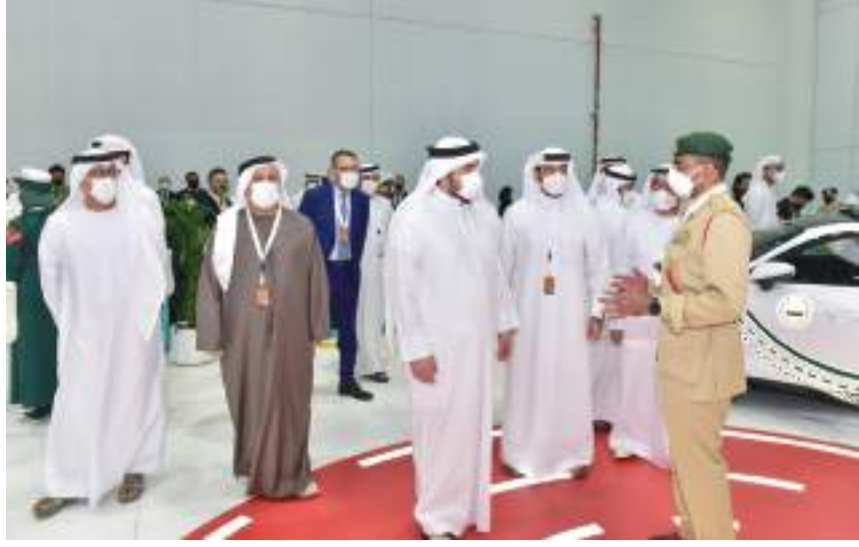
أحمد بن محمد خلال تفقده معرض النقل لمنطقة الشرق الأوسط وشمال أفريقيا

شهد صاحب السمو الشيخ سعود بن صقر القاسمي عضو المجلس الأعلى حاكم رأس الخيمة يوم الأحد ختام «بطولة رأس الخيمة للجولف» جولة» بي بي ورلد» التي استضافتها الإمارة على مدى أربعة أيام في «نادي الحمرا للجولف» بمشاركة نخبة من أفضل اللاعبين على مستوى العالم.