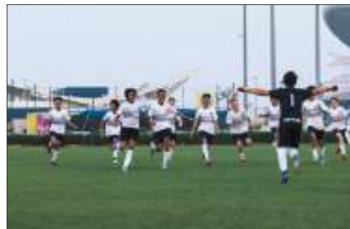
أبوظبي - الوحدة :

احتفت دائرة التعليم والمعرفة في أبوظبي بقيم الروح الرياضية والعمل كفريق والتنافسية الودية بين نحو 1,000 طالب وطالبة من عشاق كرة القدم المشاركين في مباريات التصفيات التأهيلية كأس الألعاب الرياضية، والتي استضافها أبو ظبي للكريكت يومي السبت والأحد الماضيين.