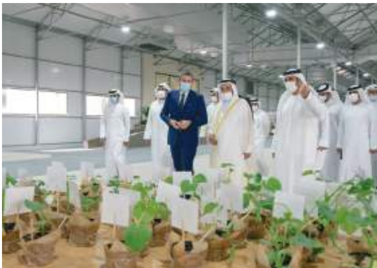
حاكم الشارقة خلال تفقده مشروع الصوبات الزراعية بمدينة الذيد

أما برنامج الأغذية العالمي التابع للأمم المتحدة فواصل بعمليات التوزيع ضمن الحملة إلى الأقل حظاً واللاجئين والنازحين، موزعاً ما يعادل ٥٦ مليون وجبة في مختلف المناطق ومخيمات اللجوء والنزوح التي عمل فيها مع