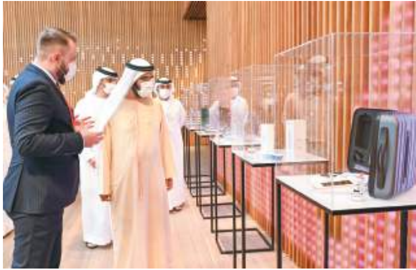
محمد بن راشد خلال لقائه رئيس وزراء ألبانيا في جناح بلاده في إكسبو

التقى صاحب السمو الشيخ محمد بن راشد آل مكتوم نائب رئيس الدولة رئيس مجلس الوزراء حاكم دبي «رعاه الله»، معالي إيدي الذي يزور الدولة حاليا لحضور احتفالات بلاده باليوم الوطني في «إكسبو ٢٠٢٠ دبي». ورحب صاحب السمو نائب رئيس الدولة رئيس مجلس الوزراء حاكم دبي، رعاه الله، بمعالي رئيس الوزراء الألباني، مؤكدا حرص دولة الإمارات على توسيع علاقات التعاون مع مختلف الدول الشقيقة والصديقة، وأشاد سموه بالمستوى الذي وصلت إليه العلاقات التي تجمع البلدين، وما تشهده من تطور ونمو مستمر، ما يعكس الحرص المشترك على توثيق الروابط الثنائية واكتشاف سبل توطيدها وتوسيع نطاقها خلال المرحلة المقبلة. عبر معالي إيدي راما عن سعادته بزيارة دولة الإمارات ولقاء صاحب السمو الشيخ محمد بن راشد آل مكتوم، مؤكدا رغبة بلاده في تعزيز التعاون بين البلدين وفتح العلاقات الثنائية إلى آفاق أرحب وبما يحقق مصالح الدولتين والشعبين الصديقين. وأشاد معاليه بالتنظيم المتميز للدورة