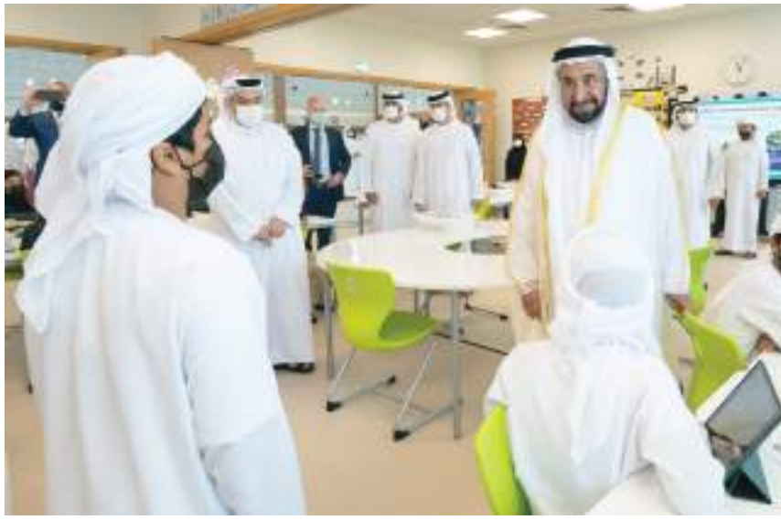
حاكم الشارقة خلال جولته في المدرسة