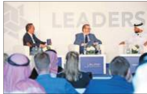
أبوظبي - وام:

تنطلق أعمال قمة القيادات الرياضية العالمية "ليدرز"، في نسختها الجديدة، من أبوظبي يومي 16 و 17 مارس الجاري، بتنظيم مجلس أبوظبي الرياضي، بالتعاون مع "ليدرز"، بمركز المؤتمرات في حلبة مرسى ياس، حيث تستعد القمة لاستقبال قادة الرياضة العالميين لمناقشة آخر المستجدات في المشهد الرياضي العالمي.