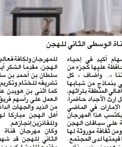
سلطان بن أحمد القاسمي خلال تكريم الفائزين بجوائز مهرجان قناة الوسطى الثاني للهجن

ومنتطقة البطائح، بالإضافة إلى مجلس أولياء أمور الطلبة والطالبات في المنطقة الوسطى، ونادي الشارقة لسباقات الهجن، ومجلس الشارقة الرياضي، وإدارة شرطة المنطقة الوسطى، وإدارة الدفاع المدني في المنطقة الوسطى، ومدينة الشارقة للإعلام «شمس».. وكان سموه قد تابع جانباً من الأشواط المسائية لليوم الختامي من الأشواط الثانية بشفرة استضافة مؤتمر الدول نسخة الثانية للمهرجان، التي شهدت منافسة قوية بين كافة المشاركين، وفي كلمة القاها بمناسبة اختتام المهرجان أكد سعيد الكتبي، مدير قناة الوسطى من النيد، أن مسابقة صاحب القاسمي عضو الدكتور سلطان بن محمد القاسمي رئيس المجلس الأعلى حاكم الشارقة بإطلاق هذا