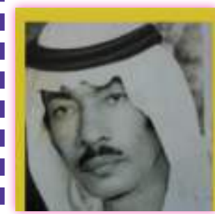
الشاعر الراحل محمد إسماعيل بالرافضة الزعابي

*كتبنا بالجزء الأول عن مجموعة من المبدعين في إمارة رأس الخيمة واليوم نضيف اليوم مجموعة أخرى من المبدعين في الجزء الثاني وهكذا هي إمارة رأس الخيمة أم المواهب والمبدعين والمبتكرين . هم الذين تنفسوا هواء البحر وخاضوا على أعقاب أمواجه وتربوا على رمل الشواطئ التي شهدت ملامح الغوص والصيد في عصر الآباء والأجداد حتى واكبوا تطور الحياة شيئا فشيئا. لم يكن الساحل وحده يزخر بالمبدعين بل كان للصحراء بروز آخر من المواهب والمبدعين الذين كان لهم أثر كبير في الماضي والحاضر .