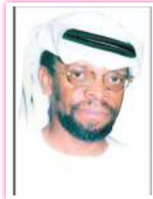
الشاعر الراحل جمعة الفيروز