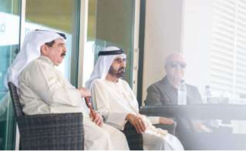
محمد بن راشد خلال لقائه ملك البحرين

الأربعة وهي كأس السيدات وسباق الإسطبلات الخاصة وكأس «جميلتي» للأفراس وكأس صاحب السمو الشيخ محمد بن راشد آل مكتوم للقدرة مسك ختام المهرجان.