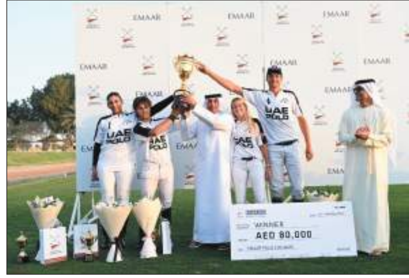
دبجيا - الوحدة: