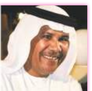
الفنان الكوميدي جابر نغموش