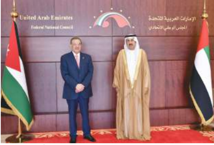
صقر غباش خلال مباحثاته مع رئيس مجلس النواب الأردني

الأخوية التي تجمع دولة الإمارات العربية المتحدة والمملكة الأردنية الهاشمية تحت القيادة الرشيدة لصاحب السمو الشيخ خليفة بن زايد آل نهيان رئيس الدولة «حفظه الله» والملك عبدالله الثاني، ملك المملكة الأردنية الهاشمية، الشقيقة موضعاً أن هذه العلاقات تعد نموذجاً يحتذى في بناء العلاقات العربية والتضامن الأخوي الصادق.