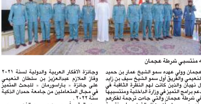
عمار النعيمي خلال استقباله منتسبي شرطة عجمان