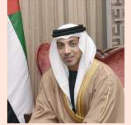
منصور بن زايد

منصور بن زايد يمنح «الضبطية القضائية» لـ ١٢٧ من اختصاصيي حماية الطفل في أبوظبي