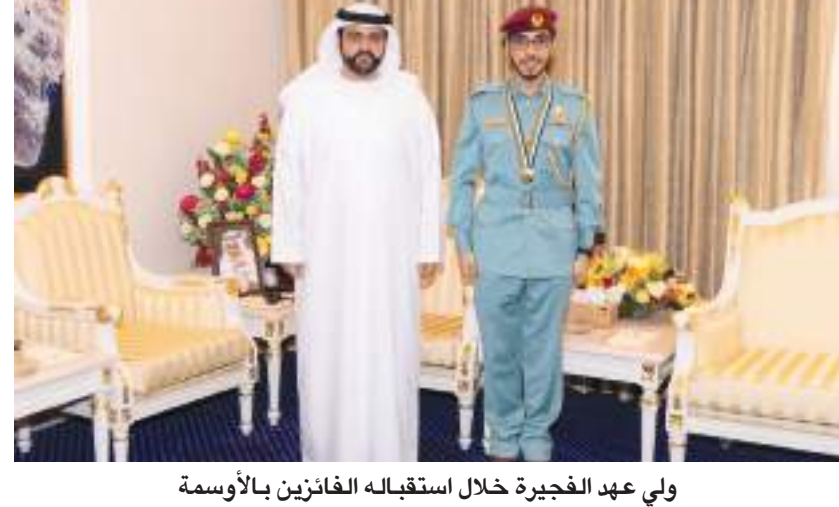
ولي عهد الفجيرة خلال استقباله الفائزين بالأوسمة