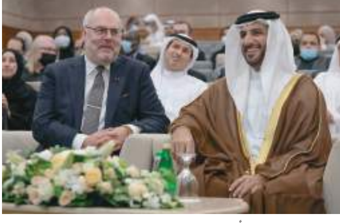
سلطان بن أحمد القاسمي خلال حضوره المحاضرة

شهد سمو الشيخ سلطان بن أحمد بن سلطان القاسمي، نائب حاكم الشارقة، رئيس جامعة الشارقة، يوم الاثنين، محاضرة علمية قدمها فخامة الرئيس الإستوني، الدكتور أثار كاريس، بعنوان « دور التكنولوجيا الحيوية في المجتمع الحديث» وذلك في قاعة البيروني بجامعة الشارقة.