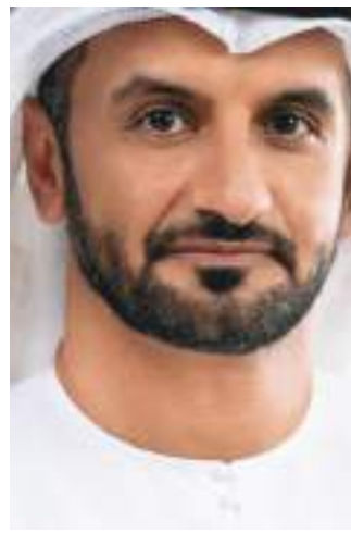
تطلعات أبوظبي نحو تنمية مختلف القطاعات الاقتصادية .. وقال : لا شك أن الحفاظ على

وأوضح أن دائرة الطاقة تقوم بالتعاون مع كافة الشركاء في الإمارة على وضع سياسات ولوائح تضمن تنمية الموارد المائية وتنظيم الانتفاع بها من أجل ضمان أمن الإمدادات بالمستقبل وبما يتناسب مع