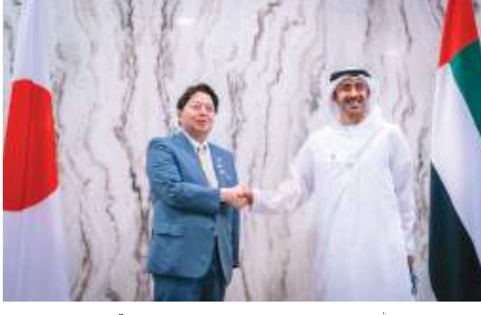
عبدالله بن زايد خلال استقباله وزير خارجية اليابان

استقبل سمو الشيخ عبدالله بن زايد آل نهيان وزير الخارجية والتعاون الدولي معالي يوشيماسا هاياشي وزير خارجية اليابان، الذي عقد مساء الأحد في أبوظبي، بحث العلاقات الاستراتيجية والدولية وسبل تعزيز آفاق التعاون المشترك في المجالات كافة. وبحث الجانبان الأوضاع في المنطقة والقضايا ذات الاهتمام المشترك إضافة إلى المستجدات على الساحتين الإقليمية والدولية ومنها التطورات في أوكرانيا وأهمية تعزيز الجهود العالمية المبذولة للتوصل إلى حل سياسي للأزمة.