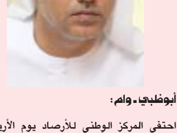
أبوظبي - وام :

احتفى المركز الوطني للأرصاد يوم الأربعاء، باليوم العالمي للأرصاد الجوية والذي يصادف ٢٣ مارس من كل عام، ويقام هذا العام تحت شعار «الإنذار المبكر والعمل المبكر».