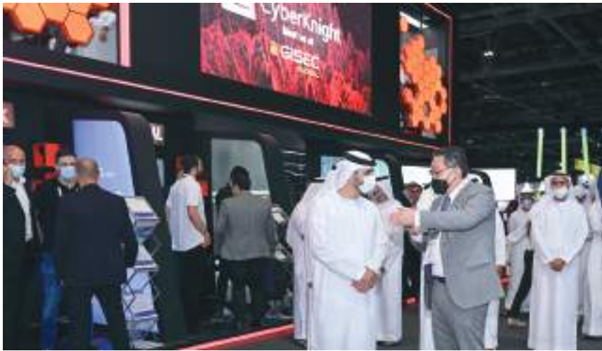
منصور بن محمد خلال الزيارة

ويُعد «مجمع دبي لابتكارات الأمن الإلكتروني» الزراع البحثية والمعرفية لمركز دبي للأمن الإلكتروني، ويهدف إلى تنمية الكفاءات المتخصصة في مجال الأمن الإلكتروني، ساعياً لتحقيق الأهداف الطموحة لاستراتيجية دبي للأمن الإلكتروني لتكون مدينة عالمية رائدة في مجالات الابتكار والسلامة والأمن، حيث يساهم المجمع في صناعة التكنولوجيا الحديثة التي من شأنها دعم رؤية دبي في تحقيق الأزدهار الاقتصادي الذي يواكب التحول الرقمي للإمارة من جهة، ويرسخ أمن فضاءها الإلكتروني من جهة أخرى.