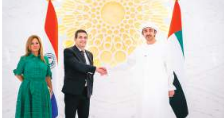
عبدالله بن زايد خلال استقباله نائب رئيس الباراغواي في مقر إكسبو

عبدالله بن زايد يستقبل نائب رئيس الباراغواي في مقر إكسبو