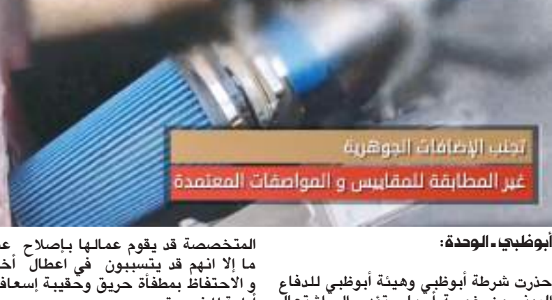
أبوظبي - الوحدة :

المتخصصة قد يقوم عمالها بإصلاح عطل ما إلا أنهم قد يتسببون في اعطال أخرى والاحتفاظ بمطفاة حريق وحقيبة إسعافات أولية للضرورة.