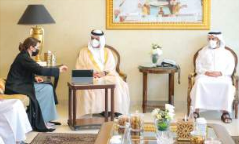
حاكم رأس الخيمة خلال استقباله مريم المهيري بحضور ولي عهده وأسا الخيمة

حاكم رأس الخيمة يطلع على خطط وبرامج وزارة التغير المناخي والبيئة