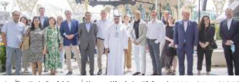
دبي - وام :

المتزايد لعضويتنا ويسعدنا أن يكون أول اجتماع لنا في الشرق الأوسط في إمارة دبي التي تقدم تجربة عالمية حقيقية لأعضائنا. ويضمن جدول أعمال الاجتماع أعضاء المجلس عددا من الفعاليات والزيارات التي تستعرض توجهات دبي المستقبلية للتحول إلى مدينة الرقمية وتطبيقات العمل عن بعد، وسعادة حمد المنصوري مدير عام هيئة دبي الرقمية ورئيس مجلس إدارة مركز محمد بن راشد للفضاء وسعادة خلفان بالهول الرئيس التنفيذي لمؤسسة دبي للمستقبل.