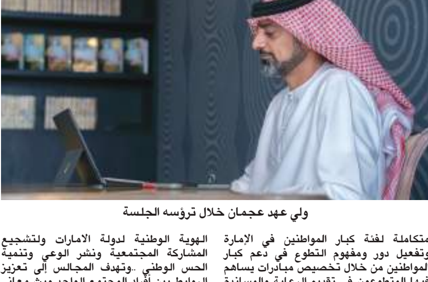
ولي عهد عجمان خلال ترؤسه الجلسة

ترأس سمو الشيخ عمار بن حميد النعيمي ولي عهد عجمان رئيس المجلس التنفيذي جلسة المجلس التنفيذي الثالثة لعام ٢٠٢٢ والتي عقدت في مجلس «الأمين» بمنطقة مشرف. وأشار سموه الى أن اجتماع المجلس في مجالس الأحياء جاء تأكيداً على عمق الروابط والعلاقات الاجتماعية التي تستظل محور اهتمام الحكومة والتي تحضر على تعزيزها من خلال مشاريعها ومبادراتها.