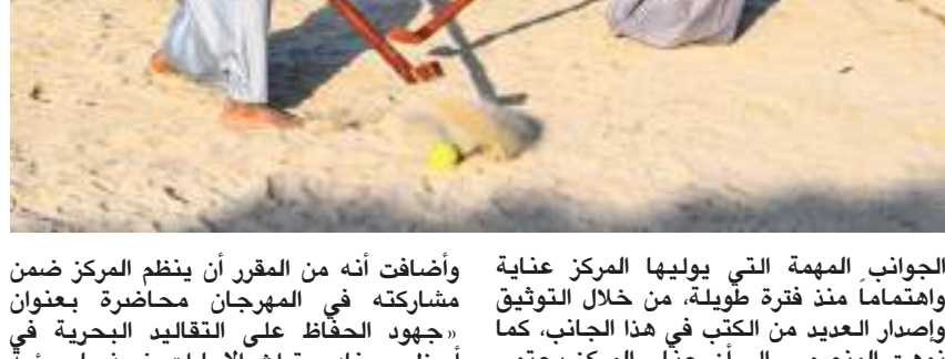
أبوظبي - وام :

التراث البحري، حيث تأهل فريقا «دلما» و«أبو الأبيض» إلى نهائي لعبة «الميت»، الذي سيقام في ٢٦ مارس الجاري، فيما تأهلت فرق «طنب الكبرى، طنب الصغرى، غناطة، داس» إلى إلى نهائي لعبة «القبة ومسطاع» الذي سيقام يوم ٢٦ مارس أيضا، وكانت تصفيات لعبة «القبة ومسطاع» جرت في أربع جولات يومي الأحد واليا وأمس الثلاثاء بمشاركة ستة فرق.