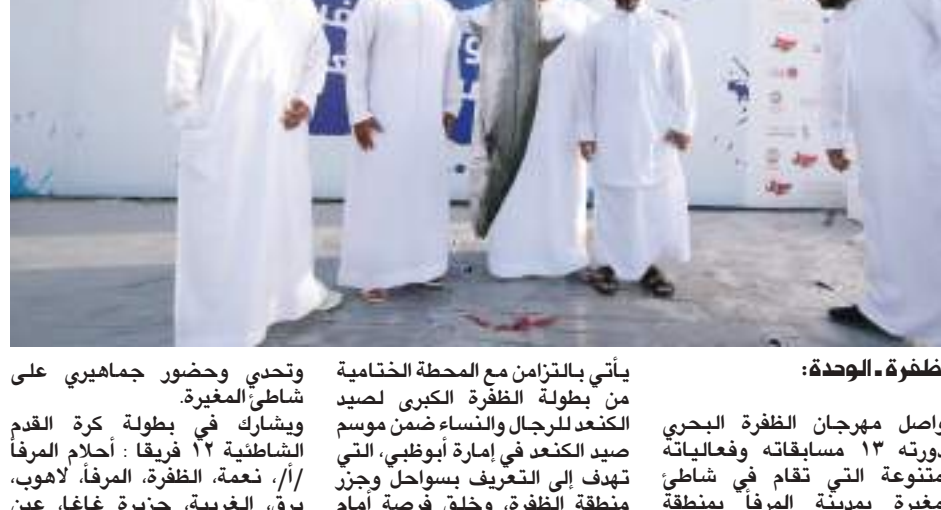
الظفرة - الوحدة :

يأتي بالتزامن مع المحطة الختامية من بطولة الظفرة الكبرى لصيد الكنعد للرجال والنساء ضمن موسم صيد الكنعد في إمارة أبوظبي، التي تهدف إلى التعرف بسواحل وجزر منطقة الظفرة، وخلق فرصة أمام الهواة لممارسة رياضة صيد السمك التقليدي، وتنشيط ونشر هواية صيد الأسماك وحياء روح التنافس بين هواة صيد الأسماك، والحفاظ على السلامة البحرية وتنظيم صيد الكنعد، إلى جانب الحفاظ على المسابقات التقليدية التراثية التي تعبر عن تراث الإمارات.