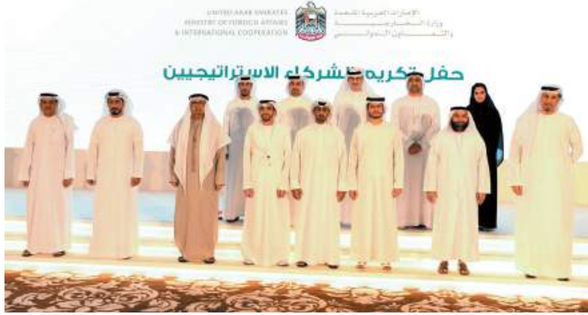
حفل تكريم شركاء الاستراتيجية

وأضاف سعادته: « لنا أن نسعد بما حققناه معاً من إنجازات مهمة ضمن إطار الدبلوماسية الاقتصادية لدولة الإمارات. وأسندت هنا الشركاء التي تمخضت عن توزيع وإنتاج اللقاحات،