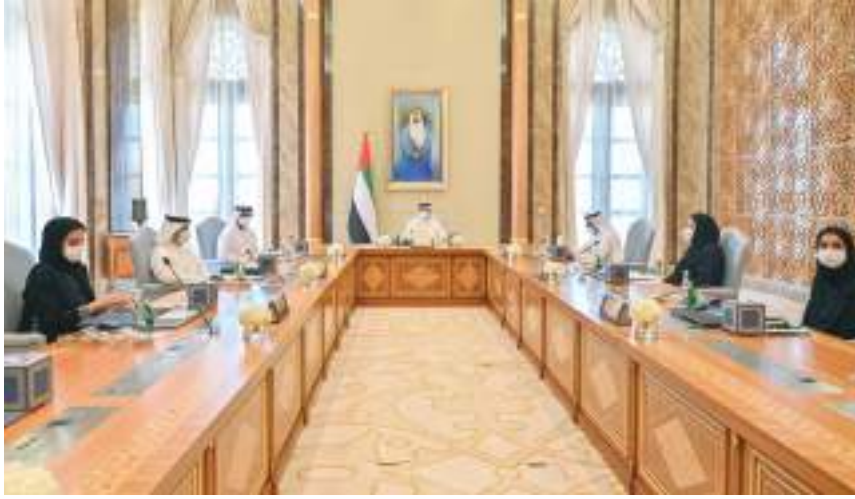
منصور بن زايد خلال ترؤسه الاجتماع

ويبحث مجلس الإدارة خلال الاجتماع المواضيع المدرجة على جدول الأعمال، وتناقش نشاطات الصندوق ومراحل إنجاز المشاريع الممولة في