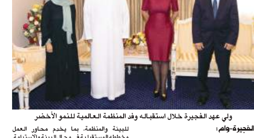
ولي عهد الفجيرة خلال استقباله وفد المنظمة العالمية للنمو الأخضر