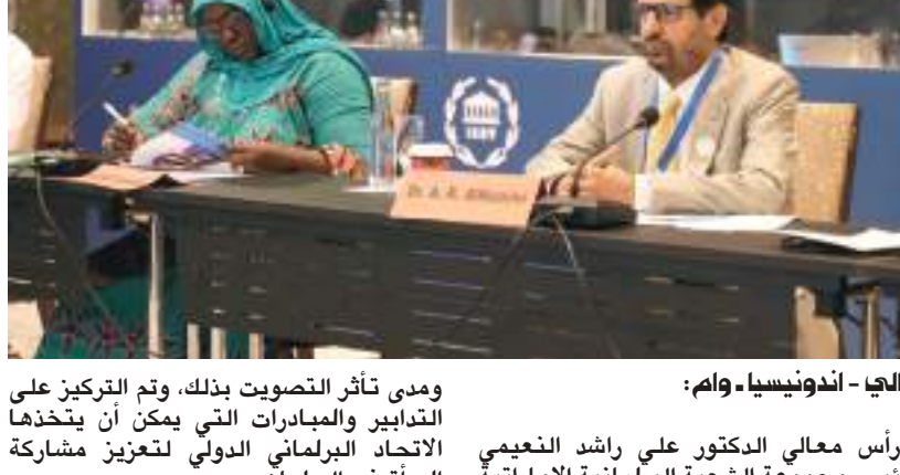
باجي - أندونيسيا - وام :

ومدى تأثير التصويت بذلك، وتم التركيز على التدابير والمبادرات التي يمكن أن يتخذها الاتحاد البرلماني الدولي لتعزيز مشاركة المرأة في البرلمان.