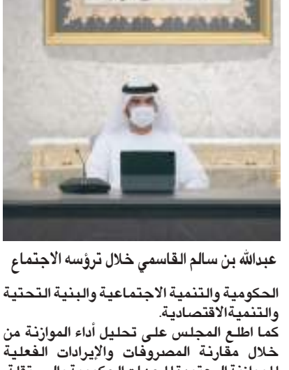
عبدالله بن سالم القاسمي خلال ترؤسه الاجتماع

عقد المجلس التنفيذي لإمارة الشارقة اجتماعه الأسبوعي برئاسة سمو الشيخ عبدالله بن سالم بن سلطان القاسمي نائب حاكم الشارقة نائب رئيس المجلس التنفيذي، وبحضور سمو الشيخ سلطان بن أحمد بن سلطان القاسمي نائب حاكم الشارقة. وناقش الاجتماع الذي عقد في مكتب سمو الحاكم عدداً من الموضوعات المدرجة على جدول الأعمال والتي شملت الأطلاع على سير الأعمال الحكومية وخطط تطويرها، ومناقشة المشروعات القانونية والخدمية المستقبلية. وأصدر المجلس القرار رقم ١١١ لسنة ٢٠٢٢ م بشأن تنظيم المراسي البحرية في إمارة الشارقة، ونص القرار على أن تسري أحكامه على ملاك الوسائل البحرية التي تتخذ من المراسي في الإمارة مكان لرسوها أو وقوفها. ووفقاً للقرار تتبع المراسي الجهات التالية: ١. المراسي العامة المنشأة في المياه البحرية للإمارة تتبع البلديات. ٢. المراسي المنشأة في موانئ الإمارة تتبع هيئة الشارقة للموانئ والجمارك والمناطق الحرة. ٣. المراسي الاستثمارية المخصصة من قبل حكومة الإمارة تتبع نادي الشارقة الدولي للرياضات البحرية. كما نظم القرار اختصاصات الجهات المعنية بالمراسي حول إنشاء المراسي وإدارتها والإشراف عليها. وأطلع المجلس على تقرير أداء الموازنة العامة ومرحجات الأنشطة للربعين الثالث والرابع من عام ٢٠٢١ م، وتضمن التقريران أبرز المؤشرات حول أداء الموازنة وفقاً لقطاعات الإدارة