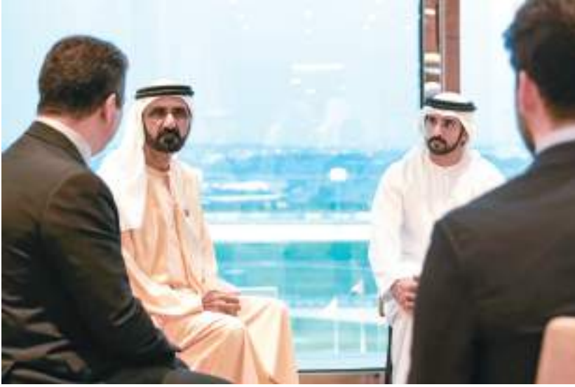
محمد بن راشد خلال استقباله رئيس حكومة إقليم كردستان العراق بحضور حمدان بن محمد

ولفت العميد سليمان إلى أن المركبة مزودة بمعدات لطاقات مثل /مقص وقطاعة/ بتقنية حديثة تعمل بالبطارية، واجهزة الإنذار الموسومة والمرنية لتسهيل حركة الانتقال لموقع الحادث.