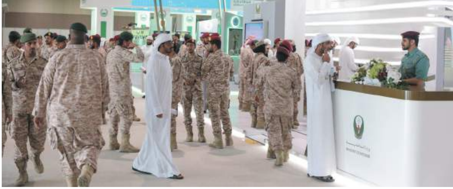
أبوظبي - الودعة:

تنطلق اليوم فعاليات الدورة الخامسة من معرض توظيف مجندي الخدمة الوطنية 2022 في مركز أبوظبي الوطني للمعارض لمدة ثلاث أيام بتنظيم من وزارة الدفاع ممثلة بهيئة الخدمة الوطنية والاحتياطية. ويأتي هذا المعرض إيماناً من هيئة الخدمة الوطنية والاحتياطية بأهمية توظيف مجندي الخدمة الوطنية وتوفير فرص العمل لهم من خلال الجهات الراغبة في استقطابهم بعد انتهائهم من البرنامج التدريبي المقرر حسب برنامج الخدمة الوطنية، كما يهدف المعرض إلى فتح قنوات التواصل بين مجندي