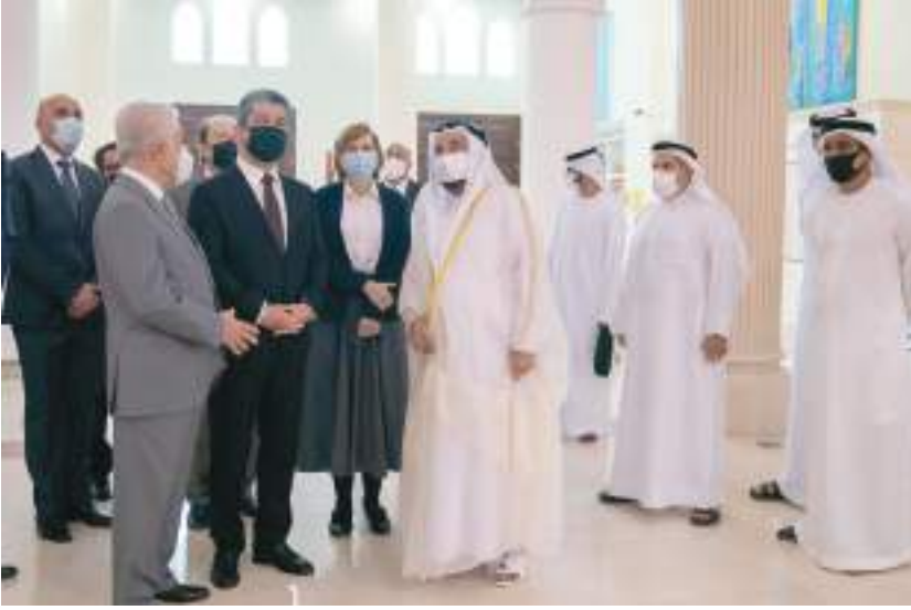
حاكم الشارقة خلال استقباله رئيس حكومة إقليم كردستان

وقال معالي رئيس المجلس الوطني الاتحادي «نحن ندرك تماماً أن العلاقة بين دول العالم - وشبهه وجنوبه، وغربه وغربه - ضرورة قصوى لإثراء وعناء لكل دولة بقيم وثقافات وحضارات الآخرين على التبادل المعرفي، وحوار الثقافات، واستثمار المساحات الهائلة