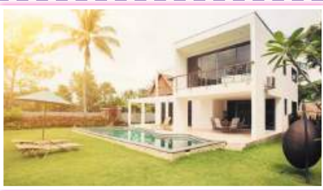
مزارع حولت للترفيه والتأجير