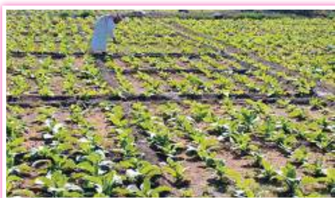
مزرعة تسهم في الغذاء المحلي

والحدائق بالإضافة إلى آلاف المزارع التي غطت مناطق العين وسويحان والغربية وأبو ظبي واليحر وناهل والفاية. وكلها مزارع منتجة للخضار والفواكه بالإضافة للإنتاج الحيواني.