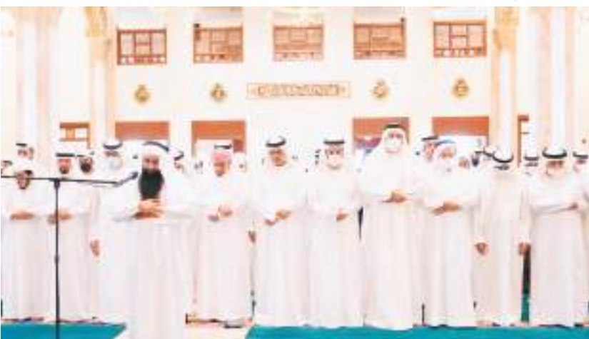
ولي عهد رأس الخيمة خلال أداء صلاة الجنازة على جثمان «عذبة الغرير»