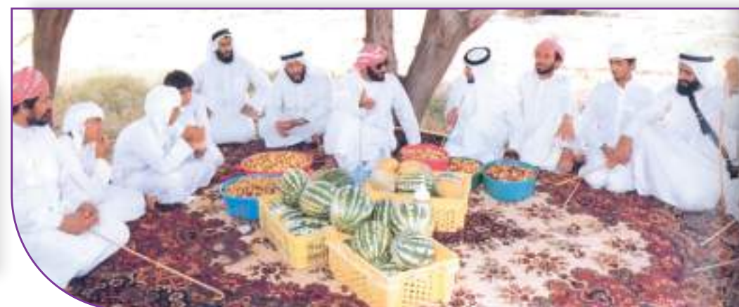
الشيخ زايد رحمه الله ودعمه السخي للمواطن المزارع