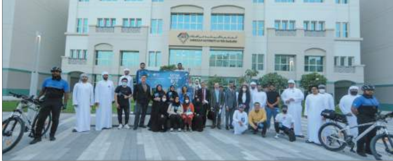
دبجاء - الودعة:

بالتعاون مع شرطة دبي، وبالتزامن مع احتفال دولة الإمارات العربية المتحدة باليوم العالمي للتوحد، نظمت الجامعة الأمريكية في الإمارات AUE، ممثلة في كلية التربية بالجامعة، فعالية "اليوم التوعوي للتوحد 2022"، في إطار الدور التربوي والمجتمعي للجامعة، بتسليط الضوء على هذه الشريحة الهامة، ودورها في مختلف المجتمعات، وسبل التعامل معها بشكل إنساني، وكيفية تذليل الصعوبات التي تواجهها. وتعد هذه الندوة من أولى المساهمات والمشاركات التي يتم تنظيمها بين المراكز المتخصصة بشؤون أصحاب القدرات الخاصة وذوي الهمم، وبين مؤسسات التعليم العالي، كالجامعة الأمريكية في الإمارات؛ لما في ذلك من أهمية قصوى لتقريب المجتمع بكل فئاته، من شريحة أصحاب التوحد، وكيفية دمجهم والتعامل معهم، وتوظيف طاقاتهم لخدمة المجتمع، والتعريف بالاحتياجات الملحة لهم. شارك في الندوة التي عُقدت في مقر الجامعة الأمريكية في الإمارات بمدينة دبي