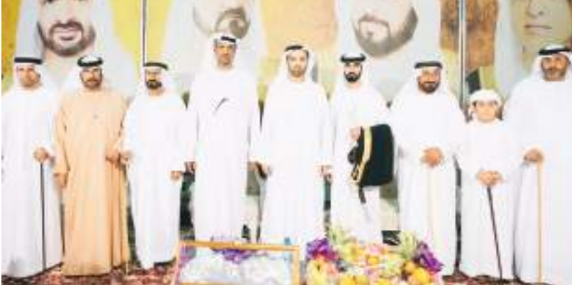
ولي عهد رأس الخيمة خلال حضوره أفراح الحبسي