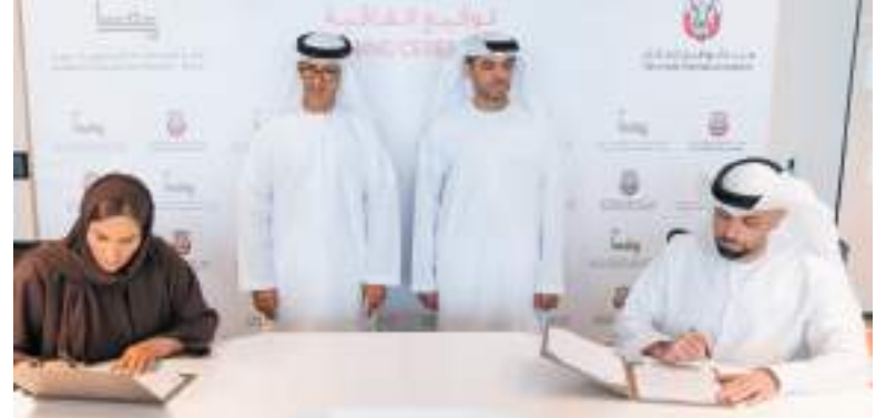
أبوظبي - وام:

وقعت هيئة المساهمات المجتمعية - معاً» وبنية أبوظبي للإسكان اتفاقية شراكة استراتيجية تهدف إلى دعم مبادرات ومشروعات القطاع الاجتماعي في إمارة أبوظبي، حيث جرى توقيع المذكرة في منصة الابتكار الاجتماعي «أخذ وعطاء» التي تنظمها هيئة «معاً» في الغاليريا بجزيرة المارية وتمتد حتى 29 مارس الجاري. وتسعى الاتفاقية لتعزيز التعاون والتنسيق المشترك بين الطرفين وتطوير ودعم الشراكة الاستراتيجية بينهما بهدف تقديم الحلول المبتكرة للأولويات الاجتماعية في إمارة