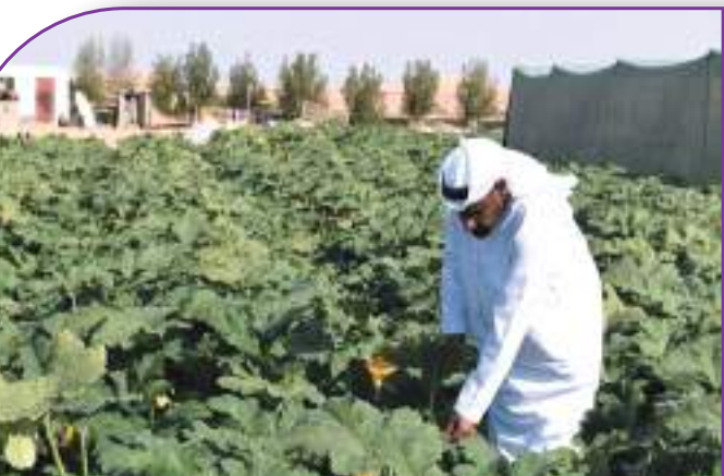
مواطن مزارع كادح يعتني بمزرعته