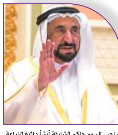
صاحب السمو حاكم الشارقة أنشأ دائرة الزراعة والثروة الحيوانية والسمكية