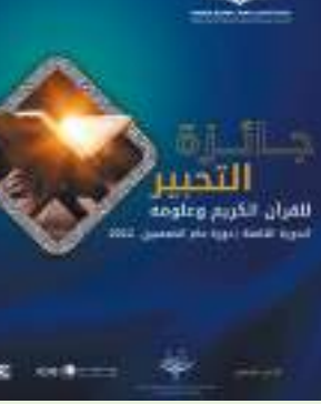
أبوظبي - وام:

تبدأ اللجنة العليا المنظمة للجائزة التحبير للقرآن الكريم وعلومه في دورتها الثامنة "دورة عام الخمسين" في استقبال طلبات المشاركة اعتباراً من الخامس والعشرين من شهر شعبان