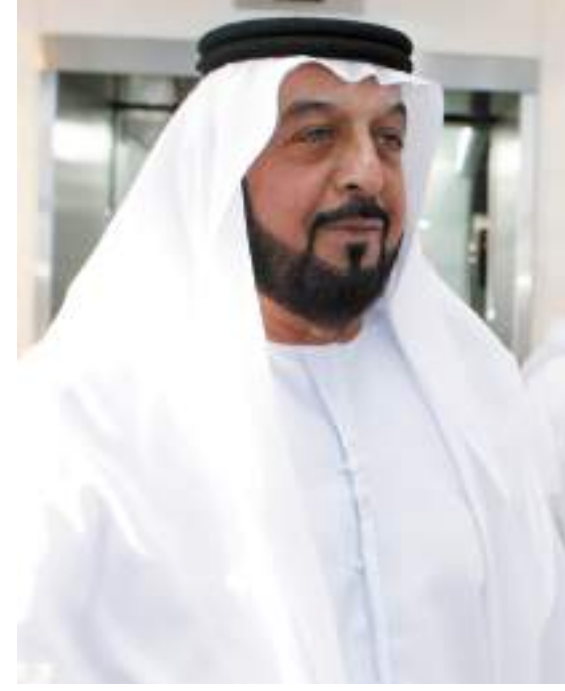
أبوظبي - وام:

أمر صاحب السمو الشيخ خليفة بن زايد آل نهيان رئيس الدولة "حفظه الله"، بالإفراج عن 540 نزيلاً من نزلاء المنشآت الإصلاحية والعقابية ممن صدرت بحقهم أحكام في قضايا مختلفة، وذلك بمناسبة حلول شهر رمضان المبارك. وتأتي هذه المكرمة السامية من صاحب السمو رئيس الدولة "حفظه الله" في إطار المبادرات الإنسانية لدولة الإمارات والتي تستند إلى قيم العفو والتسامح، وإعطاء نزلاء المنشآت الإصلاحية والعقابية فرصة التغيير نحو الأفضل والبدء من جديد في المشاركة الإيجابية بالحياة، بالشكل الذي ينعكس على أسرهم ومجتمعهم.