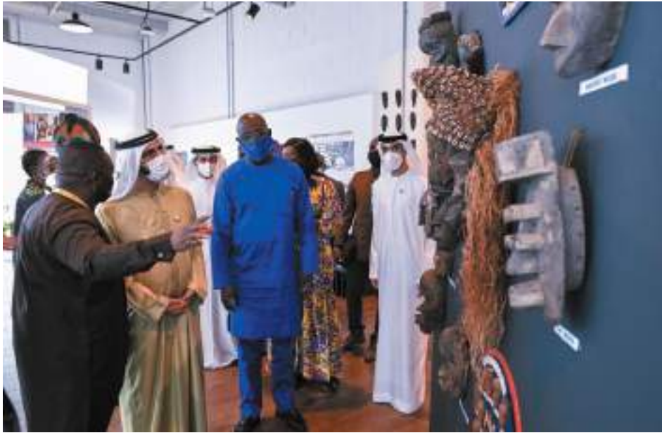
دبي - وام:

التقى صاحب السمو الشيخ محمد بن راشد آل مكتوم، نائب رئيس الدولة رئيس مجلس الوزراء حاكم دبي، رعاه الله، يوم الاثنين فخامة سيريل رامابوسا، رئيس جمهورية جنوب إفريقيا، كما التقى سموه فخامة جورج ويا، رئيس جمهورية ليبيريا، وذلك في جناحي بلديهما في إكسبو 2020 دبي، في حين شملت زيارة سموه إلى المعرض تفقّد جناحي كل من العراق وتونس الشقيقتين. وخلال اللقاء الذي جرى في جناح جنوب أفريقيا، تبادل صاحب السمو الشيخ محمد بن راشد آل مكتوم والرئيس سيريل رامابوسا الحوار حول آفاق التعاون بين الدولتين وسبل دفعها