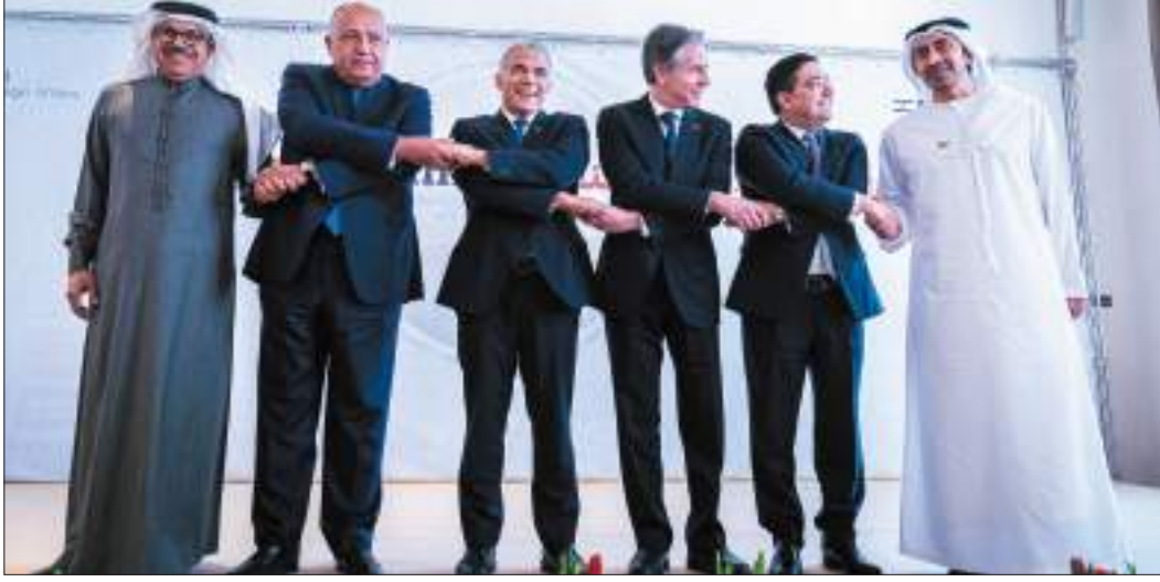
إسرائيل - وام:

شارك سمو الشيخ عبدالله بن زايد آل نهيان وزير الخارجية والتعاون الدولي في "قمة النقب"، التي