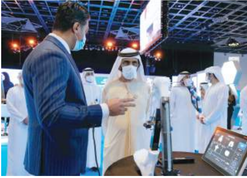
محمد بن راشد تفقده معرض التقنيات والحلول الذكية الطبية المصاحب للمنتدى

رئيس مجلس الوزراء، حاكم دبي، رعاه الله، بالمشاركين في المنتدى من مختلف أنحاء المنطقة والعالم، مؤكدا حرص دولة الإمارات على تبني وتطبيق كل الأفكار والابتكارات التي تضمن السلامة للمجتمع، وتسهم في تطوير ودفع جهود الارتقاء بصحة الإنسان.