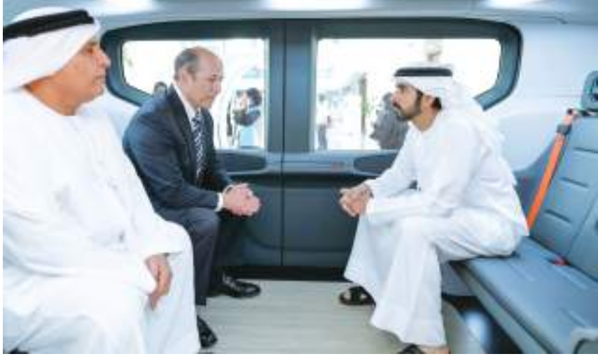
حمدان بن محمد خلال تفقده نموذج مركبة «أوريجن»