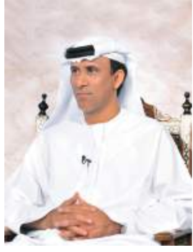
أبوظبي - الوحدة:

وجه سعادة محمد بن ثعلوب الدرعي رئيس اتحاد الإمارات للمصارعة والجودو بتكريم منتخب الجودو بطل العرب عقب فوزهم بالقباب البطولة العربية للجودو للمنتخبات والأندية للجنسين التي تختتم اليوم الخميس في العاصمة عمان الأردنية، والتي شهدت مشاركة 16 دولة عربية، والتي حسم لقبها الذهبي على مستوى الشباب والرجال منتخبنا الوطني من خلال أول مشاركته رسمية لتلك المجموعة من الشباب الذين انهموا الخدمة الوطنية منذ أسبوعين في غياب مشاركتهم الخارجية الرسمية بسبب جائحة الكورونا، وقد خضع الثلاثي الصاعد لمعسكر داخلي في أبوظبي لمدة أسبوع فقط، في غياب 5 آخرين تعذر انضمامهم بسبب الامتحانات، وحرص الاتحاد على مستقبلهم الأكاديمي، لذلك كانت المشاركة بثلاثة لاعبين فقط، والذين نجحوا في اعتلاء منصة التتويج الذهبية والفوز بلقب بطولة