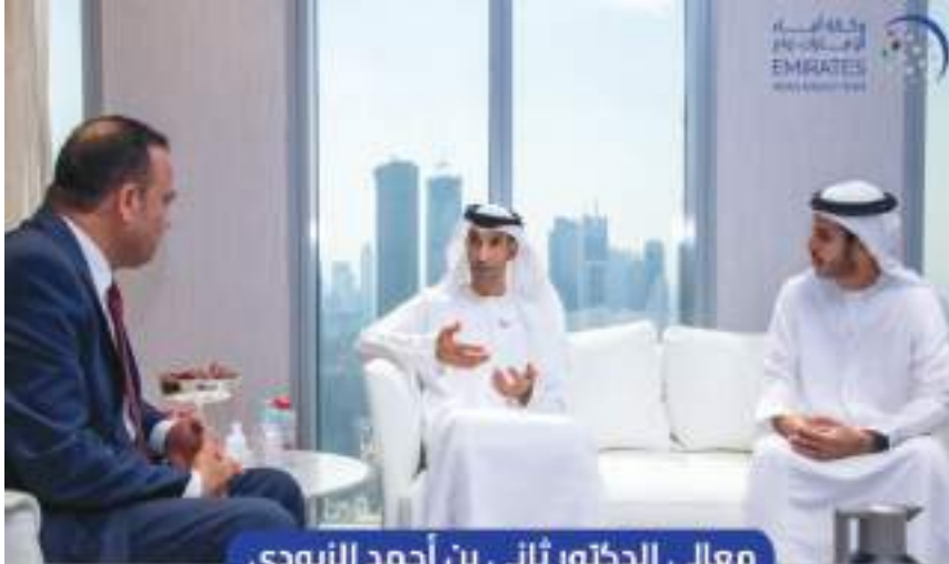
معالي الدكتور ثاني بن أحمد الزيودي وزير دولة للتجارة الخارجية لـ "وام":

وجاءت سلطنة عمان في المركز السادس بهذه القائمة بنسبة 3,7% وقيمة 164,7 مليار درهم، والكويت بنسبة 3,5% وقيمة 158 مليار درهم، وبلجيكا بنسبة 3% وقيمة 135,9 مليار درهم، والولايات المتحدة الأمريكية بنسبة 2,8% وقيمة 124,9 مليار درهم، وسويسرا بنسبة 2,8% وقيمة 123,5 مليار درهم.