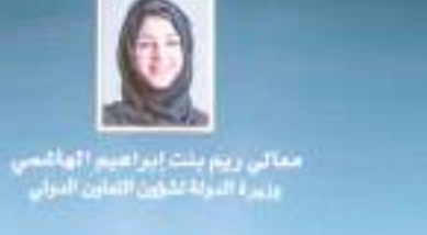
د.ريم بنت إبراهيم الهاشمي ويزرة الدولة لشؤون التأمين الدولي