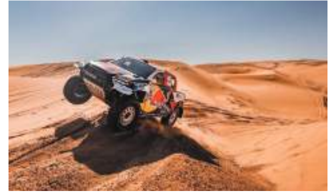
أبوظبي - الوحدة:

برعاية سمو الشيخ حمدان بن زايد آل نهيان ممثل الحاكم في منطقة الظفرة، ينطلق رالي أبوظبي الصحراوي في نسخته الحادية والثلاثين خلال الفترة من 5 - 10 مارس المقبل. ويتمتع رالي أبوظبي الصحراوي بتاريخ حافل في صنع وإحباط طموحات الفوز باللقب العالمي، وستكون توقعات الفوز أعلى عند انطلاق الحدث ودخوله عصر جديد من الريالات الصحراوية في عطلة نهاية الأسبوع.