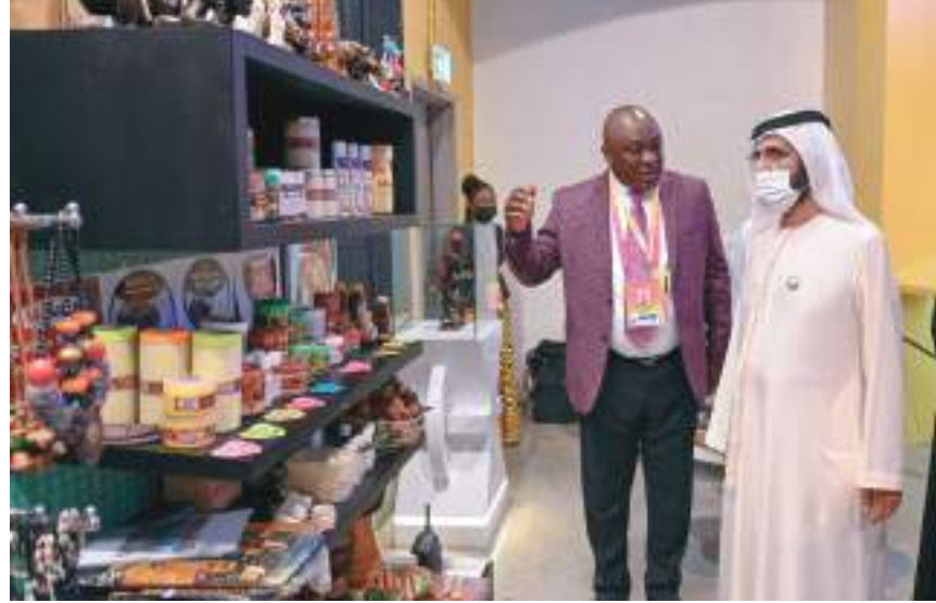
محمد بن راشد خلال لقائه رئيس غانا ويزور جناحها في أكسبو

مصالح الشعبين الصديقين، من خلال رصد الفرص لمضاعفة الجهود ضمن العديد من المجالات خاصة الزراعة والتكنولوجيا، فضلا عن اتفاق الجانبين على أهمية العمل على زيادة مستويات التبادل التجاري والسياحي بين البلدين، واكتشاف مزيد من الفرص الاستثمارية التي تدعم الشراكة الاقتصادية وتدفعها قدما خلال المرحلة المقبلة.