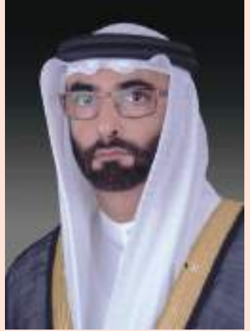
أبو ظهري - وام :

قال معالي محمد بن أحمد البواردي وزير الدولة لشؤون الدفاع إن الاحتفال بيوم المرأة العالمي هذا العام يأتي ونحن على أعتاب مرحلة فاصلة نحتفل في مستهلها باليوبيل الذهبي لقيام دولتنا الفتية و بالخصيين عاما القادمة من عمر الإمارات. وأضاف معاليه في كلمة له بمناسبة يوم المرأة العالمي: لقد استطاعت المرأة الإماراتية خلال العقود الخمسة الأولى من عمر الدولة أن تثبت جدارتها وتحقق حضورا نوعيا متميزا في المجالات كافة كونها عنصرا فاعلا في جميع مفاصل الحياة في إطار مساهماتها المشهوده في مسيرة التنمية الوطنية الشاملة التي تشهدها الدولة.