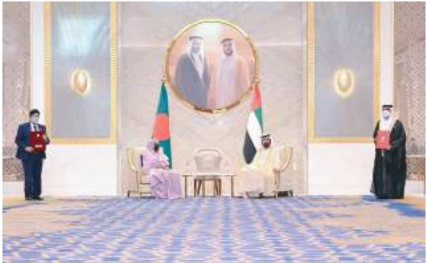
محمد بن راشد خلال استقباله رئيسة وزراء بنغلاديش في إكسبو

دولة الإمارات على تنظيم واستقبال كبرى الفعاليات العالمية بكل كفاءة واقتدار.