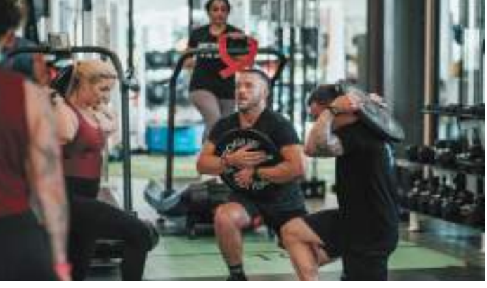
دبي/ وام :

يستضيف مجمع ند الشبا الرياضي يوم السبت القادم التحدي الخيري /باتل كانسر للكروسفت/ الذي يقام لأول مرة في المنطقة، ويهدف إلى جمع التبرعات لدعم أبحاث السرطان وتوفير العلاج لمرضى السرطان، وذلك بالتعاون مع مجلس دبي الرياضي وبالشراكة مع مؤسسة الجيلة. يتضمن الحدث الخيري الشهير أربع منافسات متنوعة تختبر القدرات الرياضية واللياقة البدنية للمشاركين باستخدام أبسط المعدات الرياضية وتمنحهم التحدي الأمثل لاختبار قدراتهم البدنية، والتي تشمل حمل الأوزان بتكرارات محددة منها بامر بلت