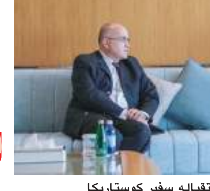
ولي عهد أم القيوين خلال استقباله سفير كوستاريكا

وأشار الشحي بمشاركة الصومال الهادفة والفاعلة في إكسبو ٢٠٢٠ دبي، معتبراً حضور البلد الشقيق فرصة ليتعرف العالم على ما حققه الصومال من نجاحات، وتطور في مختلف القطاعات، ومنصة لعرض خطط الصومال المستقبلية لجذب المستثمرين من مختلف دول العالم.