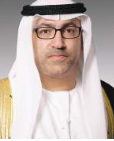
عبدالرحمن محمد العويس

رئيسة المجلس الأعلى للأوممة والطفولة الرئيسة الأعلى لمؤسسة التنمية الأسرية «أم الإمارات» إطلاق وتنفيذ استراتيجية تمكين المرأة من خلال مواصلة بناء قدراتها بما يضمن توسيع نطاق مشاركتها التنموية إلى جانب الحفاظ على النسيج الاجتماعي وتماسكه عبر تكامل الأدوار بين الرجل والمرأة لبناء مجتمع قوي ومتماسك قادر على مواكبة التغيرات المستجدة والبناء على الإنجازات المتحققة والحفاظ على المكتسبات واستدامتها.