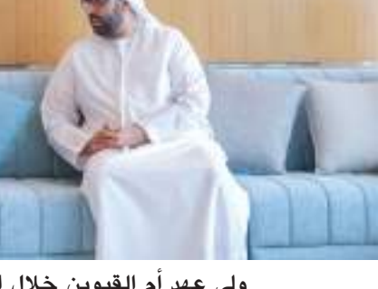
ولي عهد أم القيوين خلال استقباله سفير كوستاريكا