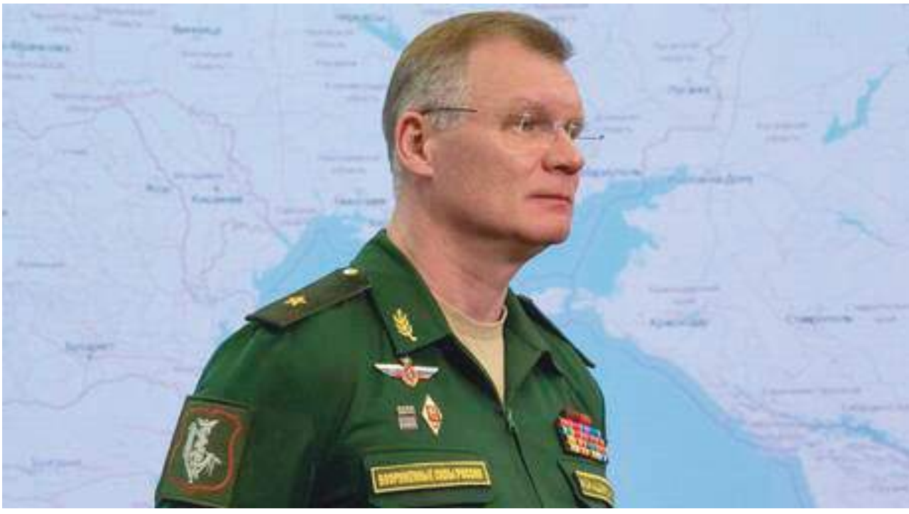
للدفاع الجوي لأوكرانيا، وقالت إن المنظومة الصاروخية باتت بالفعل موجودة هناك وأنه تم نقلها في سرية تامة خلال اليومين السابقين، بحسب قناة «آر تي عربية».

أعلنت وزارة الدفاع الروسية يوم الاثنين أن قواتها دمرت ٧٨ هدفا عسكريا إضافيا لأوكرانيا. وقال المتحدث باسم وزارة الدفاع الروسية إيجور كوناشينكوف إن «النظم الدفاعية الجوية الروسية أسقطت طائرتين حربيتين أوكرانيتين من طراز سو-٢٥ بالقرب من بلدة إيزيوم (شمال شرق أوكرانيا)». وبالإضافة إلى ذلك، تم إسقاط هليكوبتر قتالية أوكرانية من طراز مي-٢٤ في منطقة خيرسون جنوبي أوكرانيا. ولم يتسن التحقق بشكل مستقل من المعلومات. وتدل روسيا ببيانات محدثة بشكل متكرر حول المعدات والمواقع العسكرية الأوكرانية التي دمرتها، ولكنها تقول إنها لا تستهدف المدنيين على الرغم من وجود أدلة كبيرة على ذلك. وأفاد كوناشينكوف بأنه تم تدمير عدة مواقع قيادية أوكرانية ونخيرة ومستودعات وقود ونظم دفاعية جوية. وأشار إلى أنه من بين الأهداف الأوكرانية التي تم تدميرها معدات لمنظومة «إس-٣٠٠» مضادة للطائرات تم تسليمها لكيف من أوروبا، بالقرب من مدينة دنيبورو، و أن الجيش الروسي نفذ ضربة بصواريخ «كالبير» من البحر يوم الأحد، ما أسفر عن تدمير ٤ منصات إطلاق لمنظومة «إس-٣٠٠» وقتل عدد قد يصل إلى ٢٥ فردا من عناصر القوات الأوكرانية. تجدر الإشارة إلى أن سلوفاكيا أكدت يوم الجمعة الماضي أنها نقلت منظومة «إس-٣٠٠»