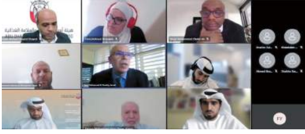
الضبط القضائي التثقيبي.

وأفادت دائرة القضاء، أن الدورة التثقيبية لتجديد صفة الضبطية القضائية لمفتشي الجهات الحكومية، التي تنفذها أكاديمية أبوظبي القضائية، تستهدف إكساب المفتشين المهارات المتكاملة لتمكينهم من تطبيق المستحدثات التشريعية الهادفة إلى تحقيق الاستفادة التمتوية في إدارة المرافق العامة، من خلال التطبيق الصحيح لمفاهيم الضبط الإداري ومبادئ أحكام القانون، فضلاً عن المفاهيم الحديثة لأحكام