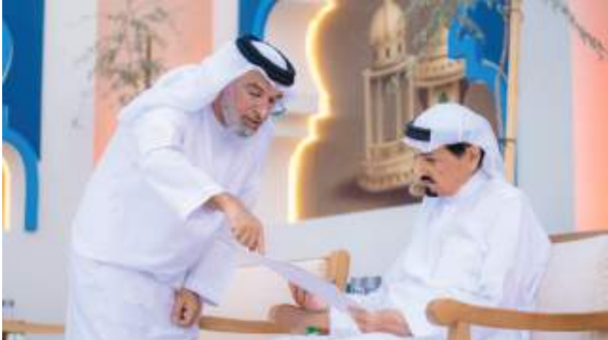
والتشجيع على بذل المزيد من الجهد والوقت للحفاظ والتجويد. حضر الاستقبال الشيخ أحمد بن حميد النعيمي، ممثل صاحب السمو حاكم عجمان

وأكد سموه على أهمية دور إدارة المركز في تحفيز الأجيال الناشئة على الالتزام بدينها، وإدراك واجباتها تجاه دينها و وطنهم، ورفع روح التنافس في مجال حفظ القرآن الكريم،