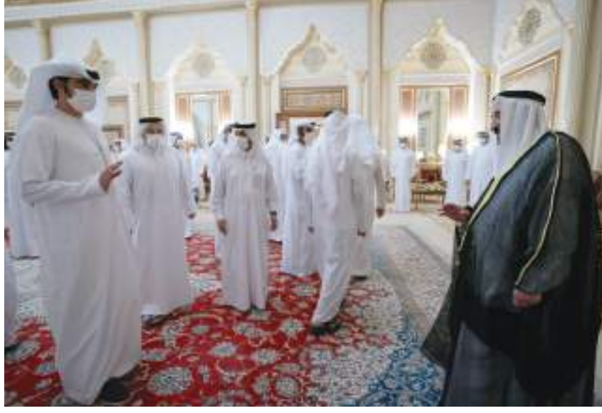
حاكم الشارقة خلال استقباله المهنيين بشهر رمضان المبارك