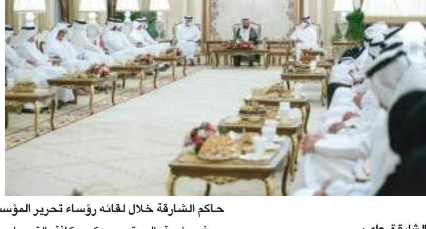
حاكم الشارقة خلال لقائه رؤساء تحرير المؤسسات الإعلامية وعددًا من الإعلاميين والصحفيين