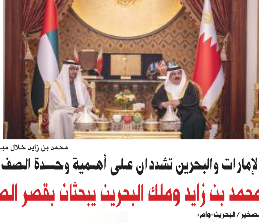
محمد بن زايد خلال مباحثاته مع ملك البحرين

إلى ذلك، حث مركز النقل المتكامل كافة المتعاملين على تحميل تطبيق الهاتف الذكي «درب» الذي يوفر مجموعة متكاملة من خدمات النقل، والاستفادة من الخدمة الجديدة والمزايا العديدة التي تجلبها عبر التطبيق، الأمر الذي يتيح لهم تجربة تنقل فريدة، ورحلة متكاملة، سلسة وبسيطة.