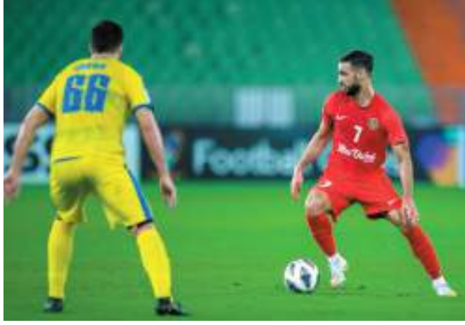
جدة - وام :

تعادل شباب الأهلي مع الغرافة القطري بنتيجة 1/1 ضمن لقاء الجولة الثالثة للمجموعة الثالثة لمرحلة المجموعات من دوري أبطال آسيا لكرة القدم، والذي أقيم مساء أمس على استاد الأمير عبد الله الفيصل في مدينة جدة.