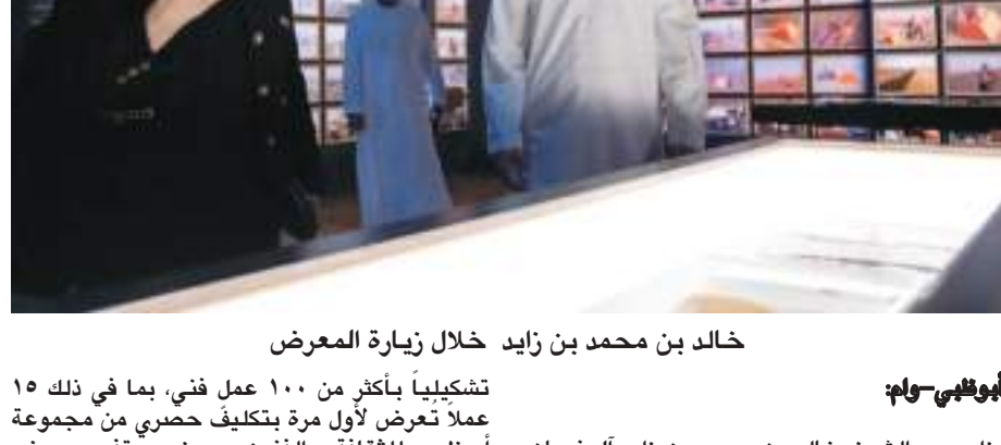
خالد بن محمد بن زايد خلال زيارة المعرض