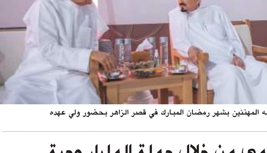
حاكم عجمان خلال استقباله المهنيين بشهر رمضان المبارك في قصر الزاهر بحضور ولي عهد