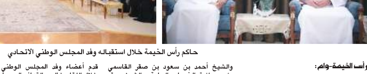
حاكم رأس الخيمة خلال استقباله وفد المجلس الوطني الاتحادي