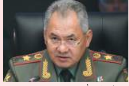
موسكو - (د ب أ) -

تتهمت وزارة الدفاع الروسية يوم الأحد الحكومة الأوكرانية بمنع قواتها المحاصرة في مصنع «أزوفستال»، آخر معقل لها في مدينة ماريوبول، من التفاوض على الاستسلام، وفقاً لما نقله موقع قناة «آر تي عربية».