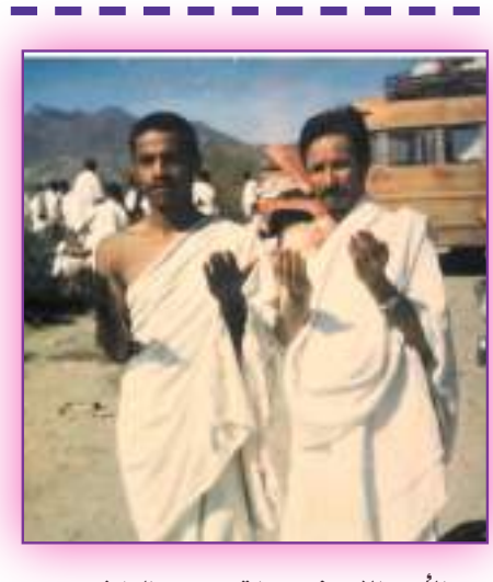
الأب والإبن في رحلة حج من الماضي