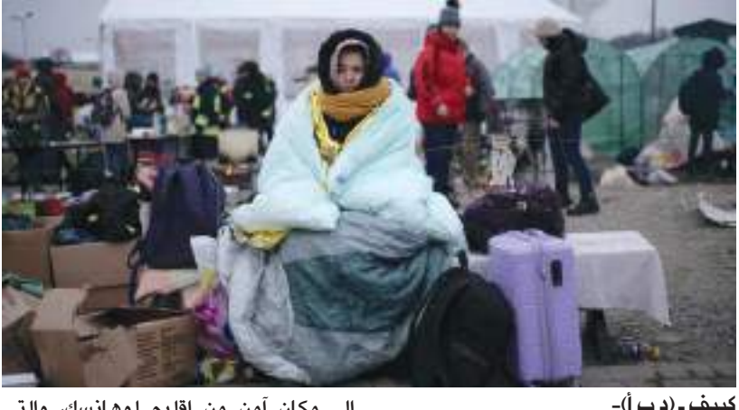
كييف - (د ب أ) -

إلى مكان آمن من إقليم لوهانسك، والتي تتعرض لإطلاق نار مستمر. ولم يتم إجلاء أي شخص من مدينة ليسيتشانسك في المنطقة بسبب «القصف المكثف». ومن ناحية أخرى، قالت موسكو إنه «على الرغم من العقبان التي تسببها كريف»، تم إجلاء حوالي ١٥٨٠٠ شخص إلى داخل روسيا من المناطق الأوكرانية المحاصرة في غضون ٢٤ ساعة دون تدخل السلطات الأوكرانية. وتبادلت كريف وموسكو الاتهامات على مدار أسابيع بإسقاط قذائف المدفعية. ولم يتسن التحقق من الادعاءات بشكل مستقل.