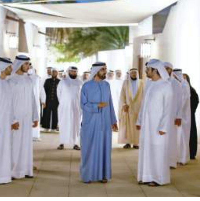
محمد بن راشد خلال استقباله العلماء والوعاظ ضيوف رئيس الدولة وجائزة دبي الدولية للقرآن الكريم

وقال أن فرق التدقيق والتحكيم عملت منذ اليوم الأول على فرز وتقييم الطلبات وتحكيمها أولاً بأول، حيث سيتم الإعلان الرسمي نهاية الأسبوع الحالي كما هو مخطط في برنامج الجائزة. وأضاف «شهدنا مشاركة طيبة وفعالاً كبيراً من جميع أنحاء العالم مع هذه الجائزة التي تنطلق من الإمارات إلى العالم وتستهدف نشر قيم الإسلام السمحة وأخلاقها ومبادئ الأخوة الإنسانية» مؤكداً أن الجميع فائز في المشاركة بهذه الجهود التي تعزز احترام الآخرين والتعايش والتسامح والأخوة في إطار معرفي تنافسي.