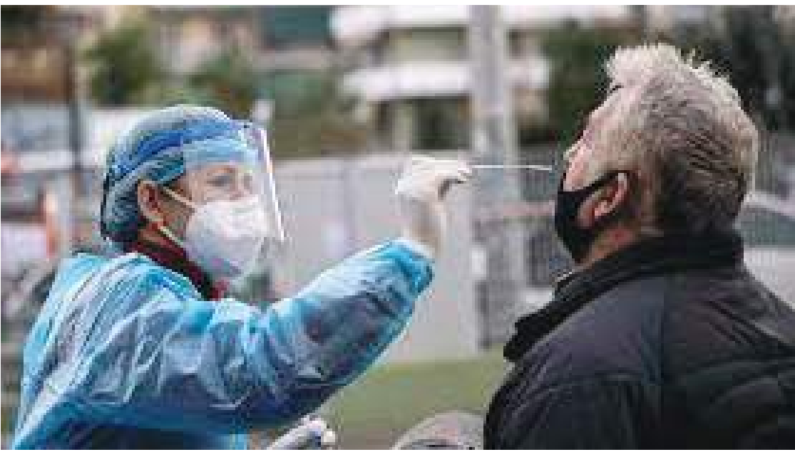
أثينا - (د ب أ) -

الأمريكية يوم الأحد. وبذلك ترتفع حصيلة الإصابات المؤكدة بكورونا في البلاد إلى ثلاثة ملايين و ٢٣٢ ألفاً و ٤٩٦، والوفيات إلى ٢٨ ألفاً و ٥٣٧. وأظهرت بيانات جونز هوبكنز يوم الأحد أيضاً أنه تم إعطاء ٢٠ مليوناً و ٧١٩ ألفاً و ٧٦٨ جرعة من