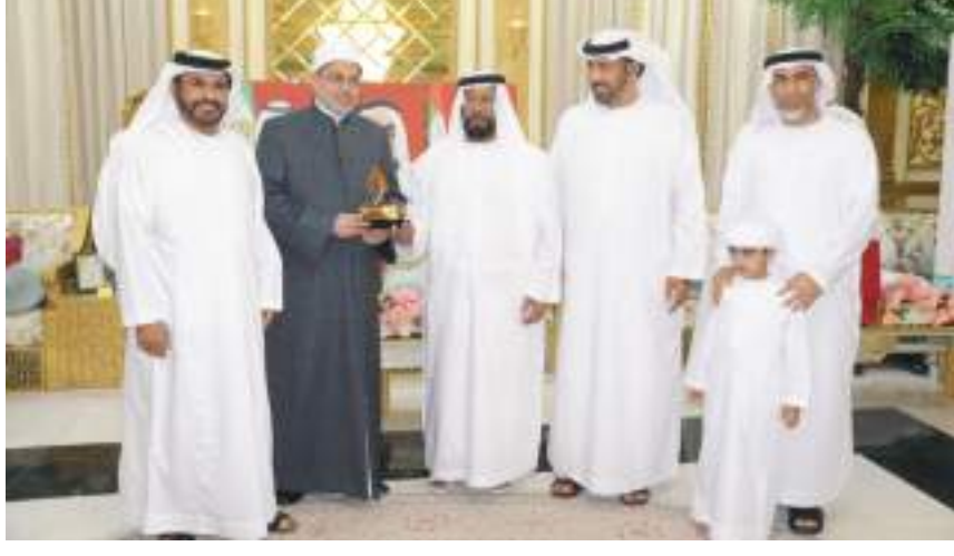
حيث تميزت بالذكاء والحكمة والعدل خاصة في حل المشاكل حيث كان رحمه الله يجذب الحوار والوفاق والتسوية السلمية لأي نزاع. وقدم الدكتور سلامة جمعة داود محاضرة حول النظرة الدينية والإنسانية والأخلاق الحميدة التي اتسمت بها شخصية الشيخ زايد، معتبراً أن العظمة تظل سيرتهم العطرة وأعمالهم شاهداً على ما قدموه للبشرية

في بداية المحاضرة رحب صاحب المجلس الشيخ محمد بن ركاض، بالضيوف والحضور، مؤكداً أن روح المغفور له الشيخ زايد بن سلطان آل نهيان طيب الله ثراه ستبقى حية وخالدة في ذاكرة ووجدان الوطن والمواطنين وسيرته الخالدة في الحكمة والتسامح والخير والعباءة والسخاء ستبقى أيضاً راسخة في النفوس البشرية والأجيال. وقال: إن مسيرة زايد وفلسفته الاجتماعية وعقلائته في الحياة كانت حالة فريدة عرفناها عن قرب في دولة الإمارات ووصلت إلى كافة الشعوب