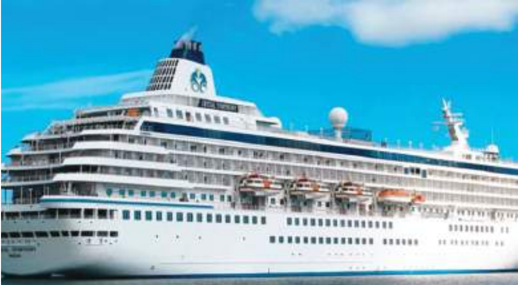
سيدني - (د ب أ) -

انتهى يوم الأحد الحظر الذي فرضته أستراليا قبل أكثر من عامين على دخول السفن السياحية للبلاد الإقليمية للبلاد.