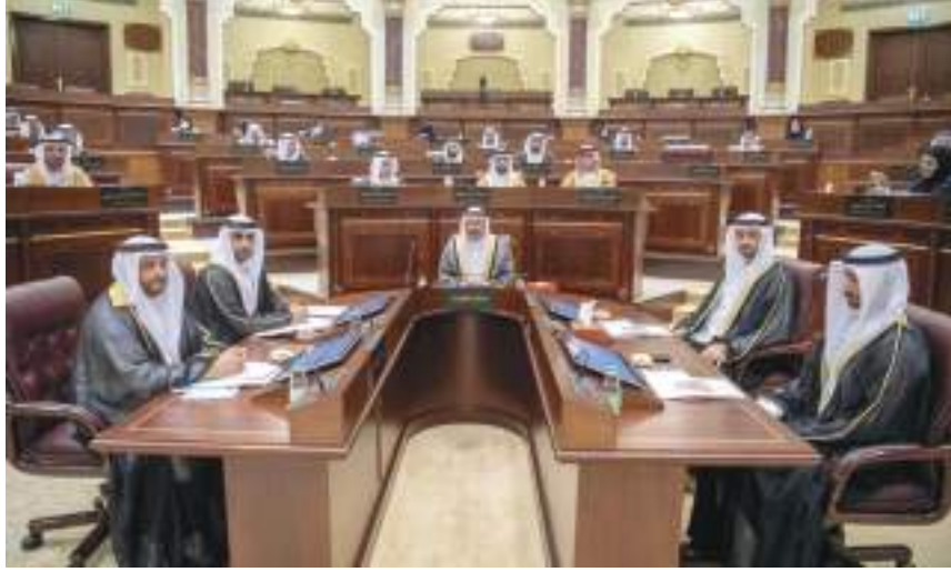
المشروع تمضي نحو تحقيق إنجازات بإمارة الشارقة هدفت لتعزيز فكرة العمل اللائق وتوفير الحقوق الأساسية للعاملين في الإمارة خاصة

وأكد سعادة سالم يوسف القصير أهمية مشروع القانون كونه يمنح الهيئة الشخصية الاعتبارية والأهلية الكاملة والالتزام لمباشرة جميع أعمالها لتحقيق دورها في ضمان بيئة عمل متميزة وجاذبة للعمال وأصحاب العمل موضحا أن الهيئة ومن خلال دورها وكذلك تناولها لهذا