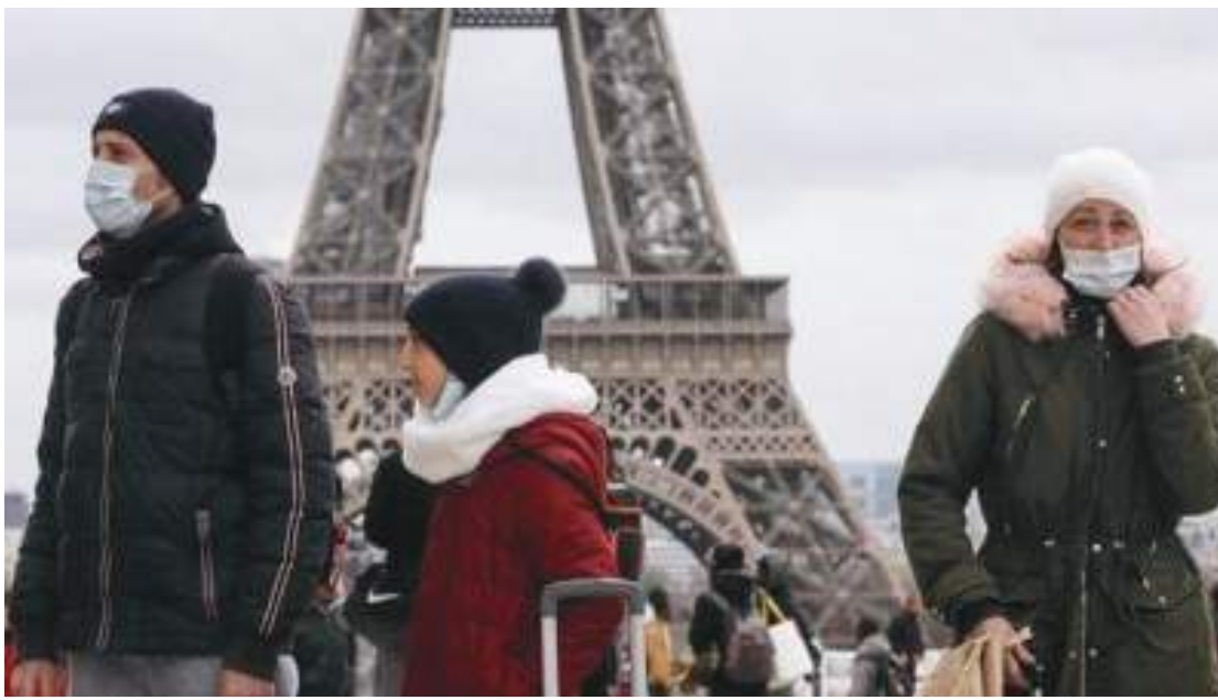
باريس - (د ب أ) -

الأمريكية يوم الأحد. وبذلك ترتفع حصيلة الإصابات المؤكدة في البلاد إلى ٢٧ مليوناً و ٨٧٤ ألفاً و ٢٦٩ إصابة، والوفيات إلى ١٤٥ ألفاً و ١٥٩ حالة. وأظهرت بيانات جونز هوبكنز الأمريكية يوم الأحد أيضاً أنه تم إعطاء ١٥٥ مليوناً و ٢٩٤ ألفاً و ١٥٧ جرعة