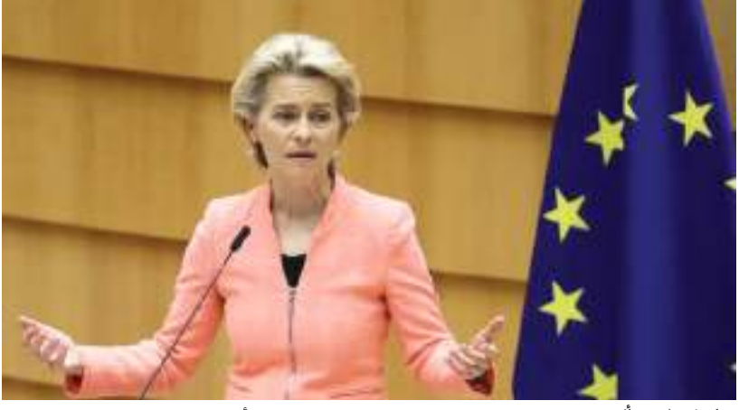
برلين - (د ب أ) -

وعن النقاط الأساسية لسادس حزمة عقوبات من الاتحاد الأوروبي ضد روسيا التي يتم إعدادها حالياً، قالت رئيسة المفوضية الأوروبية: «لازلنا نبحث في القطاع المصرفي، لا سيما سببرينك الذي يمثل وحده ٣٧٪ من القطاع المصرفي الروسي، ويتعلق الأمر بالطبع أيضاً بقضايا الطاقة»، مؤكدة أن الهدف الأساسي هو تقليص مصادر الدخل لـ (الرئيس الروسي فلاديمير بوتين) ودافعت فون دير لاين عن الحكومة الألمانية في ظل الاتهامات الموجهة لها بأنها تعطل العقوبات ضد روسيا، وقالت: «ألمانيا تدعم أوكرانيا منذ أعوام كثيرة، ووافقت على جميع حزم العقوبات الخمس التي اقترحتها خلال ٤٨ ساعة، لم يتصرف الاتحاد الأوروبي بعزم وحسم وهمة من قبل مثلما يتم حالياً، ولألمانيا إسهام في ذلك».