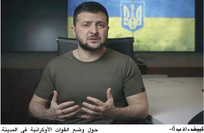
كييف - (د ب أ) -

حول وضع القوات الأوكرانية في المدينة، ووفقاً للمعلومات الروسية، فإن جميع المقاتلين الأوكرانيين المتبقين يتحصنون الآن داخل مصانع الصلب في أزوفستال. وقال زيلينسكي: «هناك طريقتان فقط للتأثير على هذا، إما أن يقدم الشركاء لأوكرانيا كل ما يلزم من أسلحة ثقيلة وطائرات فورا بدون مبالغة، حتى نتمكن من تقليل ضغط المحتلين على ماريوبول وفك الحصار».