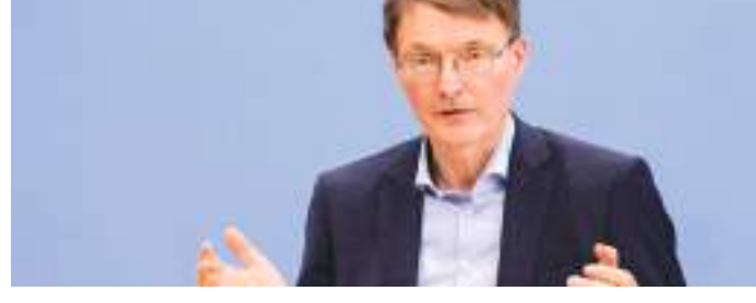
برلين - (د ب أ) -

أطفالي يخافون عليّ، ليس من الصواب أن يضطر أطفال لقراءة أن راديكاليين يريدون اختطاف والدهم». يذكر أن محققين أعلنوا يوم الخميس الماضي أن أعضاء مجموعة برنشة على تطبيق تلجرام ينتمون للجماعة المعروفة باسم «مواطني الرايخ» وكذلك مناهضين لسياسة مواجهة وباء كورونا كانوا يخططون لهجمات تخريبية وعمليات اختطاف، من بينها اختطاف وزير الصحة.