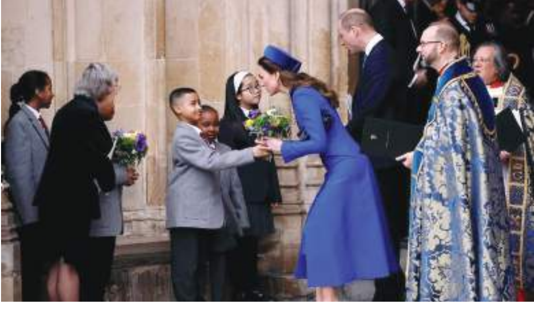
لندن - (د ب أ) -

من المقرر أن يحضر أفراد الأسرة المالكة البريطانية قداس عيد الفصح يوم الأحد في ويندسور، ولكن من غير المتوقع أن تنضم لهم الملكة إليزابيث ملكة بريطانيا.