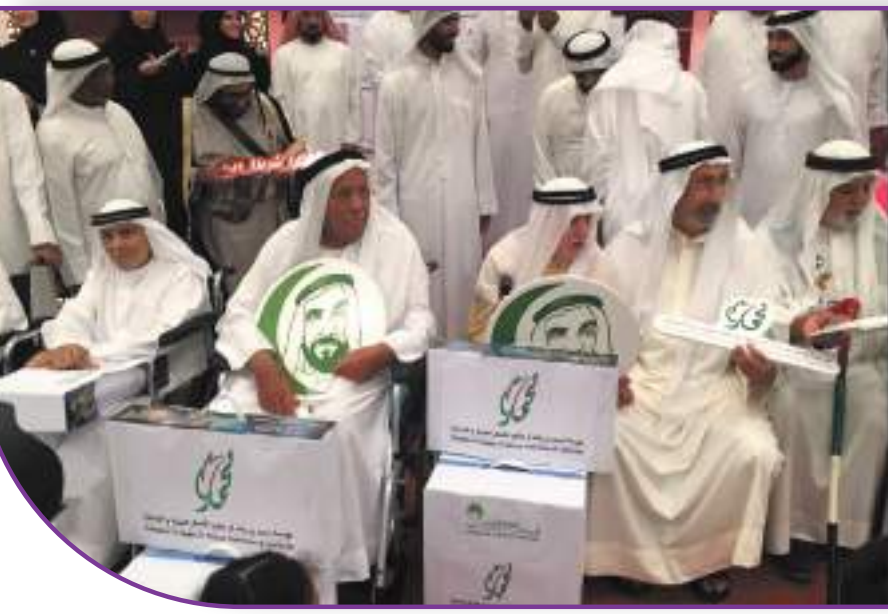
شوابنا وأحتفالية من أجلمهم