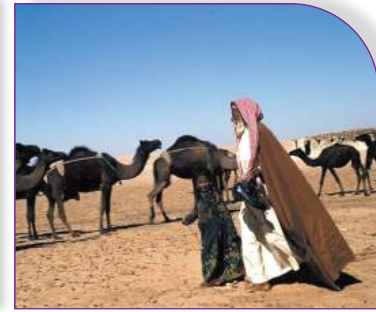
الجد البركة والحفيدة في البرية مع الحلال