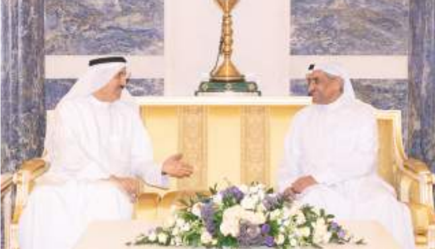
حاكم الفجيرة خلال استقباله رئيس وأعضاء المجلس الوطني الاتحادي