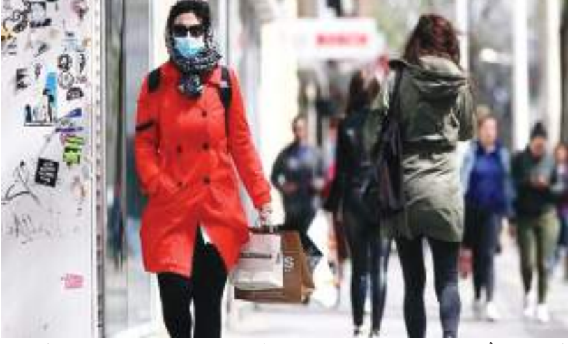
فيينا - (د ب أ) -

وأظهرت بيانات جونز هوبكنز الأمريكية يوم الأحد أيضاً أنه تم إعطاء ١٨ مليوناً و ٢٣٠ ألفاً و ٣٠ جرعة من اللقاح المضاد لفيروس كورونا المستجد في النمسا حتى الآن. ويشار إلى أن جرعات اللقاح وأعداد السكان الذين يتم تطعيمهم هي تقديرات تعتمد على نوع اللقاح الذي تعطيه الدولة، أي ما إذا كان من جرعة واحدة أو جرعتين.