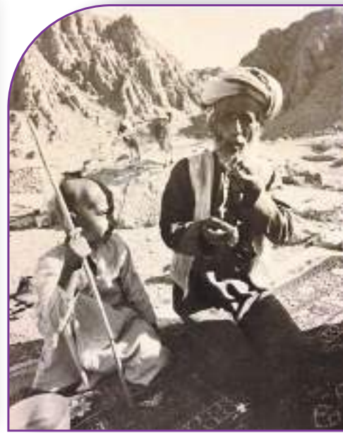
الأب والإبن في حياة الأمس